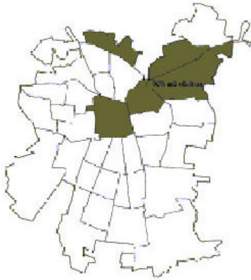
Plano 3. Localización del 96% del total de metros cuadrados de oficina