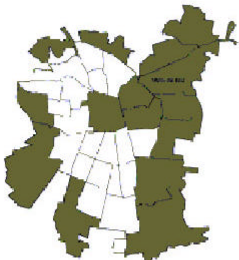
Plano 1. Localización del 90% de metros cuadrados aprobados, 1990/1996

El crecimiento de la ciudad se ha dado siguiendo sólo las tendencias del mercado: