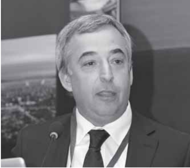
Andrés Arriagada, presidente de la Comisión de Descentralización.