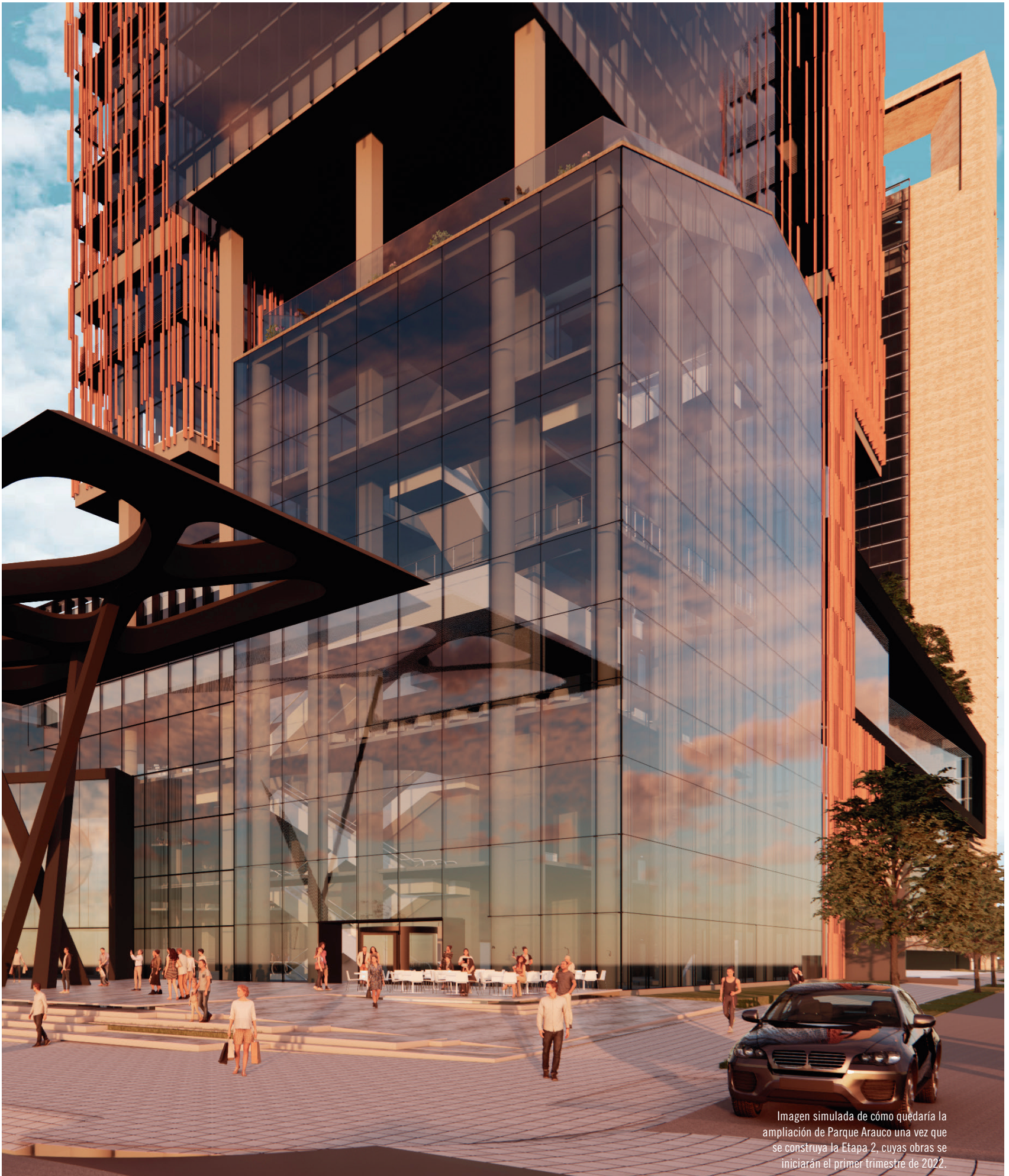
Imagen simulada de cómo quedaría la ampliación de Parque Arauco una vez que se construya la Etapa 2, cuyas obras se iniciarán el primer trimestre de 2022.