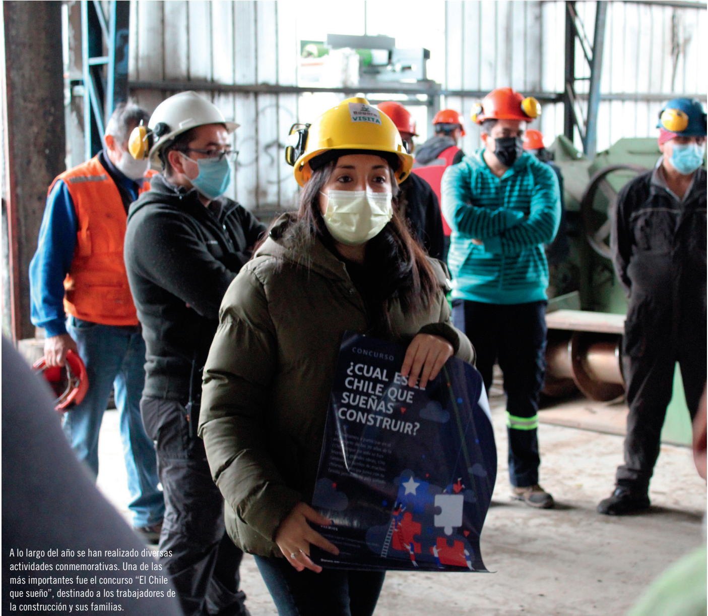
A lo largo del año se han realizado diversas actividades conmemorativas. Una de las más importantes fue el concurso “El Chile que sueño”, destinado a los trabajadores de la construcción y sus familias.

yan sido un aporte al desarrollo social y a la calidad de vida de las personas. Incluye un trabajo escrito de un máximo de diez páginas con aspectos técnicos, características arquitectónicas e históricas de las obras que hagan énfasis en sus desafíos constructivos, fotografías y un video explicativo de la experiencia de la investigación con un máximo de un minuto de duración. A partir de los resultados, se realizará una exposición itinerante por distintas ciudades del país que muestre algunas obras importantes.