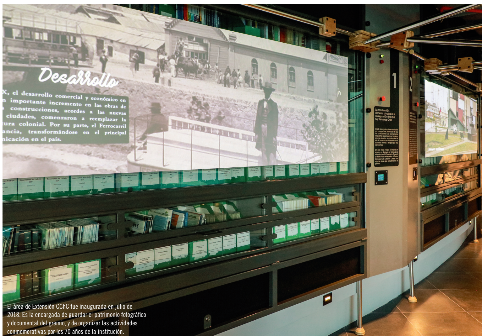
El área de Extensión CChC fue inaugurada en julio de 2018. Es la encargada de guardar el patrimonio fotográfico y documental del gremio, y de organizar las actividades conmemorativas por los 70 años de la institución.