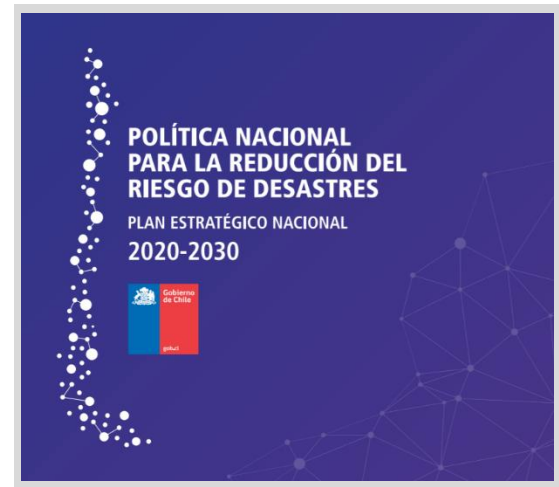
Imagen: ONEMI, 25 de abril de 2021.

Fecha: Diario Oficial, 17 de abril de 2021.