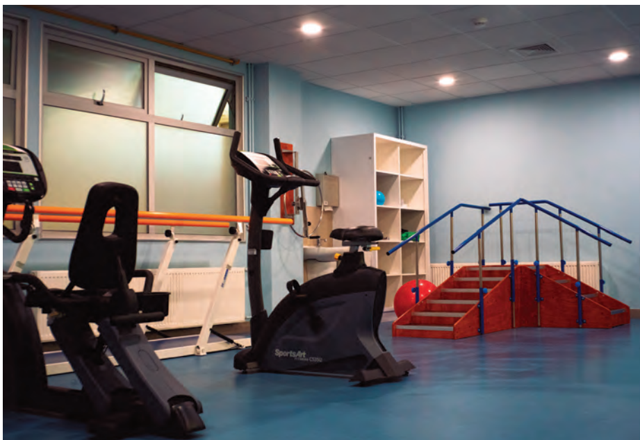
El hospital dispone de modernos equipos. Entre ellos, se aumentó la dotación de los destinados a la recuperación kinésica.

El director del hospital destaca la incorporación de áreas como la sala de parto, donde la matrona puede acompañar a las mujeres durante todo el trabajo de parto. Además, son nuevas la sala de atención inmediata del recién nacido y la sala de fototerapia.