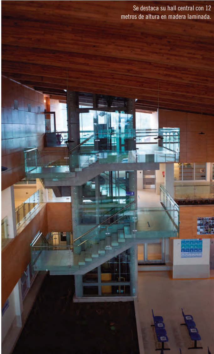
Se destaca su hall central con 12 metros de altura en madera laminada.