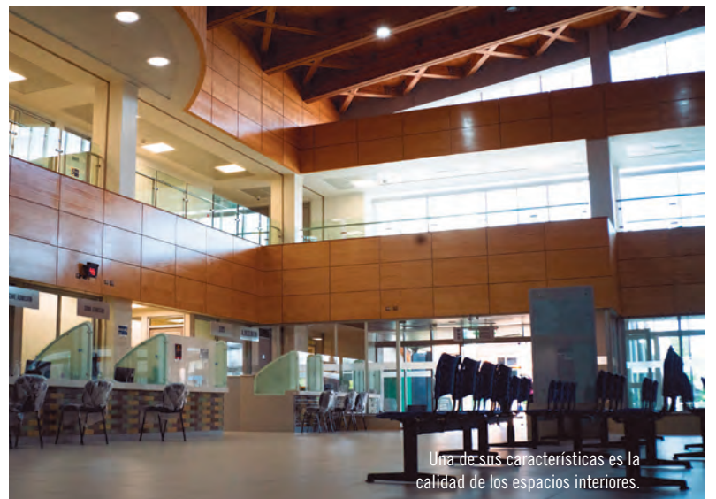
Una de sus características es la calidad de los espacios interiores.