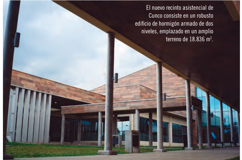
El nuevo recinto asistencial de Cunco consiste en un robusto edificio de hormigón armado de dos niveles, emplazado en un amplio terreno de 18.836 m 2 .