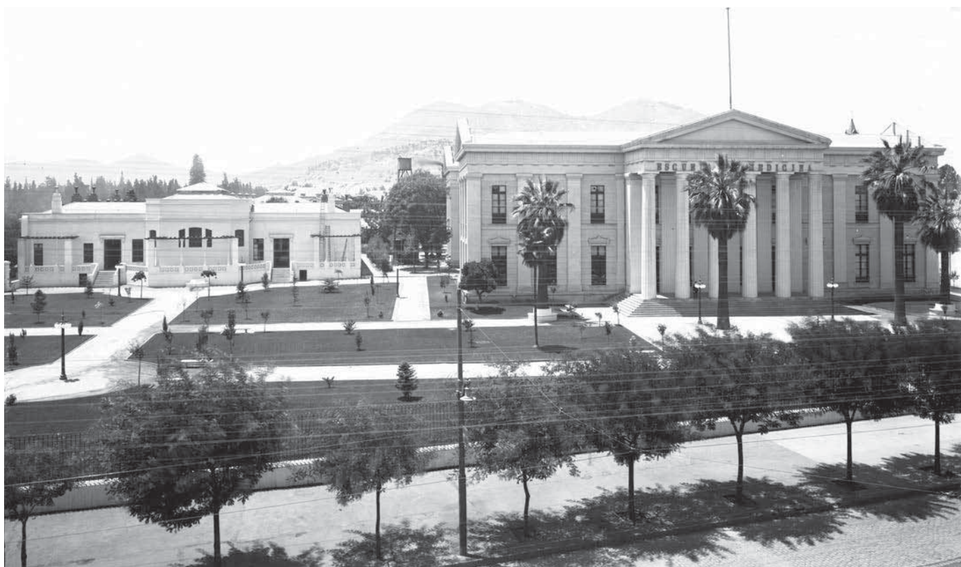
Escuela de Medicina de la Universidad de Chile, sin fecha.

Fachada exterior del Hospital Roy H. Glover, perteneciente a la mina de Chuquicamata, Región de Antofagasta.