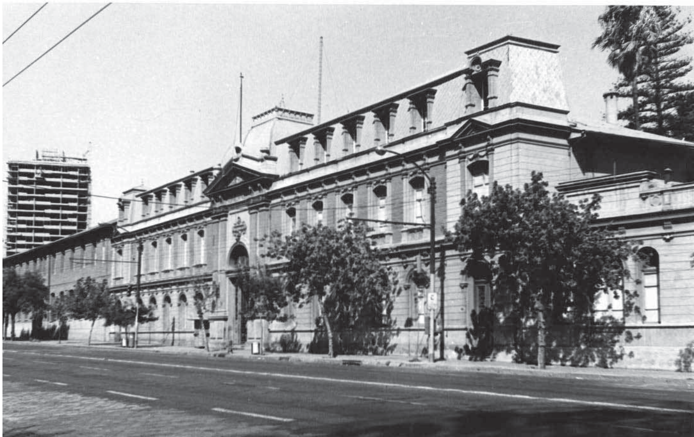
Fachada del Hospital San Borja, década 1960. Fachada del Hospital San Borja durante la década de 1960, en la sede ubicada entre las calles Portugal y Vicuña Mackenna. Fotógrafo desconocido.