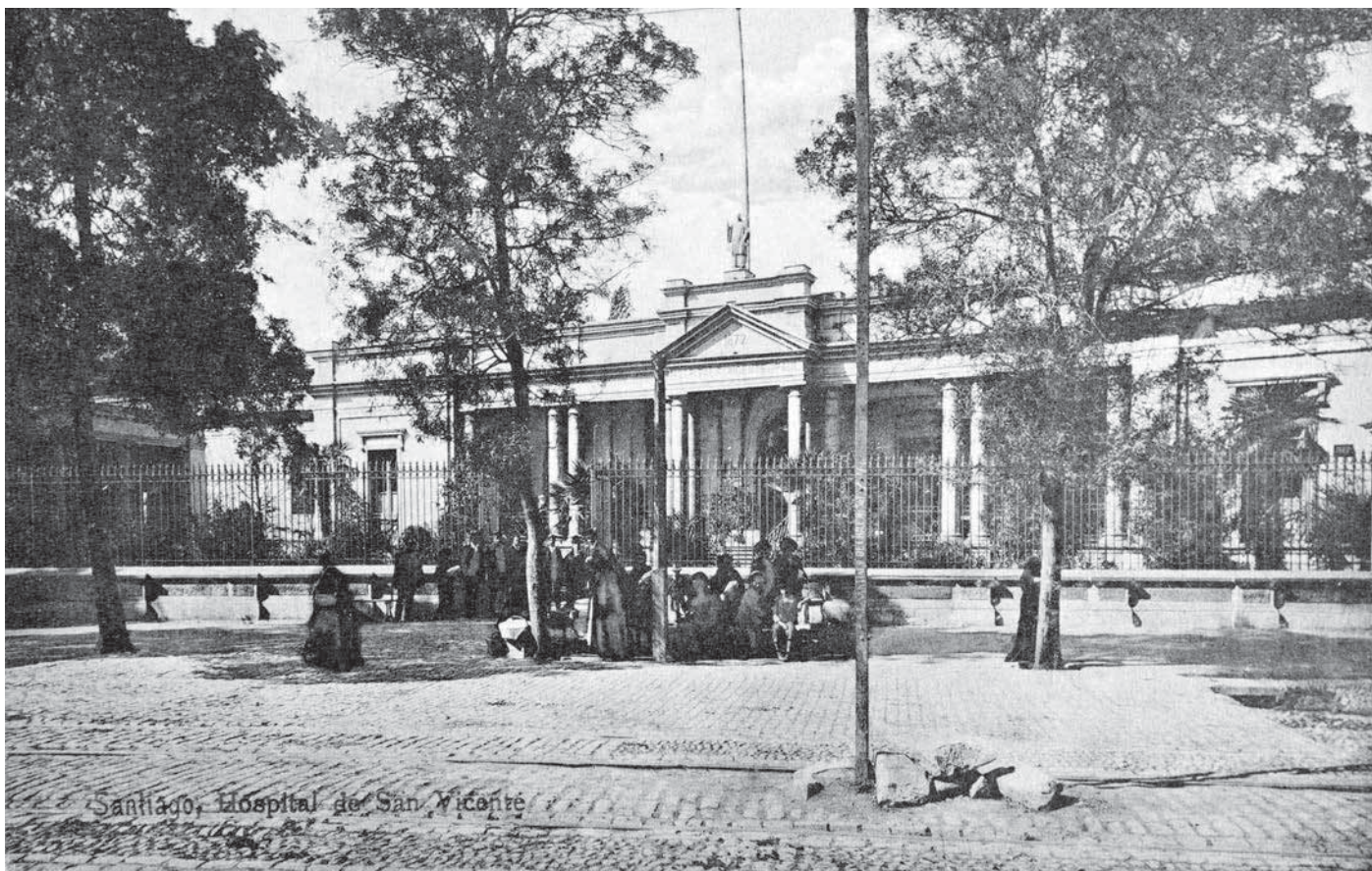
Hospital San Vicente de Paul, Santiago, sin fecha. Imagen del acceso al Hospital de San Vicente de Paul (actual Hospital Clínico de la Universidad de Chile), que se ubicaba en avenida Independencia.