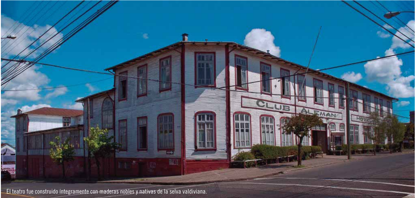
El teatro fue construido íntegramente con maderas nobles y nativas de la selva valdiviana.