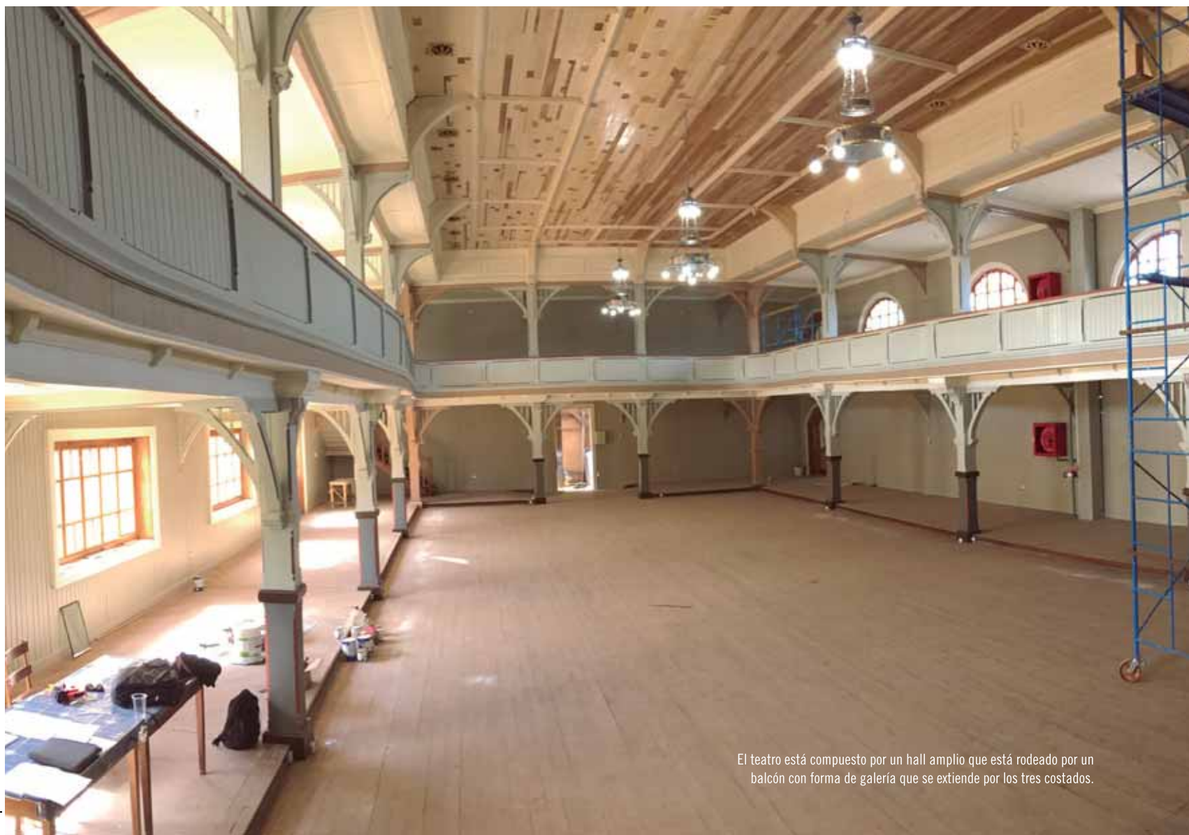
El teatro está compuesto por un hall amplio que está rodeado por un balcón con forma de galería que se extiende por los tres costados.

Por Victoria Hernández