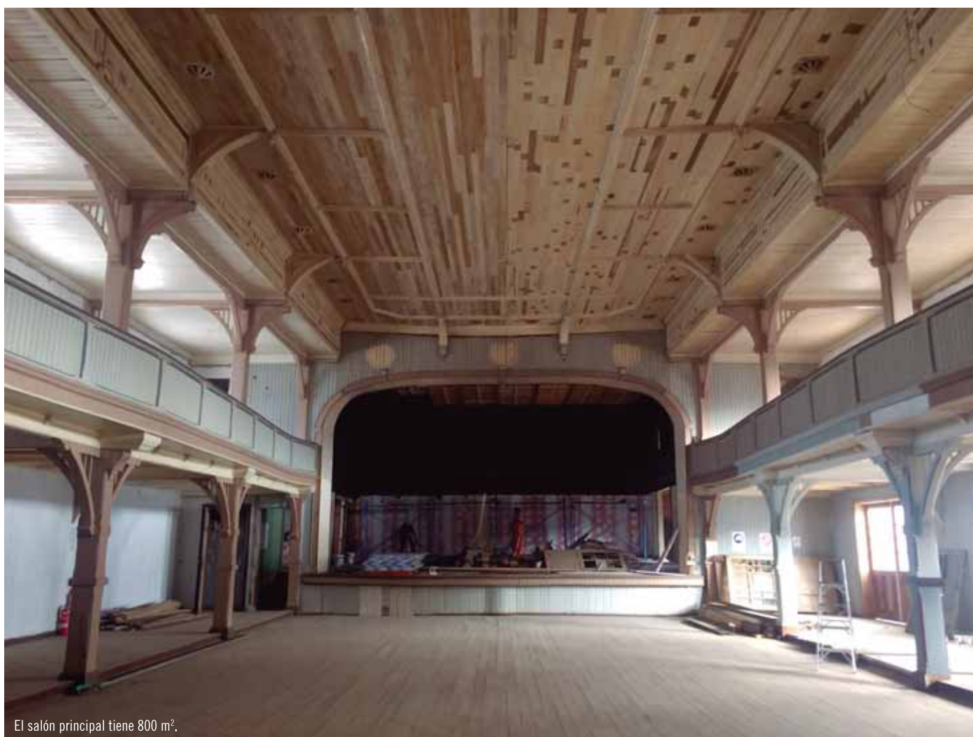
El salón principal tiene 800 m 2 .

Después de más de 100 años de haber sido construido, el Teatro del Club Alemán de la ciudad de La Unión volverá a transformarse en un foco para la cultura de la Región de Los Ríos. El proceso de restauración, que ha sido encabezado por la Corporación Patrimonio Edificado y Contexto (PEC) y el Club Alemán de La Unión, culmina en enero y permitirá al recinto abrir sus puertas al público en marzo de 2020.