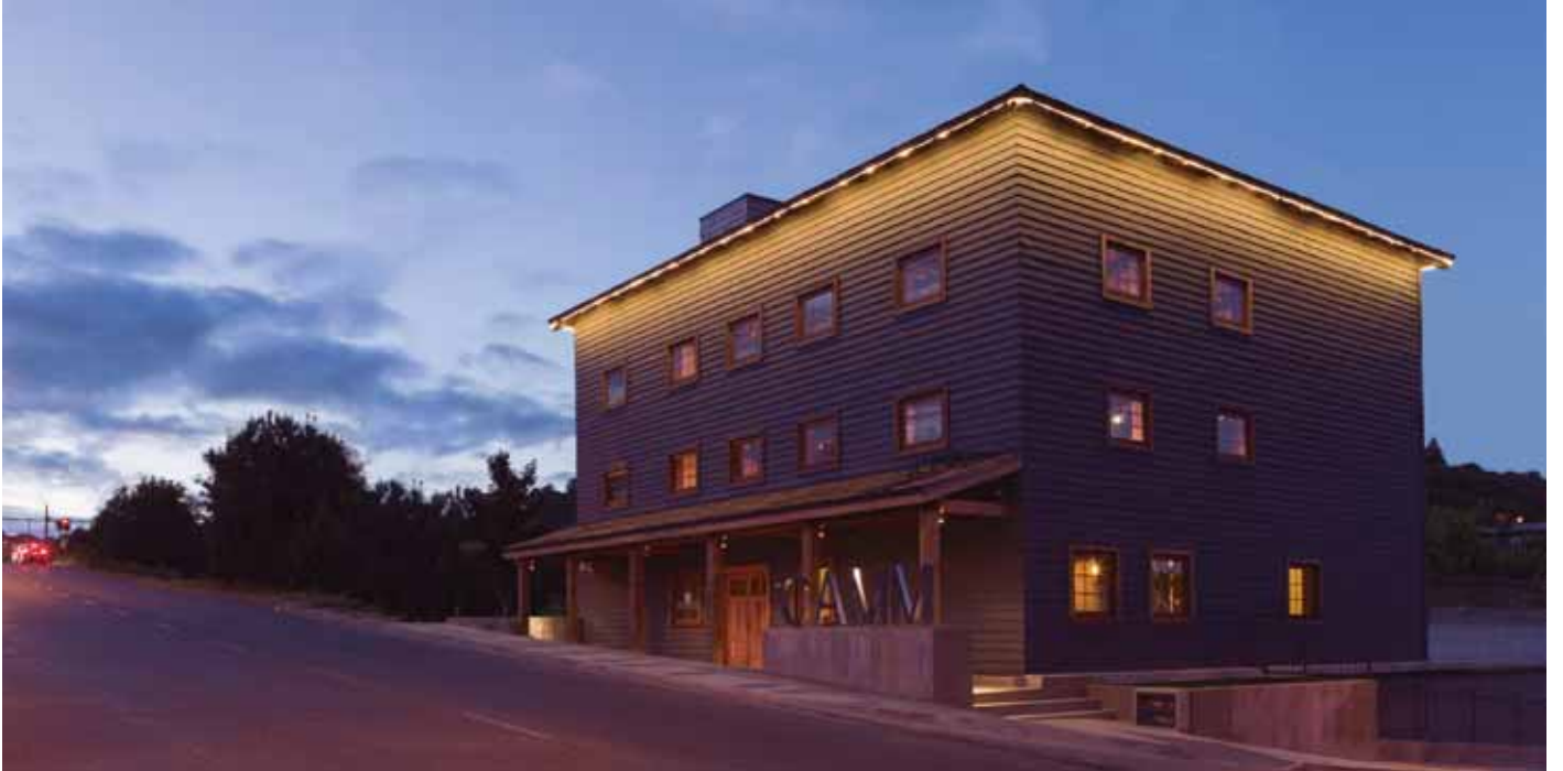
(Arriba) Centro de Arte Molino Machmar, 2017.

Centro de Arte Molino Machmar, Puerto Varas, después de su restauración, la que tuvo la participación de la Constructora Baker Ltda. Imagen perteneciente al Archivo Técnico de la Dirección de Arquitectura del Ministerio de Obras Públicas.