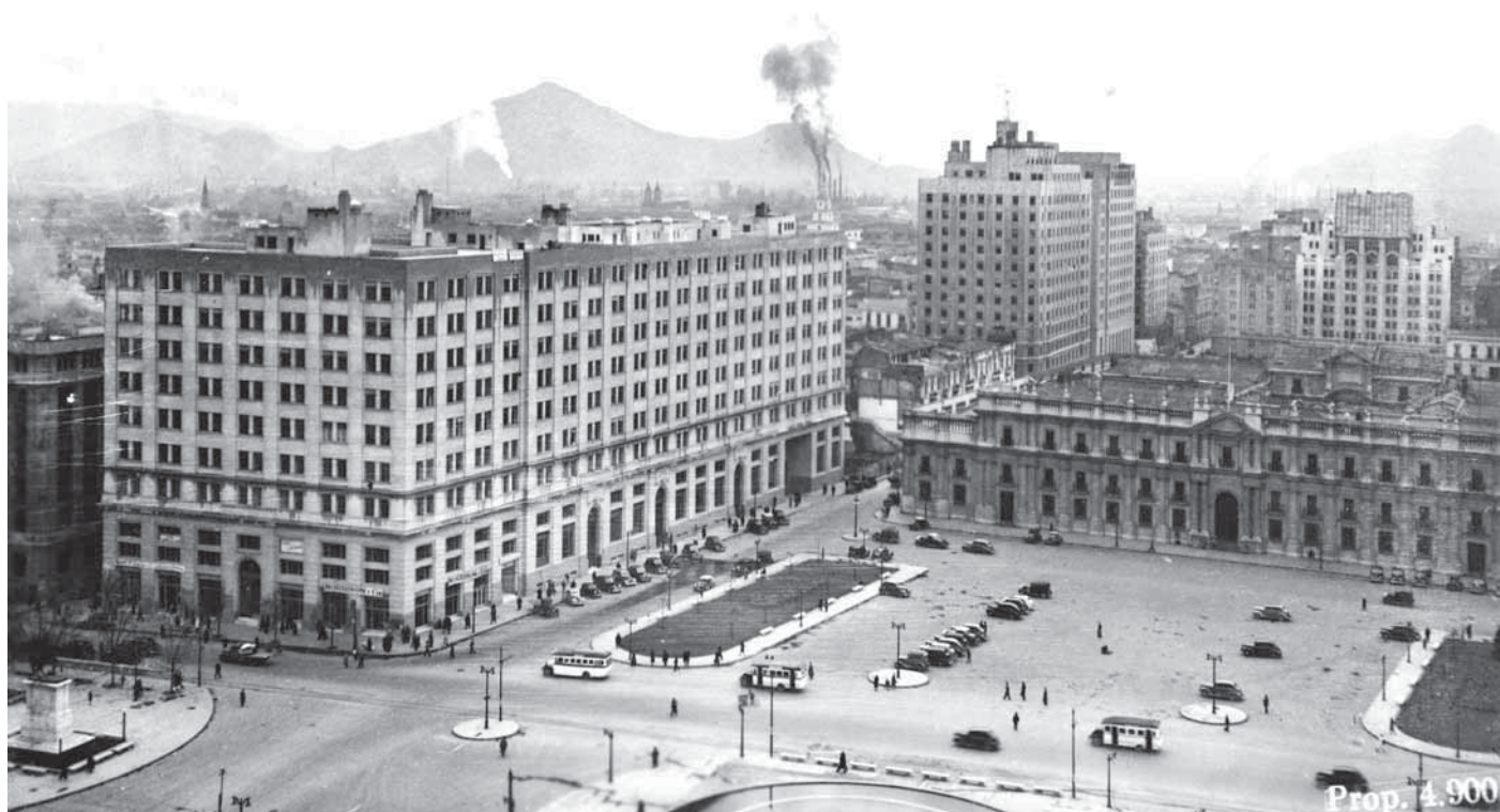
Plaza General Bulnes, Santiago, Chile, sin fecha. Imagen del Palacio de La Moneda y uno de los edificios del barrio cívico por calle Teatinos.