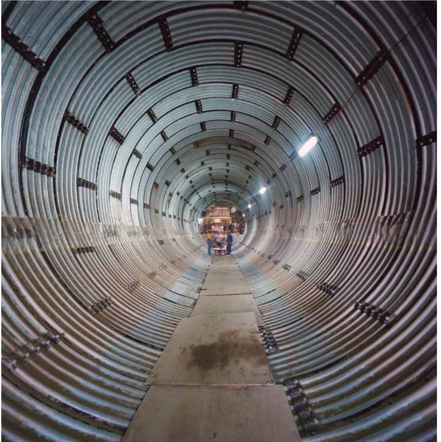
Interior de un molino de mineral, 1989. Imagen en perspectiva del interior de un molino de mineral durante su instalación.