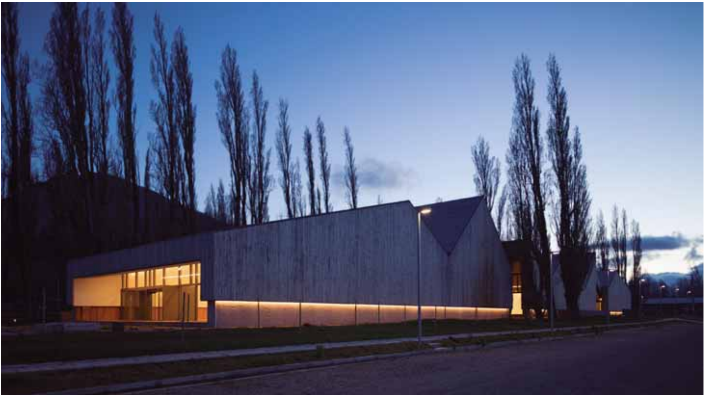
(Abajo) Museo Regional de Aysén, 2017.

Perspectiva del Museo Regional de Aysén, ubicado en las afueras de Coyhaique. Obra con la participación de Miguel Luis Lagos y la Constructora L y D S. A.