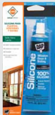
SILICONA PARA PUERTAS Y VENTANAS