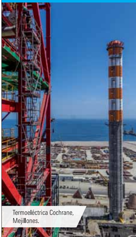
Termoeléctrica Cochrane, Mejillones.