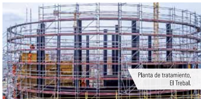
Planta de tratamiento, El Trebal.