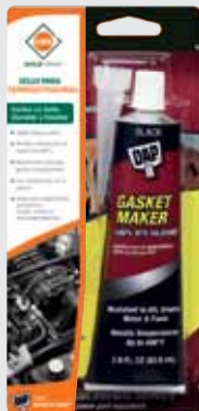
SELLO PARA EMPAQUETADURA