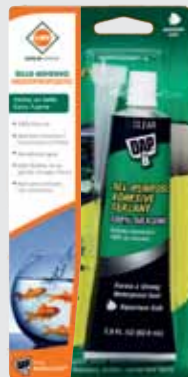
SELLO ADHESIVO MULTIPROPOSITO