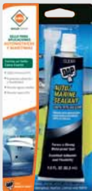
SELLO PARA APLICACIONES AUTOMOTRIZ Y MARITIMAS