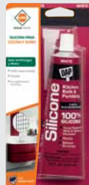
SILICONA PARA COCINA Y BAÑO