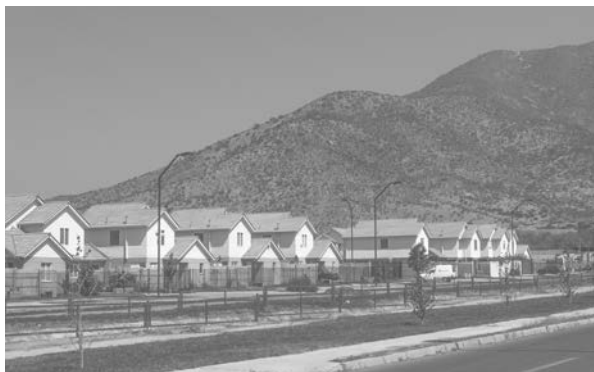
FIGURA 2. VIVIENDAS UNIFAMILIARES EN LA CIUDAD SATÉLITE LARAPINTA, LAMPA