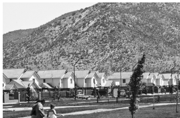
FIGURA 10. LA CASA EN LA CIUDAD SATELITE, AUN GENERANDO ALTA PRECARIEDAD ECONOMICA PARA UN GRUPO DE HABITANTES, RESULTA UNA CONQUISTA FAMILIAR A LA QUE NO ESTÁN DISPUESTOS A RENUNCIAR

La ciudad satélite en Lampa muestra un perfil de habitante más ambicioso y exigente con la definición de su entorno residencial. Se relocalizaron en la ciudad satélite motivados por un ideal de “ciudad a la carta”. Ser capaces de moldear su vida urbana acorde a sus gustos e intereses. Esto es, habitar la ciudad satélite periurbana, usar selectivamente determinadas autopistas, consumir y socializar en determinados malls; excluyendo al mismo tiempo elementos negativos de la ciudad tradicional como delincuencia, contaminación, etc. Su éxodo desde el Gran