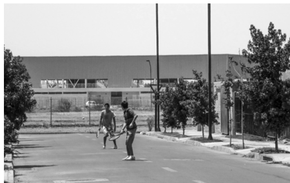
FIGURA 8. NIÑOS JUGANDO EN LA CALLE EN LARAPINTA. ENTREVISTAS DESTACAN LA BAJA DISPONIBILIDAD DE MULTICANCHAS COMO UN ELEMENTO QUE AFECTA EL USO DE ESPACIOS PÚBLICOS

Paradójicamente aunque optan por una vida en asentamientos privados, el/la habitante exige el desarrollo de una “mini ciudad” con servicios e infraestructura de carácter público. Esta aspiración muestra dos dificultades. Primero, el tamaño poblacional de estos proyectos no muestra la suficiente masa crítica capaz de viabilizar la localización de equipamiento de salud o comercio de mayor complejidad. Segundo, la generación de asentamientos privados aislados del centro urbano principal de Lampa, entra en conflicto con la planificación territorial que instituciones como Carabineros o Bomberos realizan. El desfase entre