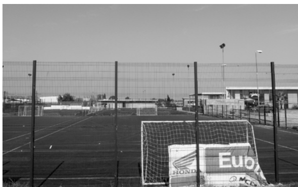
FIGURA 7. CLUB DEPORTIVO PRIVADO EN LA CIUDAD SATÉLITE VALLE GRANDE