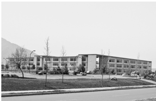
FIGURA 5. COLEGIO PROPIEDAD DE LA EMPRESA CONSTRUCTORA DEL PROYECTO CIUDAD SATÉLITE LARAPINTA.