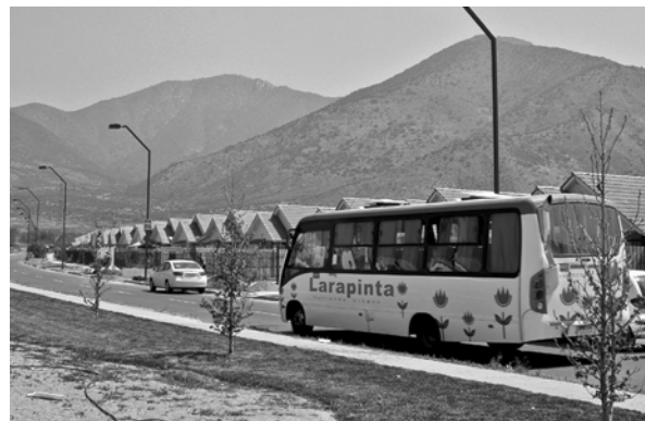
FIGURA 6. TRANSPORTE PÚBLICO EN EL PROYECTO LARAPINTA.