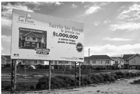
FIGURA 3. PUBLICIDAD INVITANDO A FAMILIAS QUE ACCEDIERON A SUBSIDIO PARA LA CLASE MEDIA A MIGRAR HACIA LA CIUDAD SATÉLITE DE VALLE GRANDE