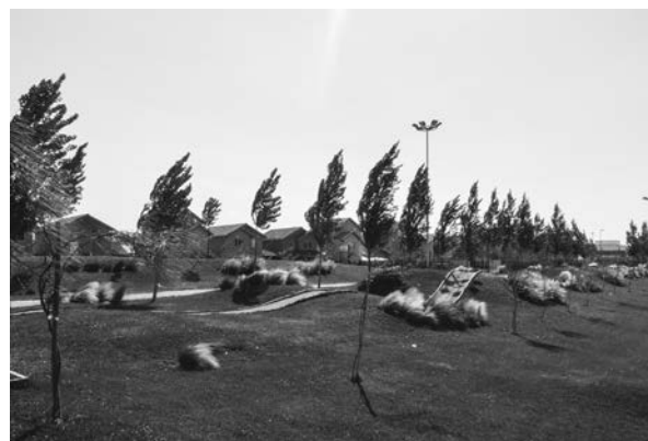
FIGURA 4. EL ACCESO A ÁREAS VERDES, INACCESIBLE EN SUS BARRIOS DE ORIGEN, APARECE COMO ELEMENTO ALTAMENTE VALORADO POR LAS FAMILIAS