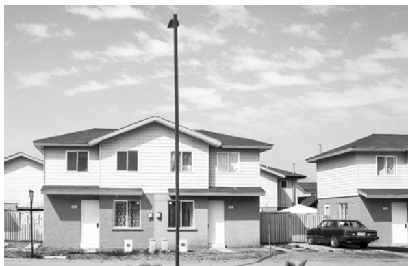
FIGURA 9. LA CIUDAD SATELITE SUPONE EL AUMENTO EN EL COSTO DE VIDA ASOCIADO A LA DISPONIBILIDAD EXCLUSIVA DE EQUIPAMIENTO LOCAL PRIVADO Y LA NECESIDAD DE MOVILIDAD INTENSIVA HACIA SANTIAGO