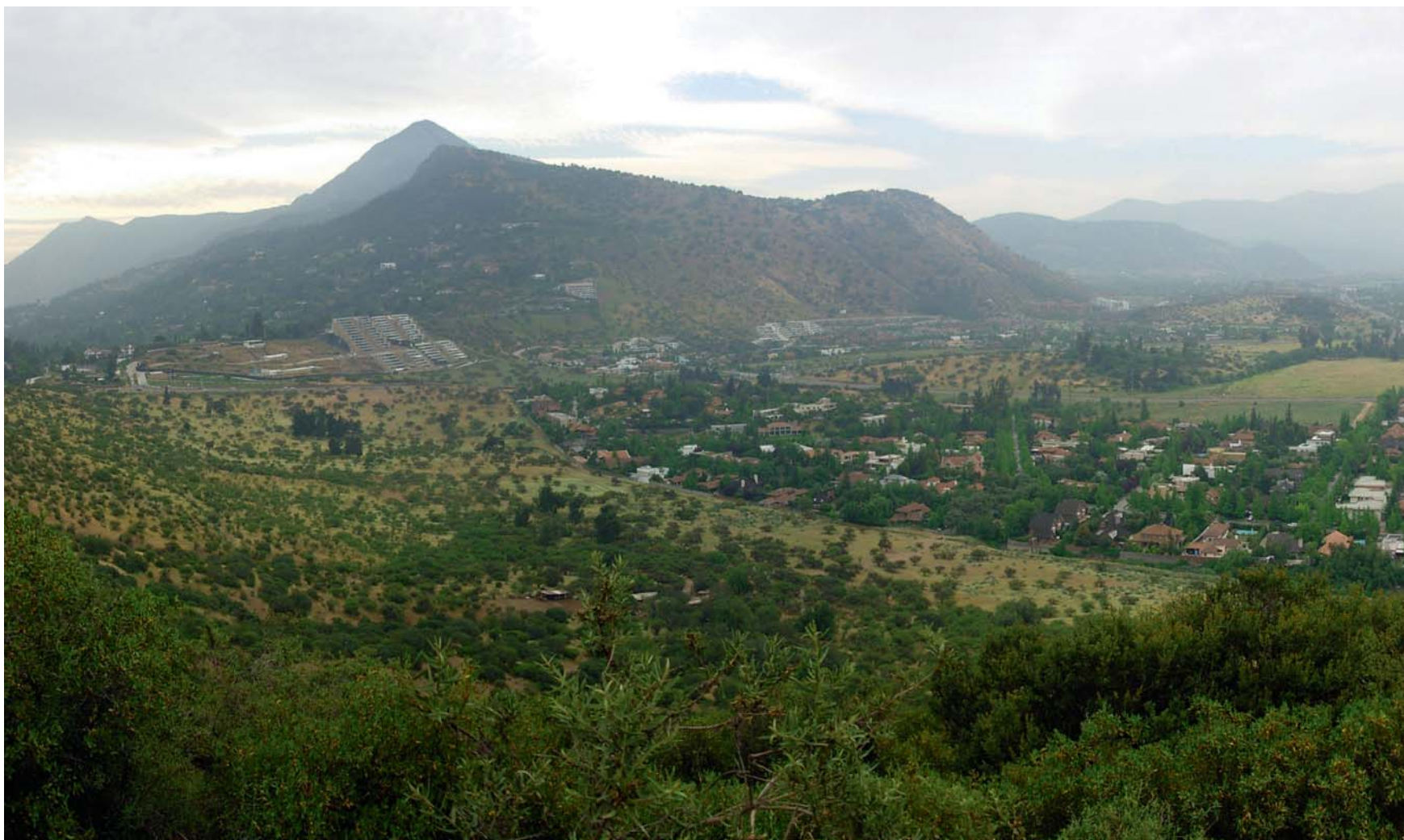
Vista del Cerro del Medio y Manquehue desde el Cerro Alvarado.

Además de los reconocidos cerros Santa Lucía y San Cristóbal –visitas obligadas de turistas extranjeros por su valor patrimonial y turístico–, la cuenca de Santiago cuenta con otros 24 cerros isla ubicados en la trama urbana de la ciudad. Éstos superan las seis mil hectáreas de terreno y equivalen a diez veces la superficie del San Cristóbal. Del total, quince pertenecen a privados y nueve conforman espacios públicos, de acuerdo a un catastro elaborado en 2012 por “Santiago Cerros Isla”, fundación nacida al alero de un grupo de investigadores de la Universidad Católica.