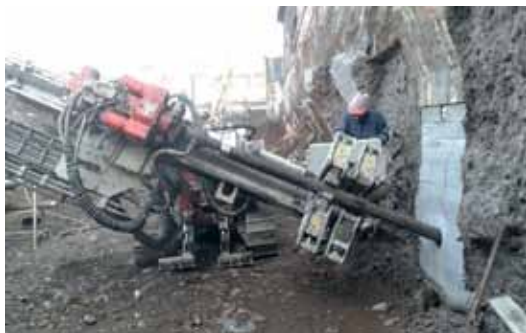
ANCLAJES POSTENSADOS TEMPORALES EDIFICIO PLAZA CORDOVA - LAS CONDES