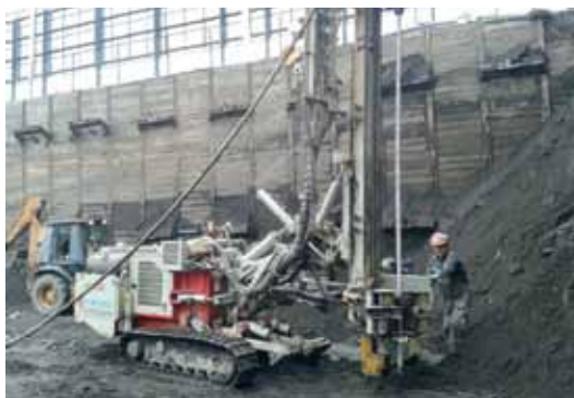
MICROPILOTES AUTOPERFORANTES EDIFICIO COSTANERA CONCEPCIÓN

La organización del evento, que se prolongará durante 12 días en 34 escenarios distintos, es realizada por Santiago 2014, una corporación privada sin fines de lucro, formada por el Instituto Nacional de Deportes (IND) y el Comité Olímpico de Chile (COCh).