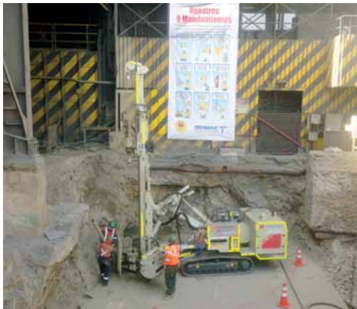
MICROPILOTES PERMANENTES FUNDACIÓN TOLVA CALCINA - FUNDICIÓN CHUQUICAMATA

ANCLAJES • MICROPILOTES • SOIL NAILING • FORTIFICACIONES