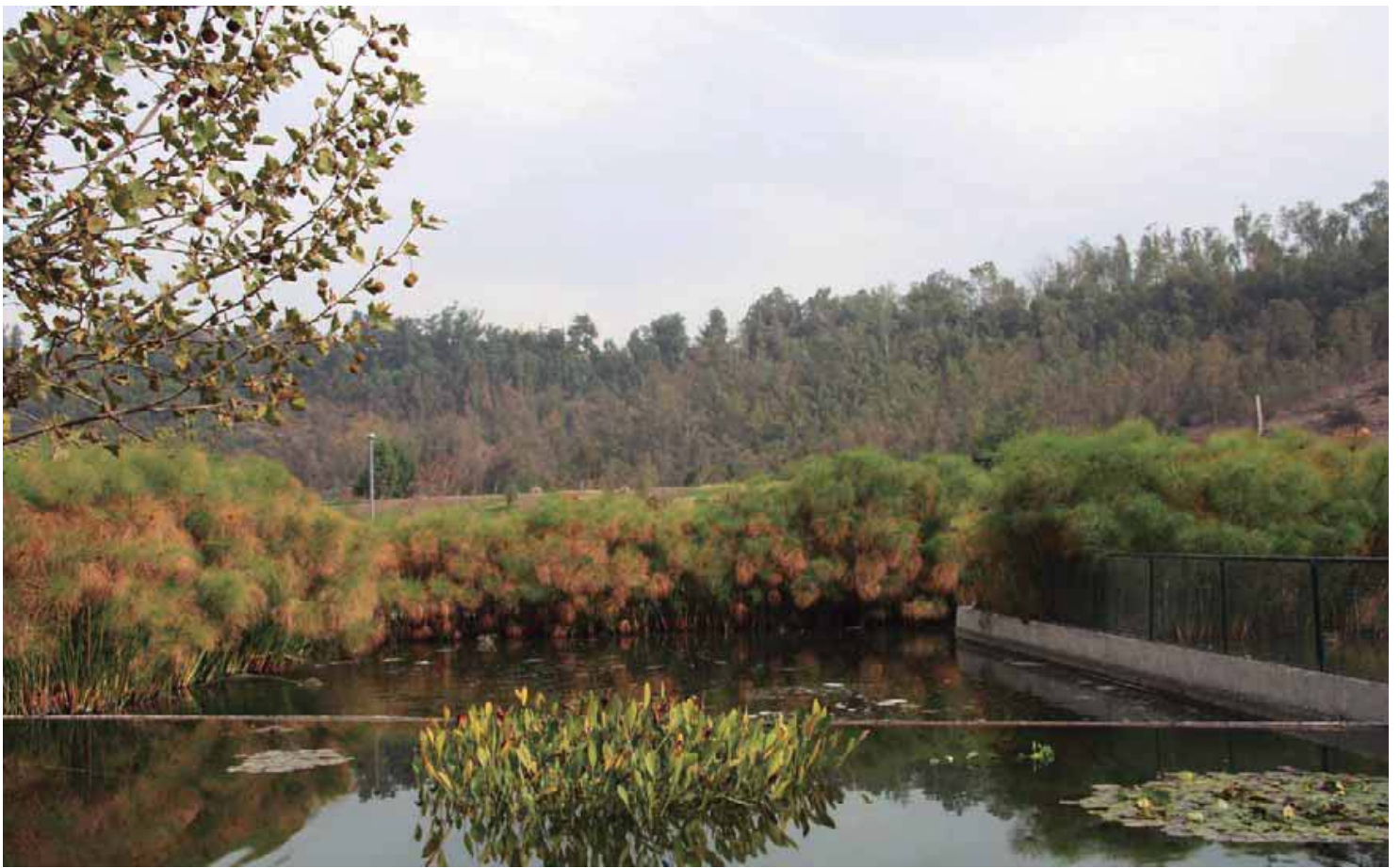
Existen dos lagunas distribuidas a lo largo y ancho del Parque Bicentenario, donde pueden verse peces y hasta cisnes.