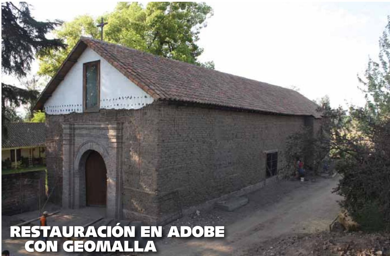
RESTAURACIÓN EN ADOBE CON GEOMALLA

ALEJANDRO PAVEZ V. PERIODISTA REVISTA BIT