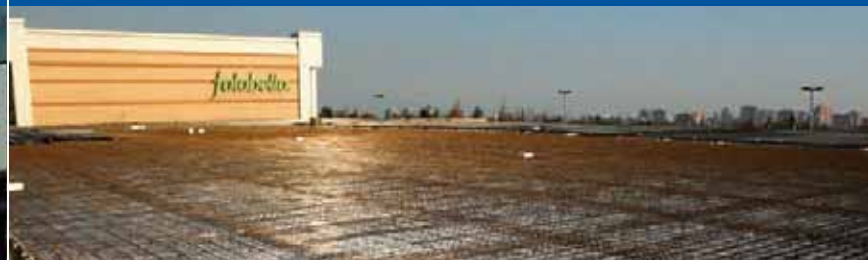
PANELES Y CUBIERTAS PACKING AGRÍCOLA AGROBOSQUES SAN ISIDRO