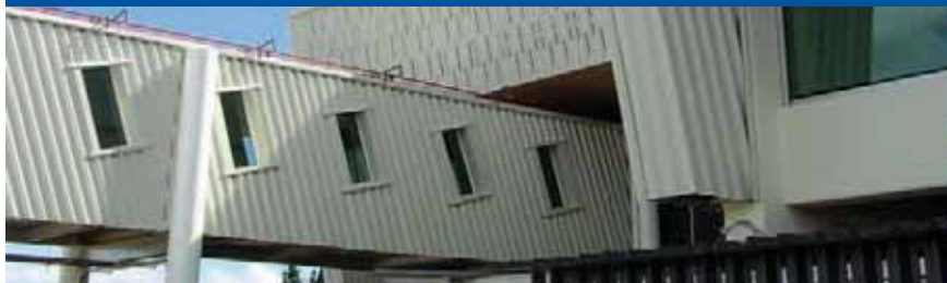
TECHOS URBANIZACIÓN EN PUERTO MONTT