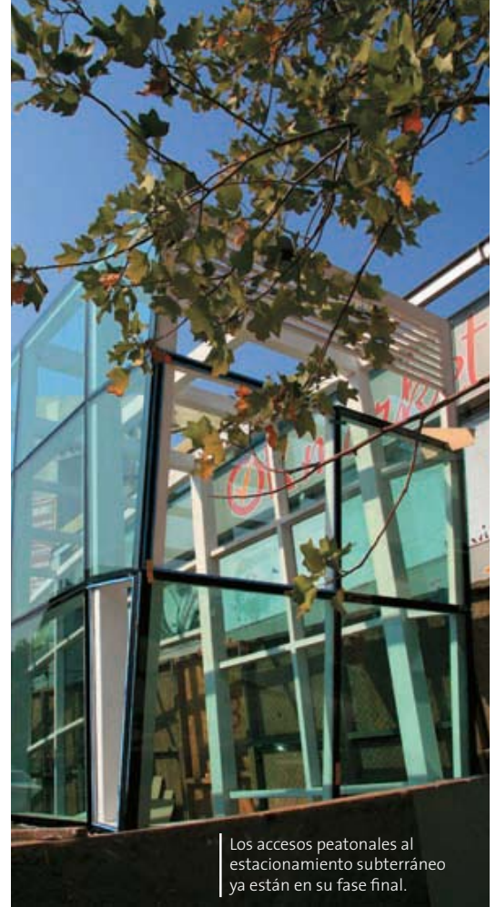
Los accesos peatonales al estacionamiento subterráneo ya están en su fase final.

Además del proceso de construcción que se utilizó, el proyecto presenta algunas otras particularidades que diferencian a éste de otros estacionamientos. Las plantas de los niveles -2 y -3 son libres, sin pilares que interfieran con las dimensiones de los sitios destinados a los automóviles. Cada puesto, a su vez, mide 2,5 (ancho) por 5 metros (pro- fundidad), con alturas de 2,75 en el -1 y de 2,5 metros en los subterráneos -2 y -3, y la vía de acceso tiene 5,5 metros de ancho. Todo ello facilita que puedan acceder vehículos gran-