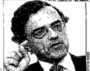
Ministro de Transportes y Telecomunicaciones, René Cortázar.