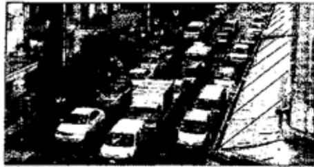
TRÁNSITO LENTO. — En Agustinas, entre el Paseo Ahumada y el Paseo Estado, los vehículos se estacionan a los dos lados de la vía.