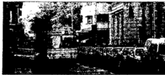
EJEMPLO. — A diario, carros y motos policiales se estacionan en Santo Domingo, en donde se ubica una comisaría. Dichas ocupan parte de la vereda.

A Santiago ingresan, en promedio, 14 mil automóviles nuevos por mes: Estacionamientos en calles del centro impiden el flujo expedito de vehículos