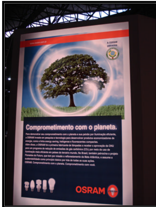
Stand de OSRAM en FERIA FEICON BATIMAT