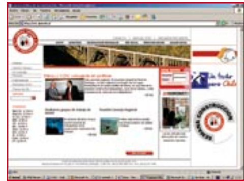
El Proyecto ProSocio representó una inversión de 200 millones de pesos.

ineficiencias. Es por esto que la Cámara se vio ante el desafío de desarrollar un sistema que le permitiera compartir el conocimiento entre los equipos con mayor rapidez y en tiempo real, mantener comunicados a los socios y, al mismo tiempo, aumentar la productividad. “Estas cosas no se estaban resolviendo. Lo que pasaba en Punta Arenas le llegaba tarde a la persona de Santiago, el portal público es malo, no existe un portal privado o lo que hay es sumamente vago... Nos dimos cuenta de que la única manera de resolver todo esto era a través de una página en un solo portal, un espacio amigable”, cuenta Busel, gestor del flamante Proyecto ProSocio que debuta en marzo y que se basó en una experiencia similar que hizo en su empresa constructora.