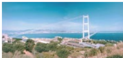
El puente sobre el Estrecho de Messina tiene un vano principal de 3.300 metros, siendo el viaducto colgante más grande del mundo.

El puente de vano único puede resistir terremotos de 7,1 en la escala de Richter, un dato no menor considerando que un sismo devastó Messina en 1908. Asimismo, puede soportar vientos de hasta 216 kilómetros por hora gracias a su diseño aerodinámico. En cuanto a la ejecución, se utilizará gran cantidad de materiales prefabricados para tener las máximas garantías en términos de calidad, cumplimiento de los plazos de construcción e impacto mínimo en el medio ambiente.