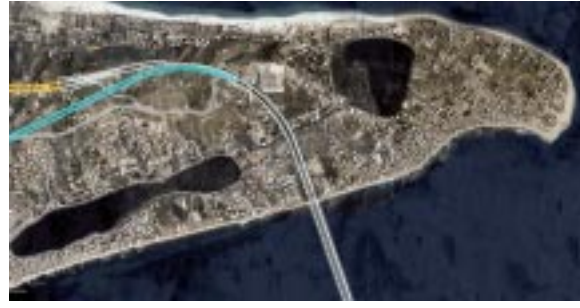
Imágenes satelitales muestran la ubicación del futuro puente y sus accesos.