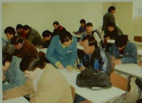
Trabajadores de la construcción en el Programa Nivelación de Estudios desarrollado en Santiago.