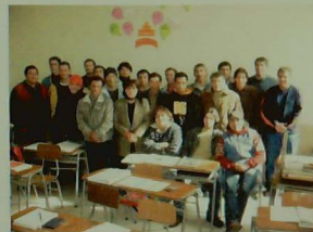
Programa Nivelación de Estudios, Viña del Mar.