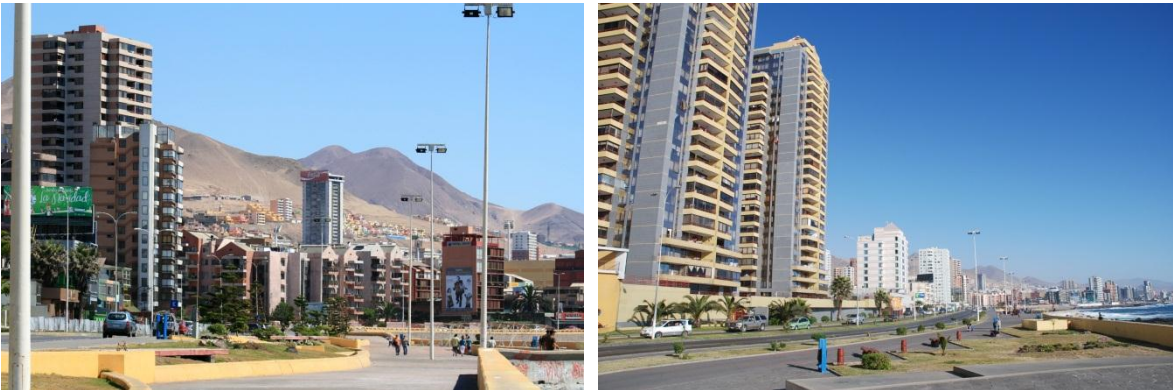
Figura N° 1 Desarrollo urbano sector avenida Grecia, Antofagasta

En el caso de la primera de ellas, las inversiones inmobiliarias en densidad se han concentrado fuertemente en el sector de la avenida Grecia, siguiendo la inversión realizada para mejorar el paseo costero de ese sector.