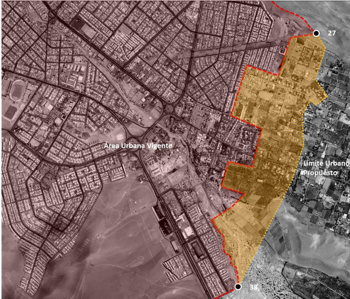
Figura Nº 4 Propuesta corrección límite urbano oriente