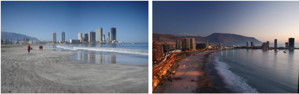
Figura Nº 2 Desarrollo urbano sector Cavancha Iquique

playa homónima en donde se han implementado importantes proyectos de mejoramiento del espacio público así como el casino de la ciudad- y el de Playa Brava, que actualmente está en proceso de consolidación impulsado por las recientes inversiones en los espacios públicos costeros del área.