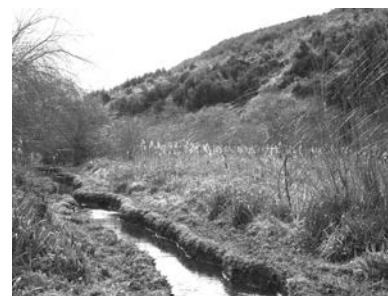
C2 (M): Estero Leña Seca