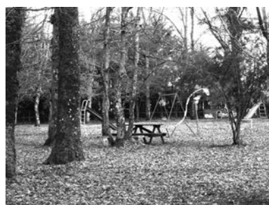
C6 (M): Parque Inés de Suarez