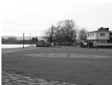
C5 (M): Helipuerto Sector Costanera