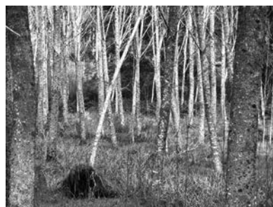
C1 (M): Cerros de Collico