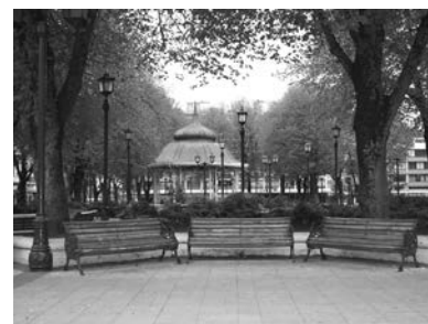
C6 (H) y C4 (M): Plaza de la República