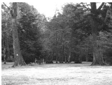
C8 (H y M): Parque Saval