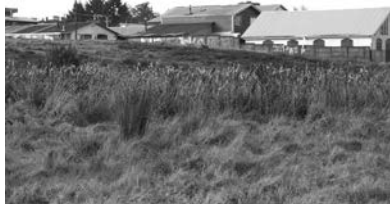
C1 (H): Hualve Av. Francia