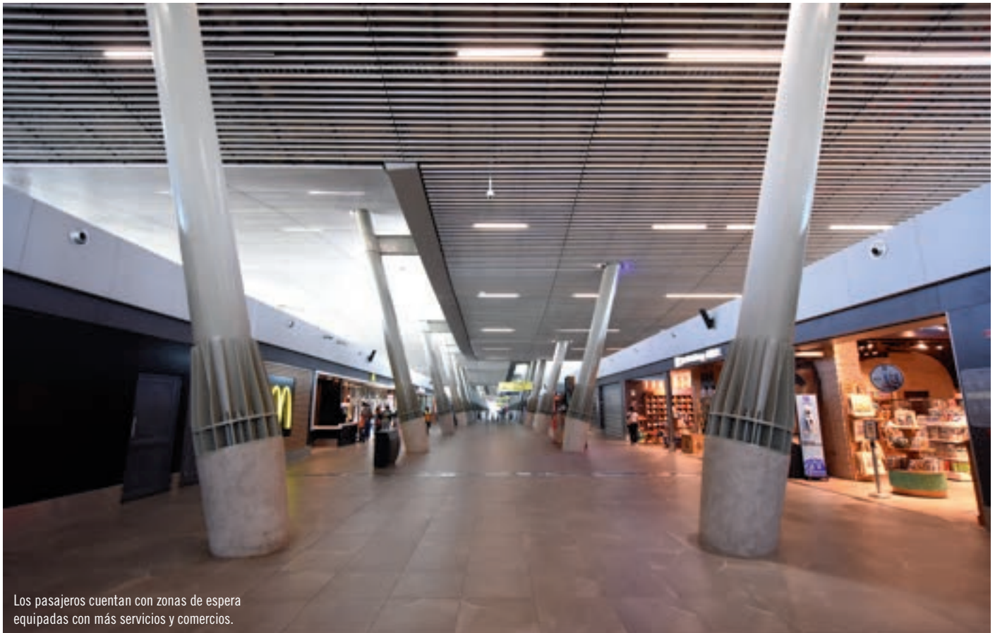
Los pasajeros cuentan con zonas de espera equipadas con más servicios y comercios.

Los casi US$ 1.000 millones que costó el nuevo terminal (T2) del Aeropuerto Arturo Merino Benítez, es la cifra más alta en la historia del sistema de concesiones del Ministerio de Obras Públicas (MOP) para edificar infraestructura pública en Chile. El hito es también concordante con las dimensiones de la colosal obra, que requirió cinco años para construirse y que mejorará de manera importante el servicio aeroportuario para los pasajeros de vuelos internacionales.