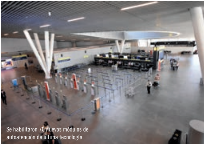
Se habilitaron 70 nuevos módulos de autoatención de última tecnología.