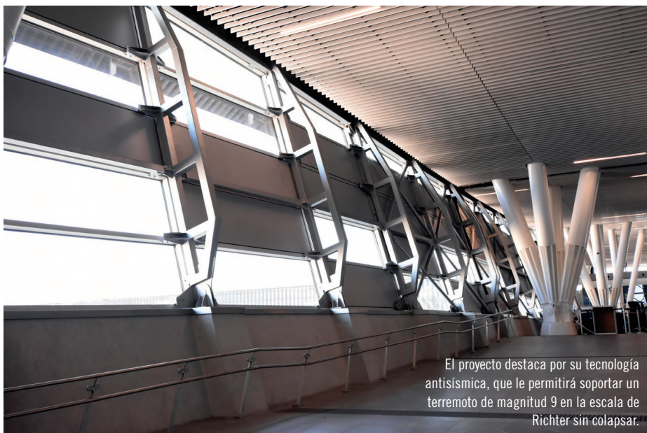
El proyecto destaca por su tecnología antisísmica, que le permitirá soportar un terremoto de magnitud 9 en la escala de Richter sin colapsar.