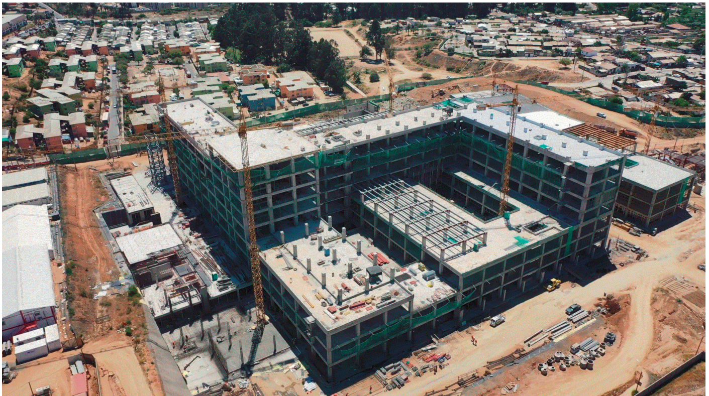
El hospital presenta un 30% de avance de obras. Se espera su culminación en 2024.

PROYECTO: Hospital Provincial Marga Marga. UBICACIÓN: Villa Alemana, Región de Valparaíso. MANDANTE: Servicio de Salud Viña del Mar Quillota, Minsal. INVERSIÓN: MM$139.548. SUPERFICIE CONSTRUIDA: 55.437m 2 hospital/ 19.680m 2 obras complementarias. DISEÑO Y CONSTRUCCIÓN: Acciona. INSPECTOR TÉCNICO DE OBRAS: Alfredo Miranda. AVANCE FÍSICO DE OBRAS: 30%. PLAZO TÉRMINO DE LA CONSTRUCCIÓN: 12-05-2024.