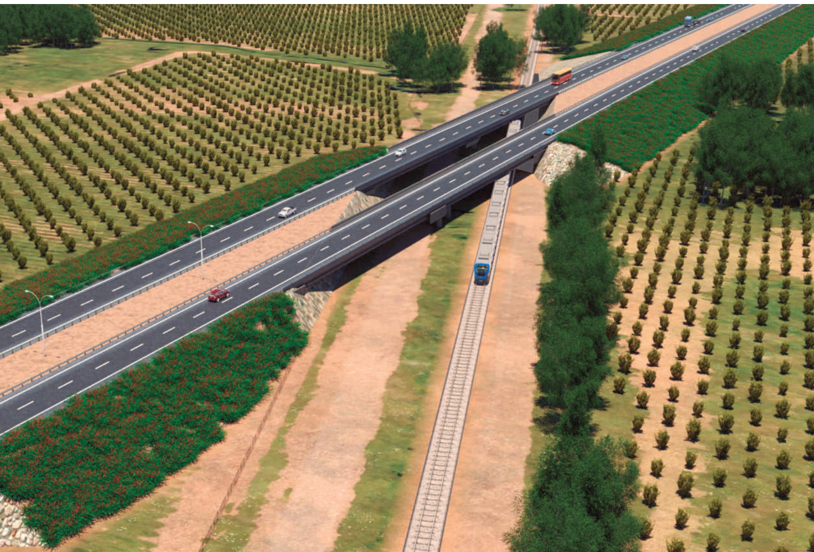
Cruces ferroviarios bajo nivel, un baipás en Talca y el mejoramiento integral de la autopista existente son parte de las obras del proyecto.

Segunda Concesión Ruta 5, tramo Talca-Chillán