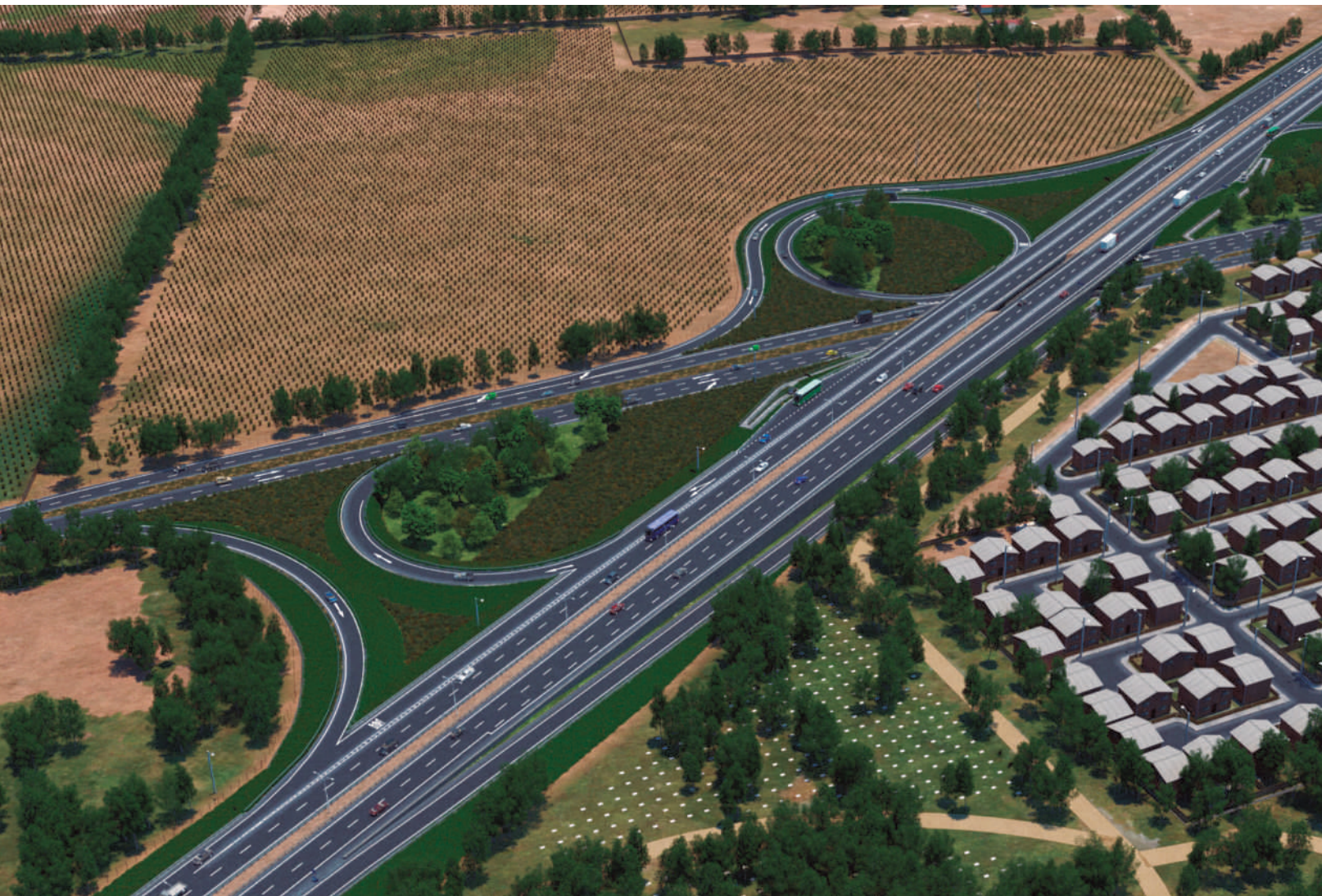
Nuevos enlaces en las principales ciudades y pueblos colindantes con la Ruta 5, entre Talca y Chillán, serán construidos a partir del año 2025.