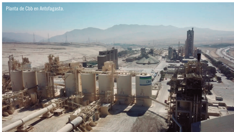
Planta de Cbb en Antofagasta.