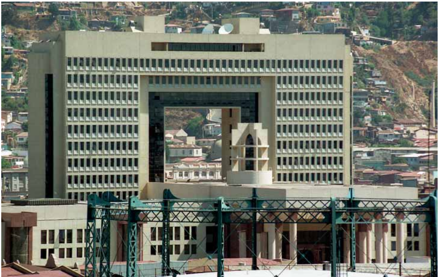
Congreso Nacional de Chile, 1999. Vista general del Congreso Nacional de Chile, ubicado en la Región de Valparaíso.