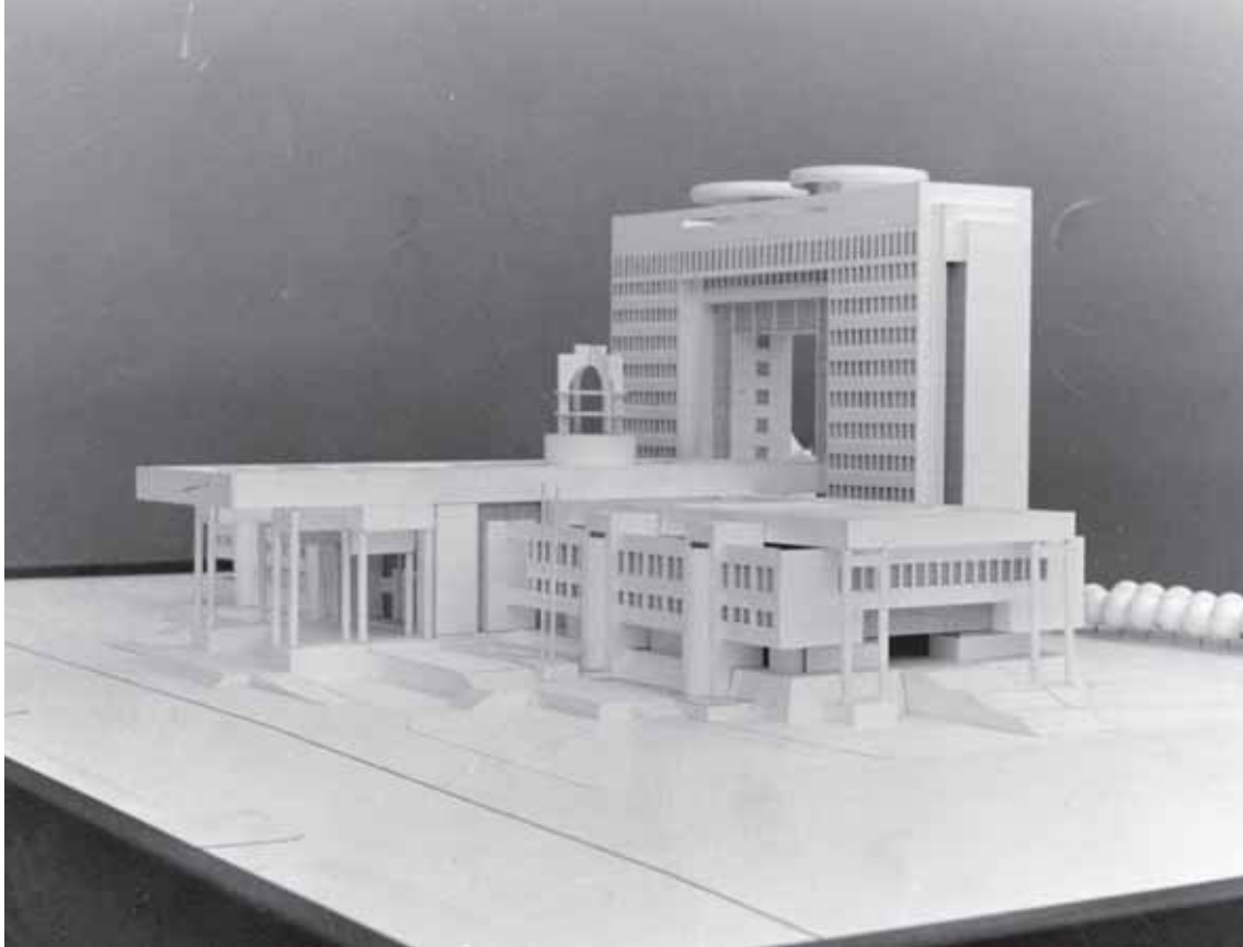
Maqueta del edificio del Congreso Nacional, 1988. Imagen general de la maqueta del edificio del Congreso Nacional de Valparaíso.