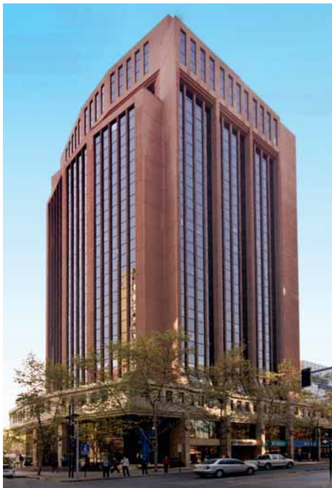
Edificio de la Construcción, 2008. Exterior del Edificio de la Construcción, ex sede de la CChC, ubicado en Marchant Pereira, comuna de Providencia.