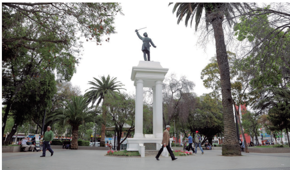
La estación terminal del proyecto ferroviario estará ubicada en Melipilla, cuyos habitantes por ahora solo disponen de buses para viajar a la capital.