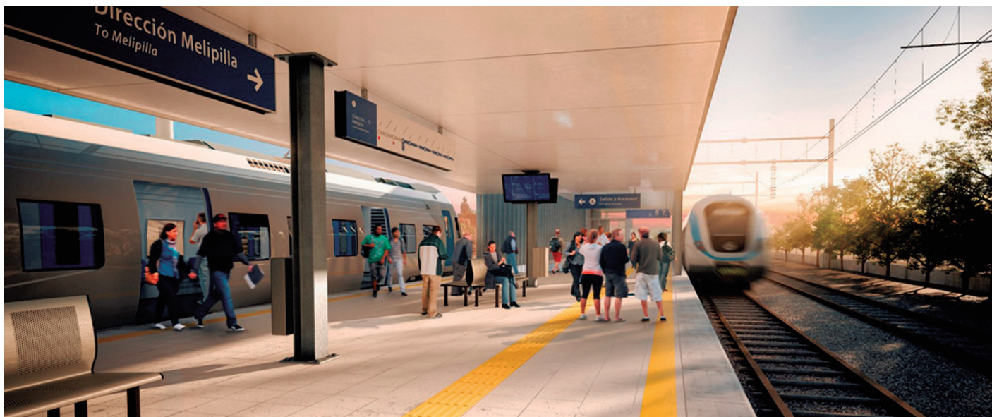
Un total de 11 estaciones tendrá el tren de cercanía Alameda-Melipilla, que será operado por EFE.