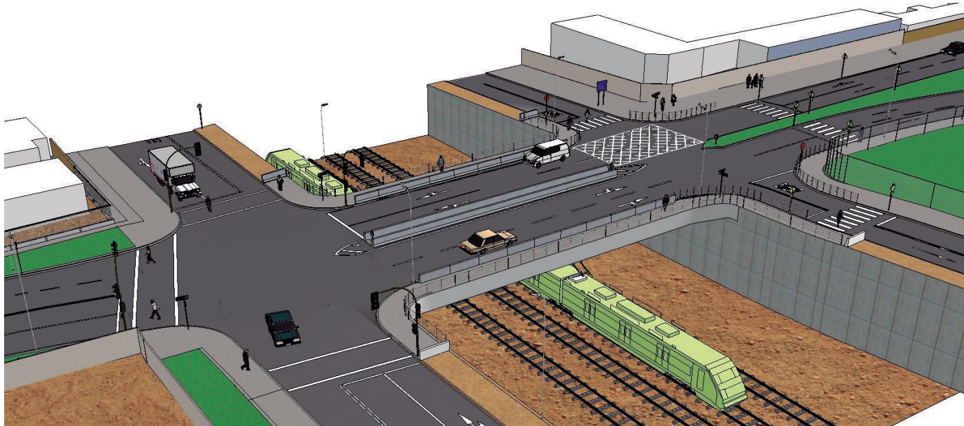
Una de las primeras licitaciones que se abrió fue para la obra del paso vehicular desnivelado Lo Errázuriz, en la comuna de Cerrillos, por donde el tren pasará bajo la avenida del mismo nombre.