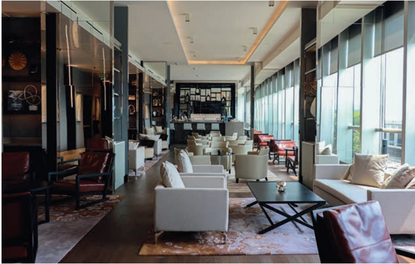
Un estilo sofisticado y espacios minimalistas destacan en el diseño del recinto.