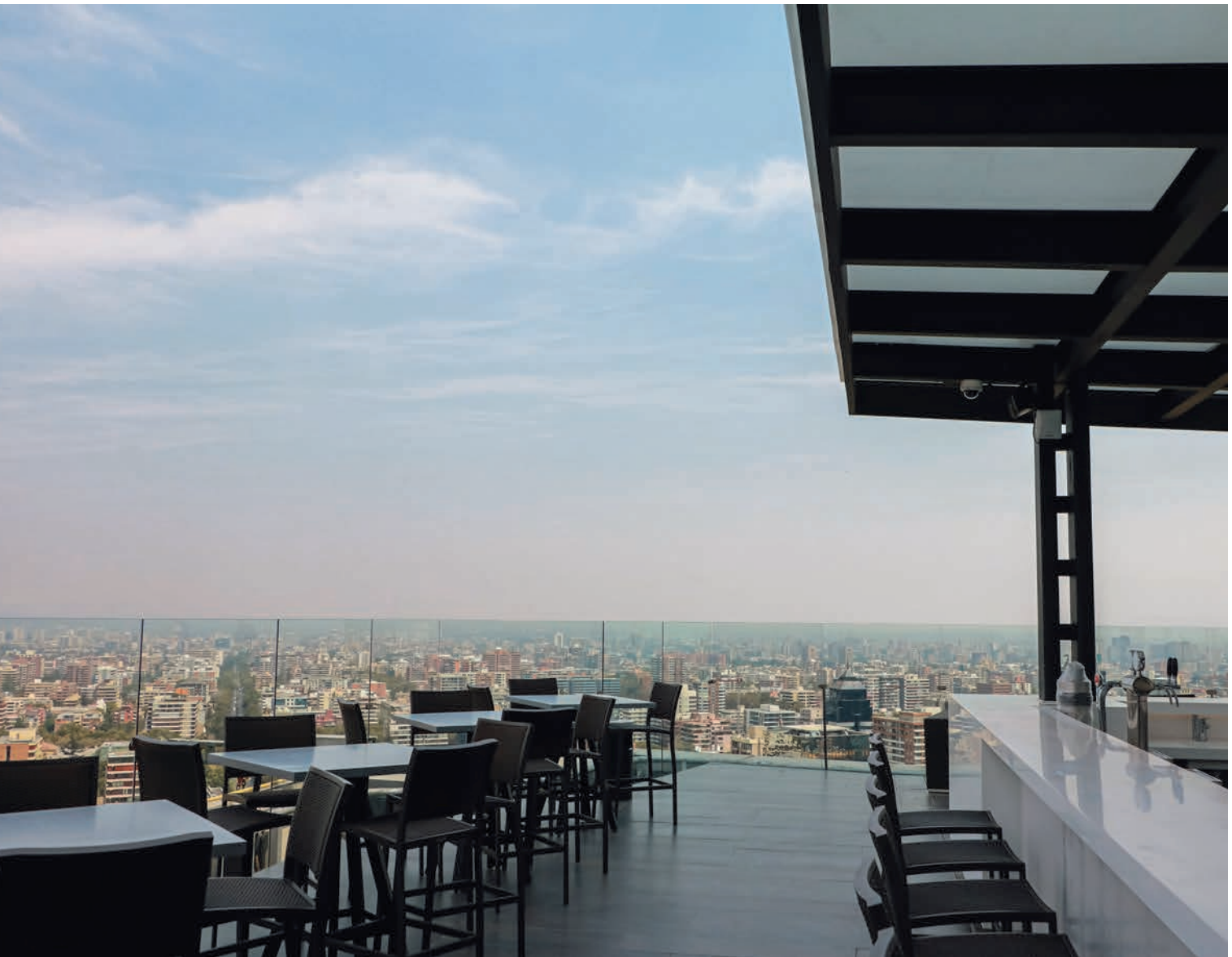
Desde la terraza del Luna Bar se aprecia una panorámica de Santiago.