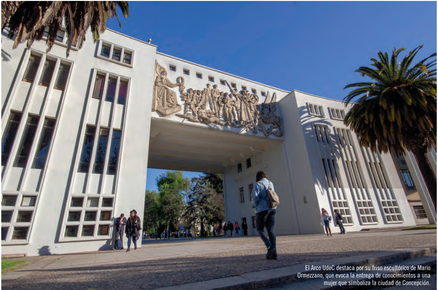
El Arco UdeC destaca por su friso escultórico de Mario Ormezzano, que evoca la entrega de conocimientos a una mujer que simboliza la ciudad de Concepción.

ACTUALMENTE, el plantel cuenta con 148 edificaciones de distintas datas y di- mensiones, con más de 168.000 m 2 construidos donde estudian cerca de 25.000 alumnos.