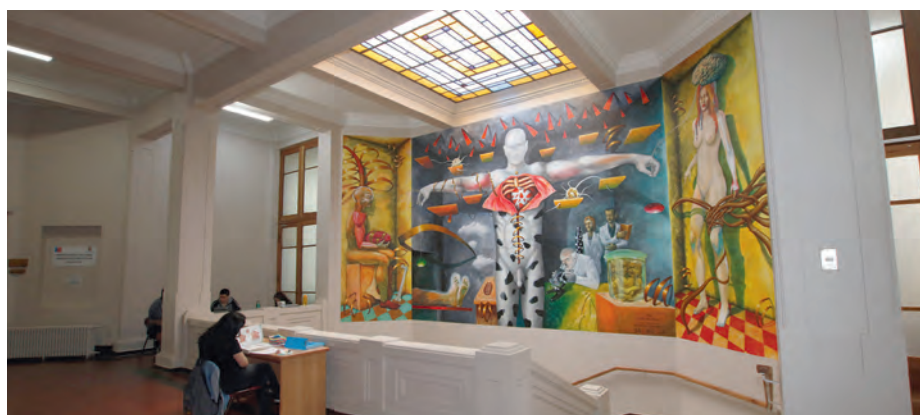
Las intervenciones artísticas están presentes en los distintos espacios interiores y exteriores de la ciudad universitaria.

diseñó el Foro Universitario, uno de los íconos del conjunto arquitectónico junto al Campanil y el Arco de Medicina.