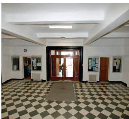
Edificio de la Facultad de Ciencias Naturales y Oceanográficas.