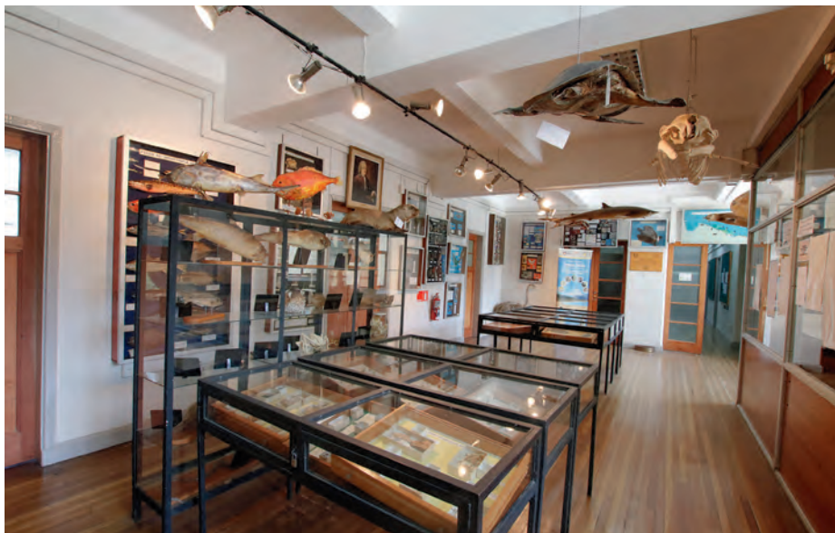
Edificio de la Facultad de Ciencias Naturales y Oceanográficas, también conocido como "La Ballena".