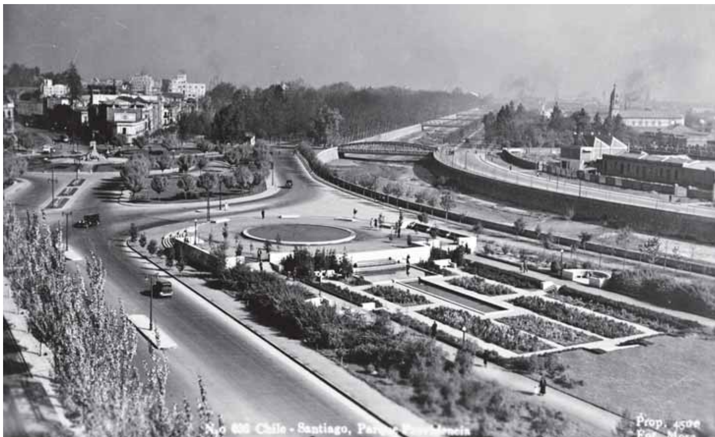
Nº 600 Chile - Santiago, Parque Providencia