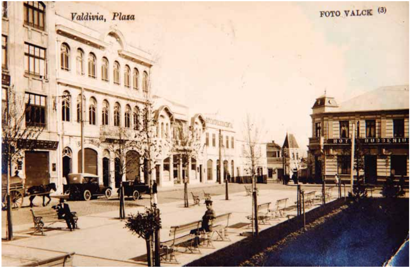
Plaza Valdivia, sin fecha.

Plaza de La República en Valdivia. Se ve la esquina de las calles Maipú con Camilo Henríquez. Imagen de la primera mitad del siglo XX.