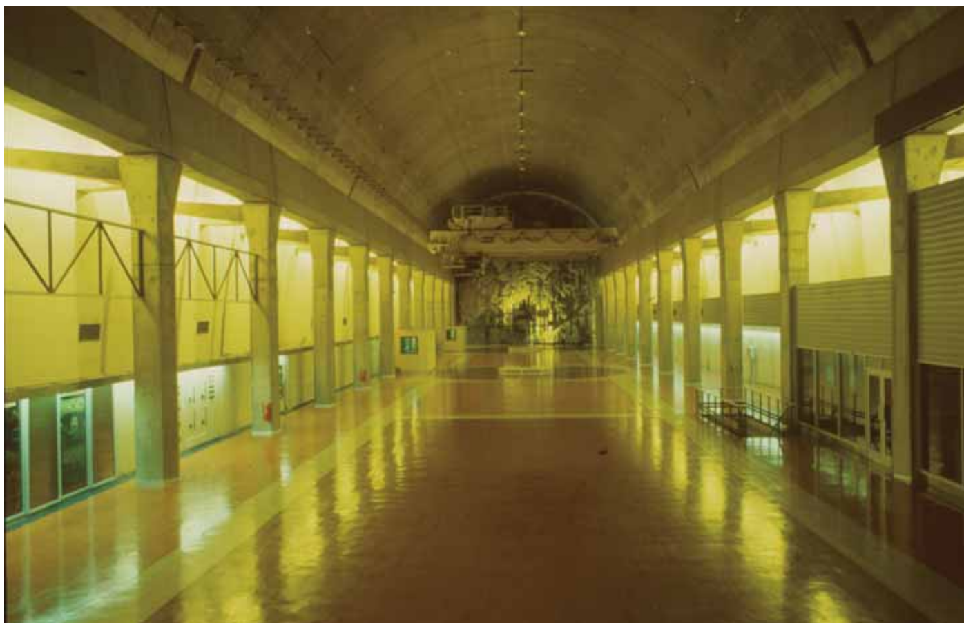
Interior de la central hidroeléctrica Colbún, sin fecha. Perspectiva del interior de la central hidroeléctrica Colbún, Región del Maule. Fotografía tomada a mediados de la década de 1990.