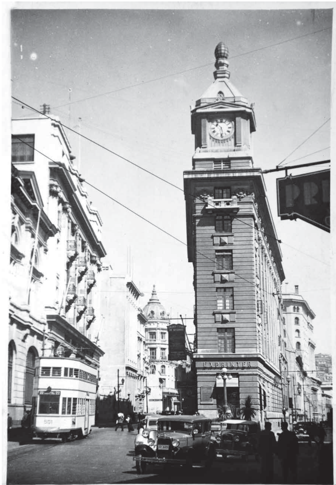
VALPARAISO. Calle Prat Casa Hans Frey

Valparaíso, calle Prat, sin fecha. Imagen del edificio Edwards de Valparaíso (conocido como reloj Turri) y la bifurcación de la calle Esmeralda a la altura de Cruz de Reyes, que pasa a llamarse Prat y Cochrane.