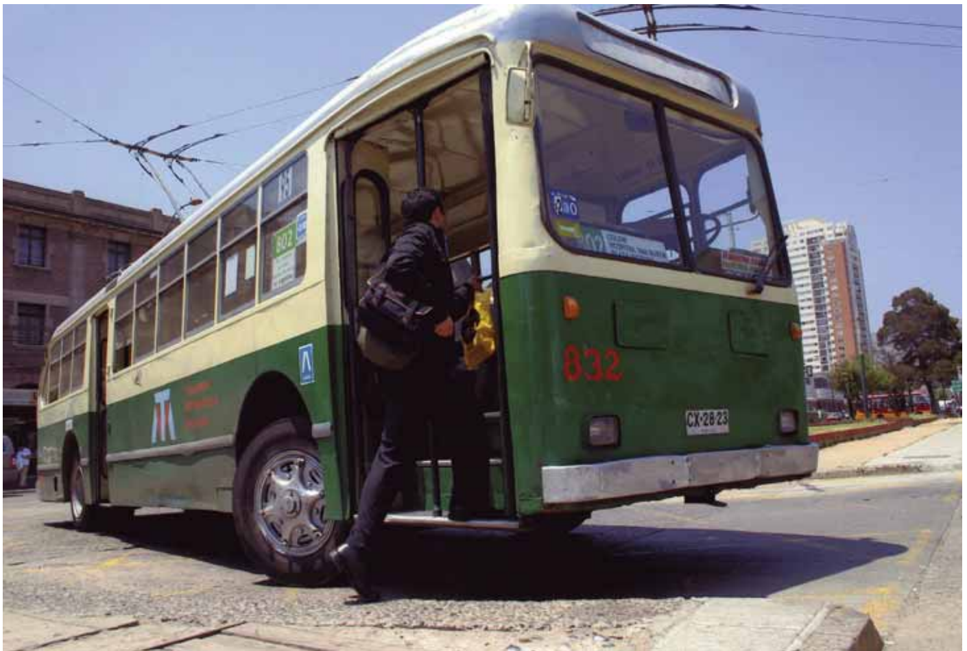
Pasajero subiéndose a un trolebús en Valparaíso, 2008. Imagen general de un trolebús visto desde fuera.