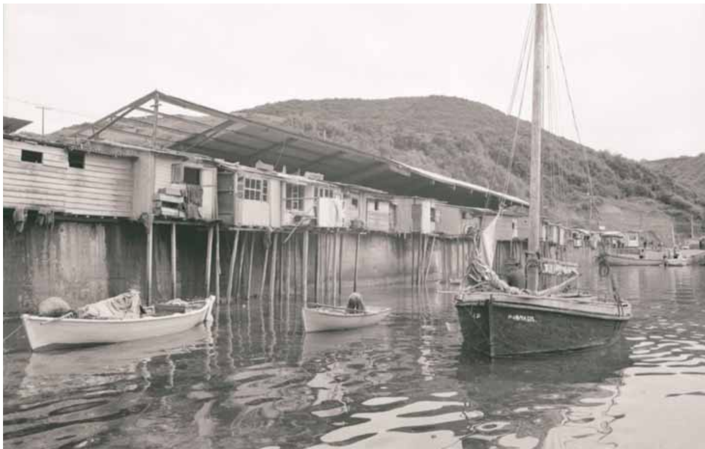
Lancha tradicional y palafitos en Chiloé, 1972.

Imagen de una lancha tradicional y un muelle con palafitos en una localidad del Archipiélago de Chiloé.