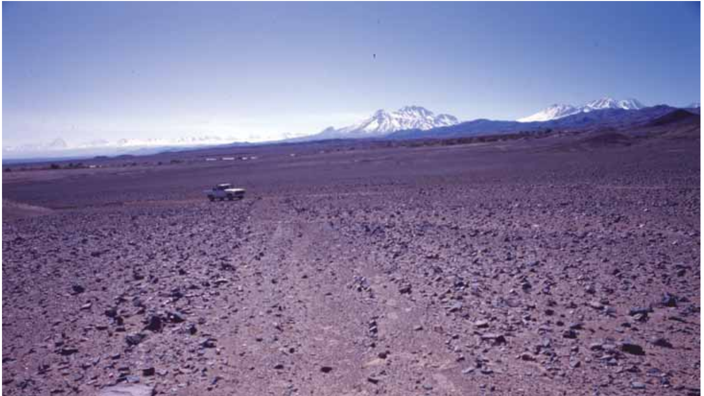
Camino del Inca en el Desierto de Atacama, sin fecha. Perspectiva de un tramo del Camino del Inca (sendero prehispánico) en el Desierto de Atacama, en las cercanías del poblado de Peine, Región de Antofagasta.