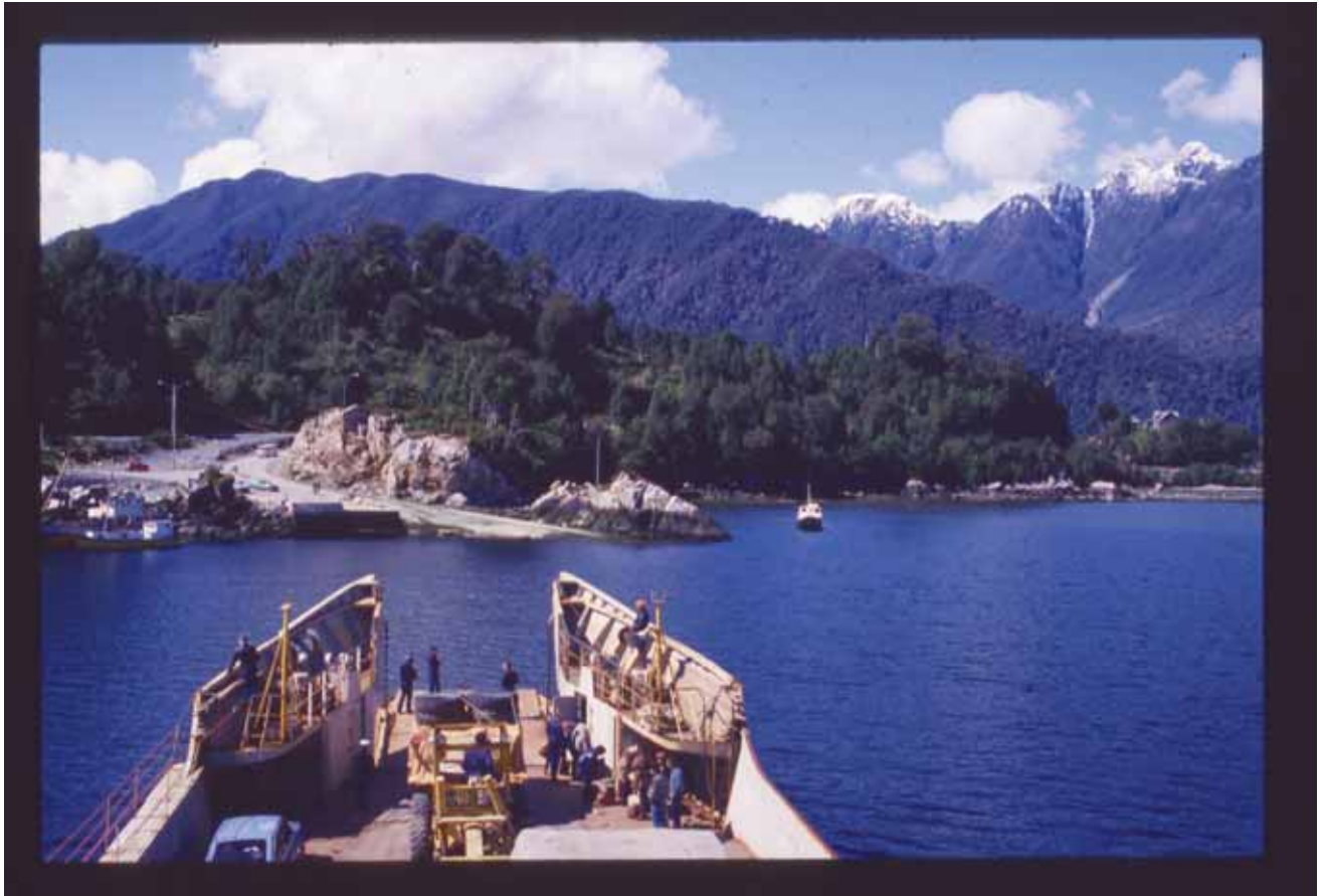
Embarcadero en Chaitén, sin fecha.

Imagen de la rampa del embarcadero de Chaitén, Región de Los Lagos, vista desde un transbordador.