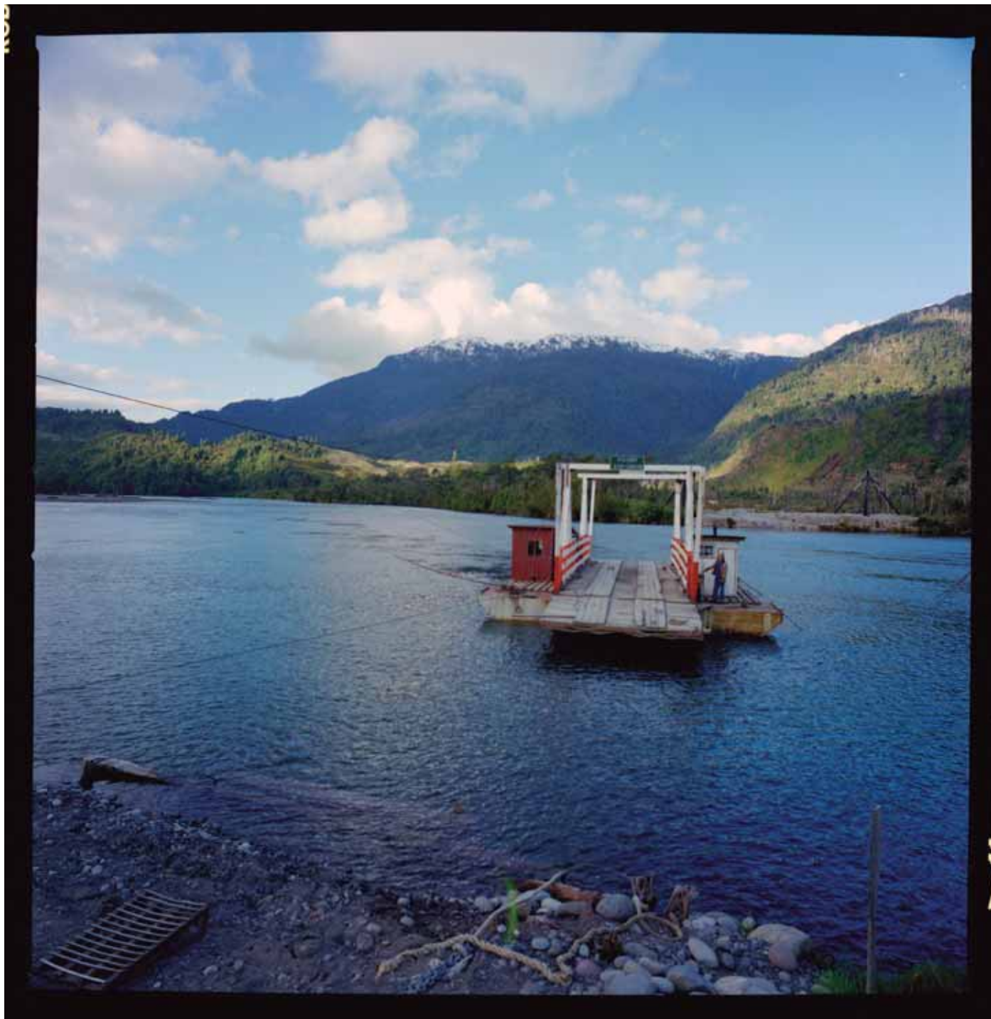
Cruce del río Yelcho, Carretera Austral, sin fecha. Imagen de la balsa para el cruce del río Yelcho en la Ruta 7 (Carretera Austral), Región de Los Lagos, en las cercanías de Puerto Cárdenas. Posteriormente se construiría un puente en el lugar.