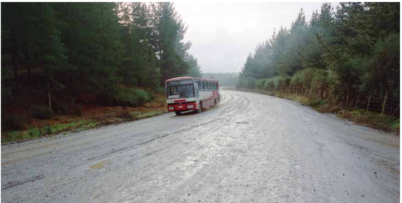
Camino rural, 1991. Imagen de un camino rural en las cercanías de Cañete, Región del Biobío.