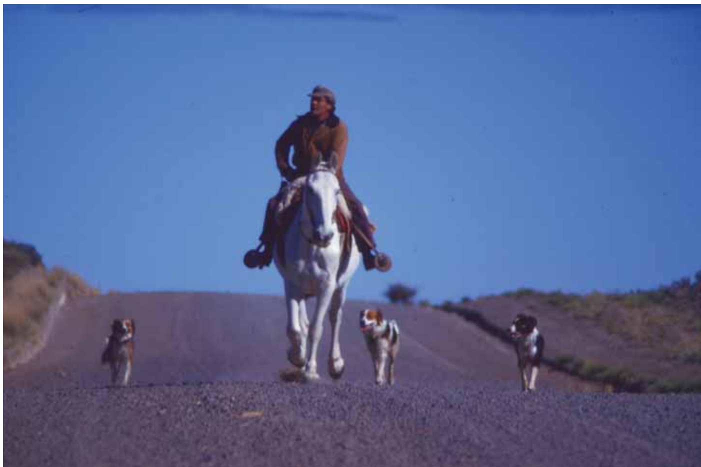
Camino en la Patagonia, sin fecha.

Imagen de una lancha tradicional y un muelle con palafitos en una localidad del Archipiélago de Chiloé.