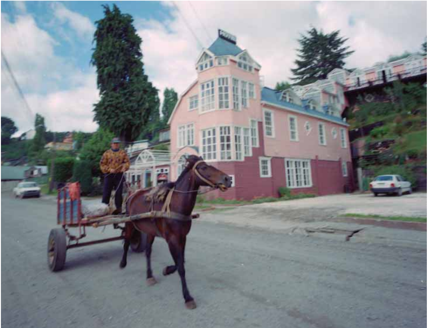
Hotel Unicornio Azul en Castro, Chiloé, sin fecha. Una carreta pasa delante del hotel Unicornio Azul en la ciudad de Castro, Chiloé.