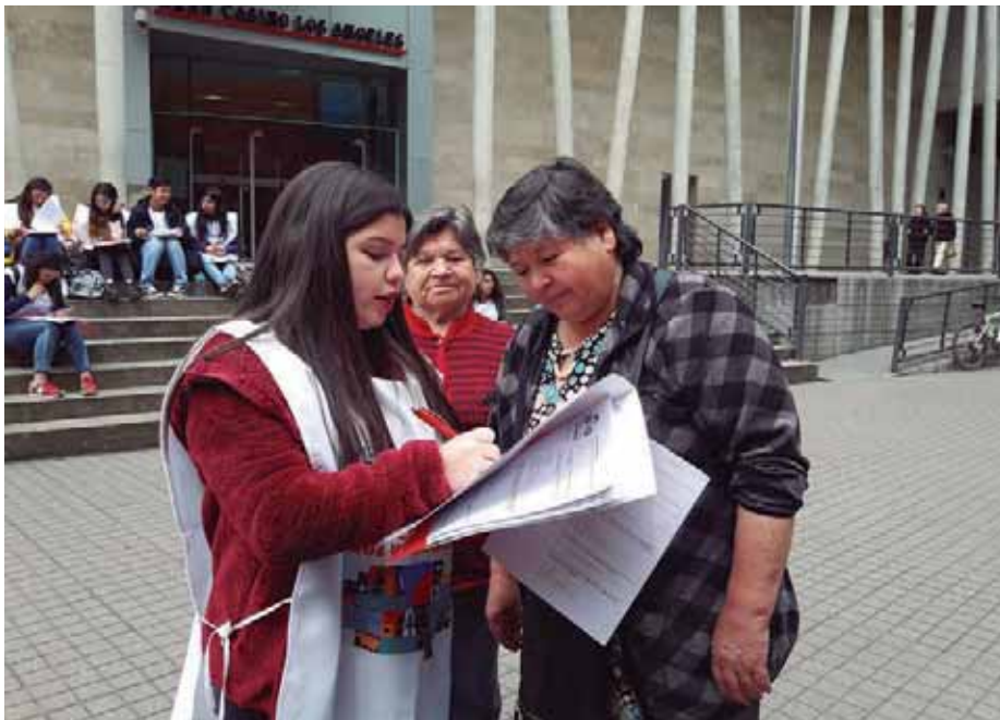
Visión Ciudad incluye un proceso de consulta abierta a los habitantes de las principales urbes de Chile, con el fin de construir una mirada consensuada sobre su desarrollo.

Actualmente, se encuentra en la fase de redacción el informe final y se está preparando un video del proyecto, los cuales se entregan en abril. “Valoramos mucho el alto interés y grado de participación de la ciudadanía, como también la buena convivencia y voluntad manifestada por los integrantes del Consejo Urbano. Estoy seguro de que