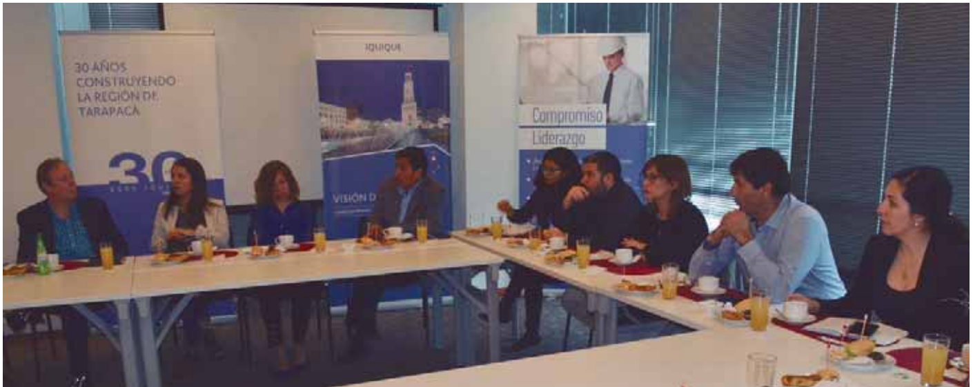
La conformación de un Consejo Urbano en Iquique es uno de los hitos que se valoran como parte de Visión Ciudad.

Más ciclovías, espacios inclusivos para la tercera edad, desarrollo de áreas verdes y recreativas, y una ciudad que crezca de manera ordenada. La lista de expectativas de las personas respecto de su entorno urbano es extensa. Este gran caudal de sueños y anhelos está siendo consultado y recopilado en Visión Ciudad.