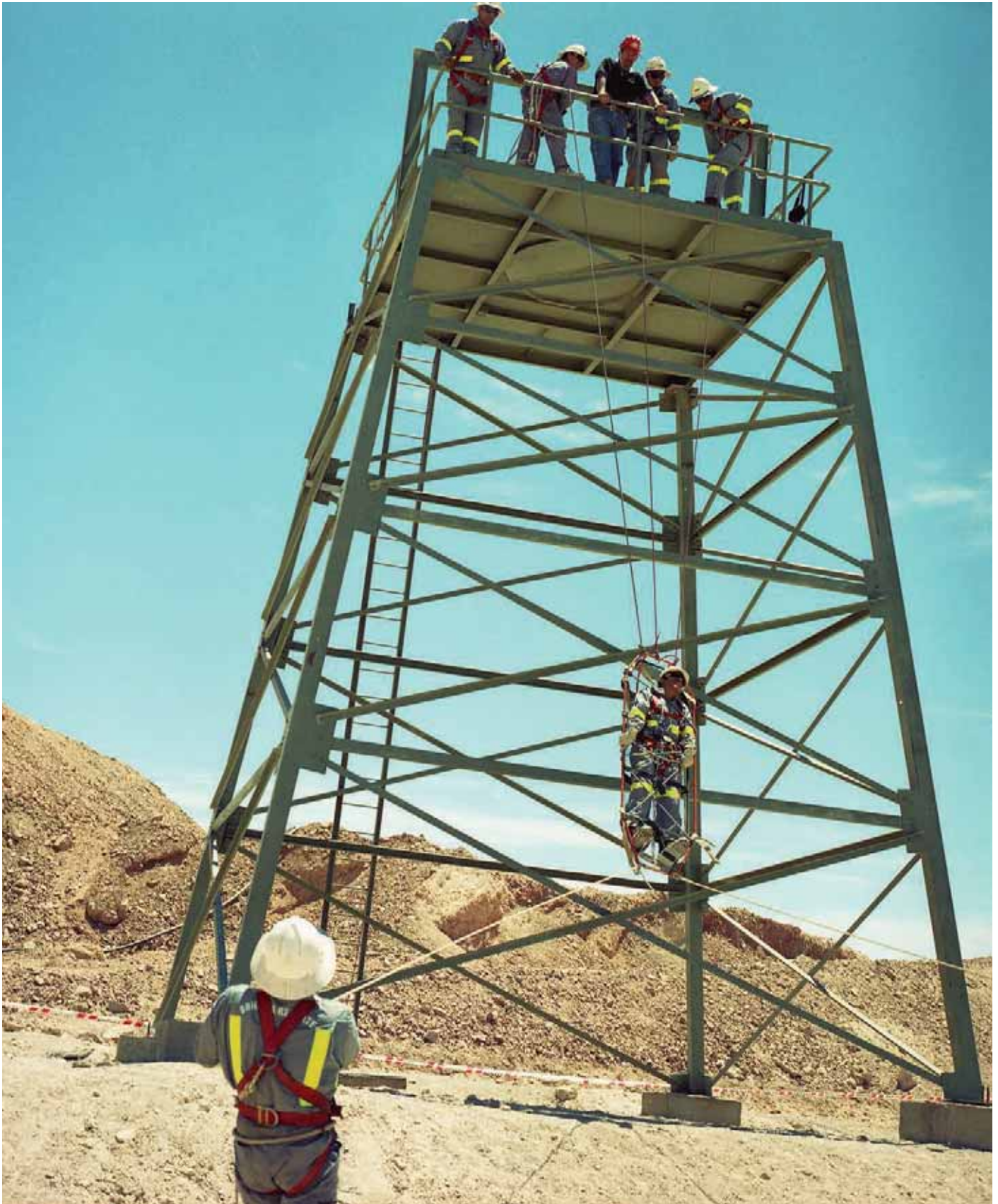
Ensayo de seguridad y salvataje en montajes industriales, 1968.

Vista general de trabajadores en un ensayo de seguridad y salvataje en los montajes industriales de la mina El Peñón.