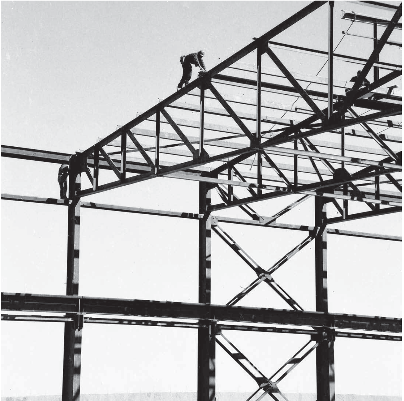
Construcción de estructura metálica, 1968. Imagen de obreros trabajando en una estructura metálica, sin medidas de seguridad.