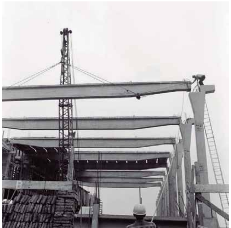
Imagen de la construcción de una estructura industrial. Un obrero de pie sobre un pilar y sin medidas de seguridad, controla la instalación de una viga en altura.