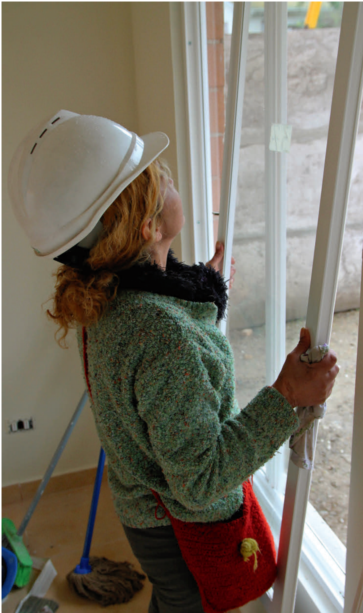
Trabajadora en obra, 2015. Imagen de una trabajadora instalando ventanas.