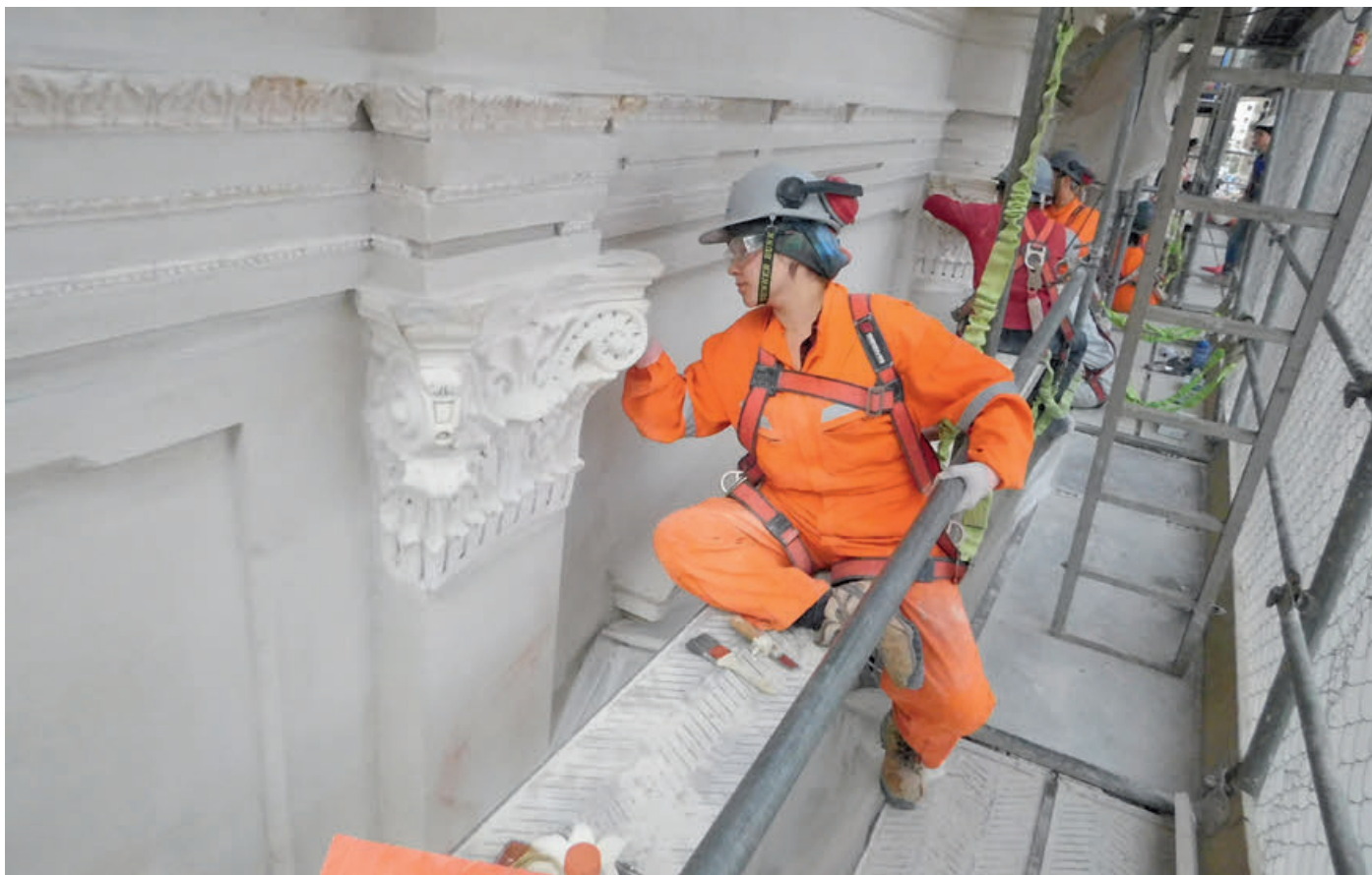
Trabajos en el Palacio Pereira, Santiago, 2017.

Una trabajadora en faenas de restauración de molduras del Palacio Pereira, Santiago. Proyecto a cargo del consorcio Cosal - Kalam.