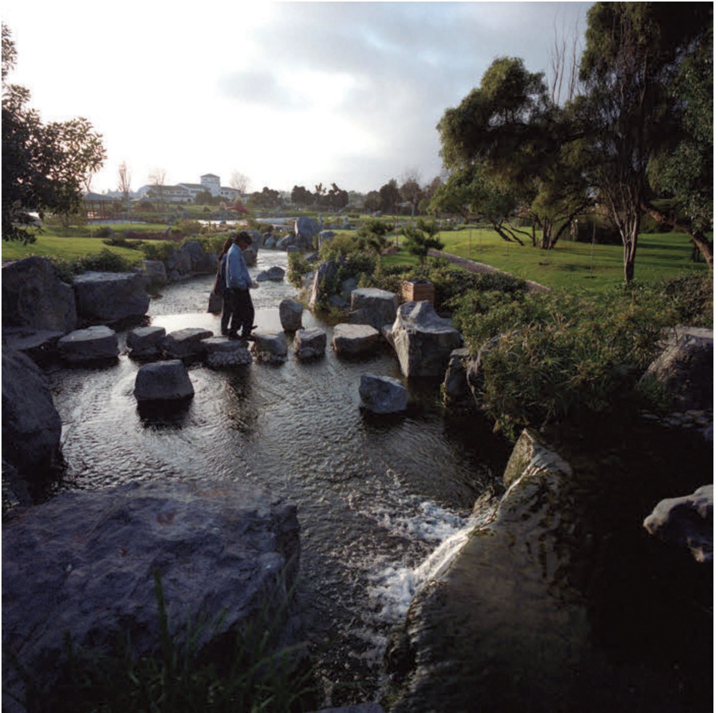
Parque Japonés de La Serena, 1994. Imagen de un sector del Parque Japonés de La Serena.