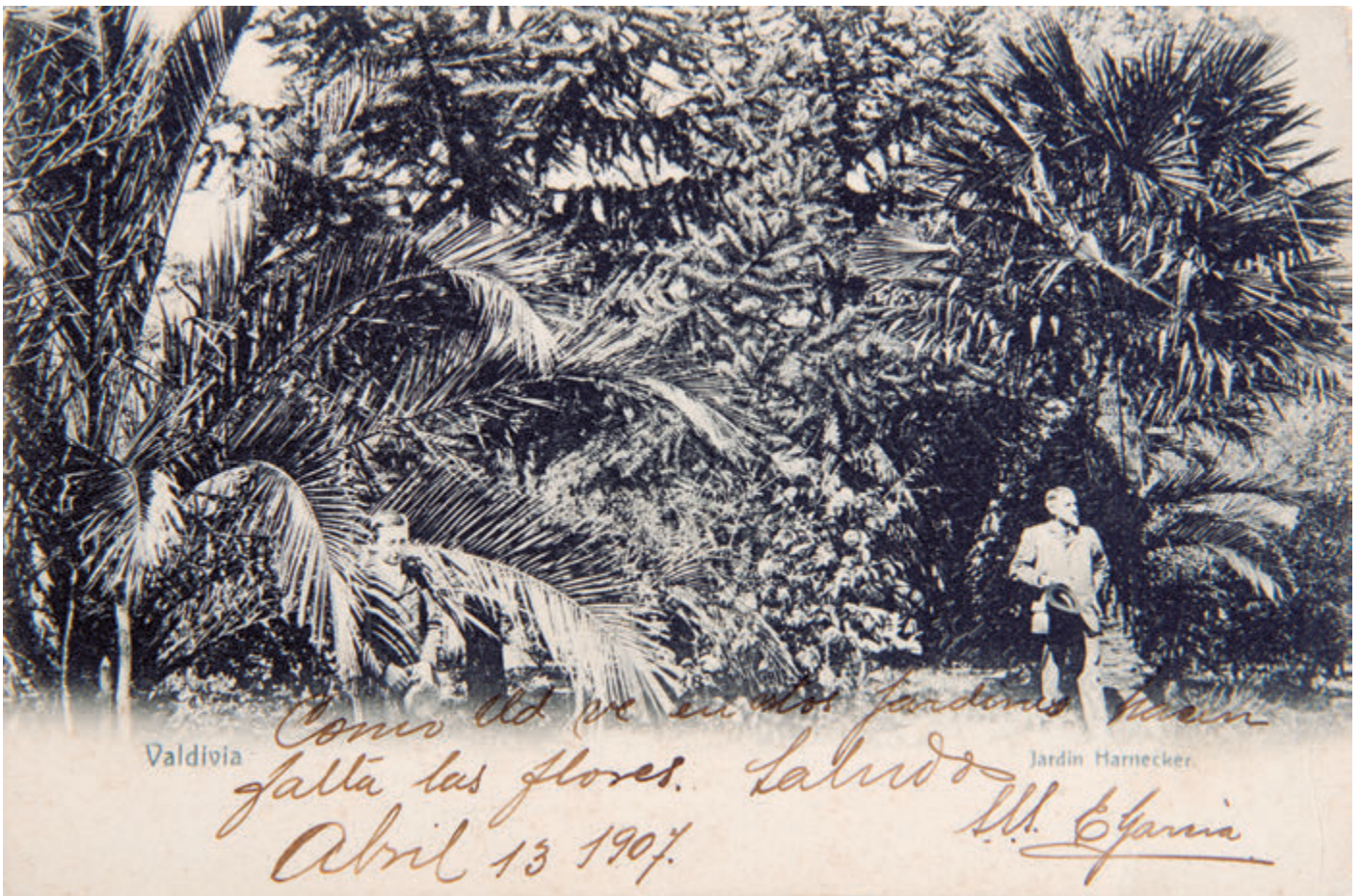
Valdivia: Jardín Harnecker, 1907.

Imagen del Parque Inglés, que se ubicaba en el centro de la avenida Bernardo O'Higgins, entre las calles Santa Rosa y San Francisco. La iglesia homónima es visible en segundo término. Fotógrafo desconocido.