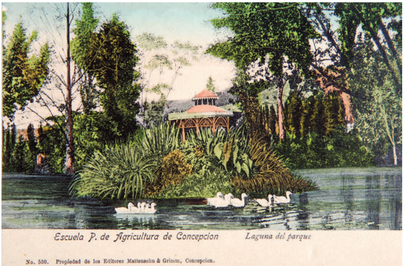
Escuela de Agricultura de Concepción: Laguna del parque, 1905.

Imagen de una laguna y una glorieta en la antigua Escuela de Agricultura, que se ubicaba en la actual avenida Collao, en el sector de Puchacay, Concepción.