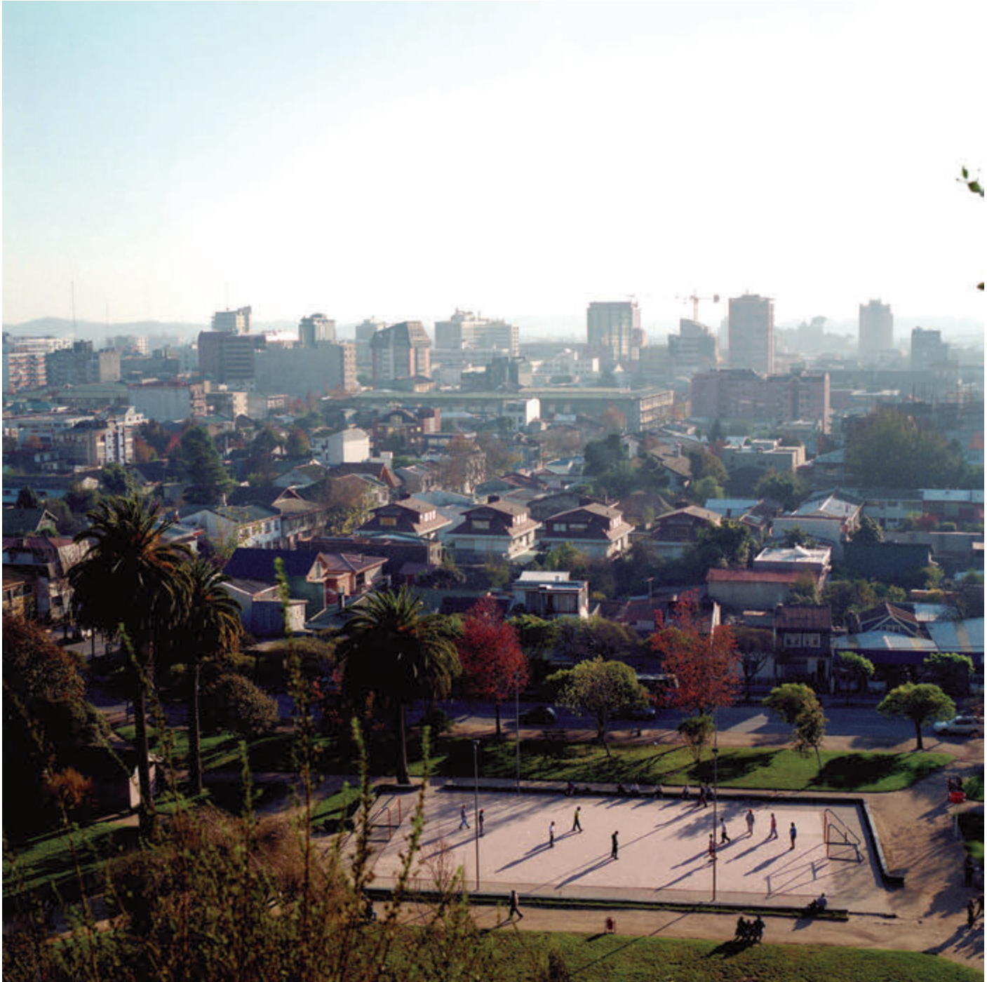
Parque Ecuador de Concepción, 1999.

Imagen del Parque Ecuador visto desde el Cerro Caracol, Concepción. Se aprecia el sector de la intersección de las calles Víctor Lamas con Lincoyán.