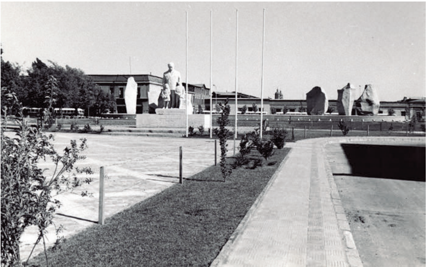
Monumento a Pedro Aguirre Cerda en el Parque Almagro de Santiago, 1976.

Vista general de Pichilemu. En la imagen se puede ver parte del Casino Ross y del Parque Agustín Ross, ubicado en avenida La Marina.