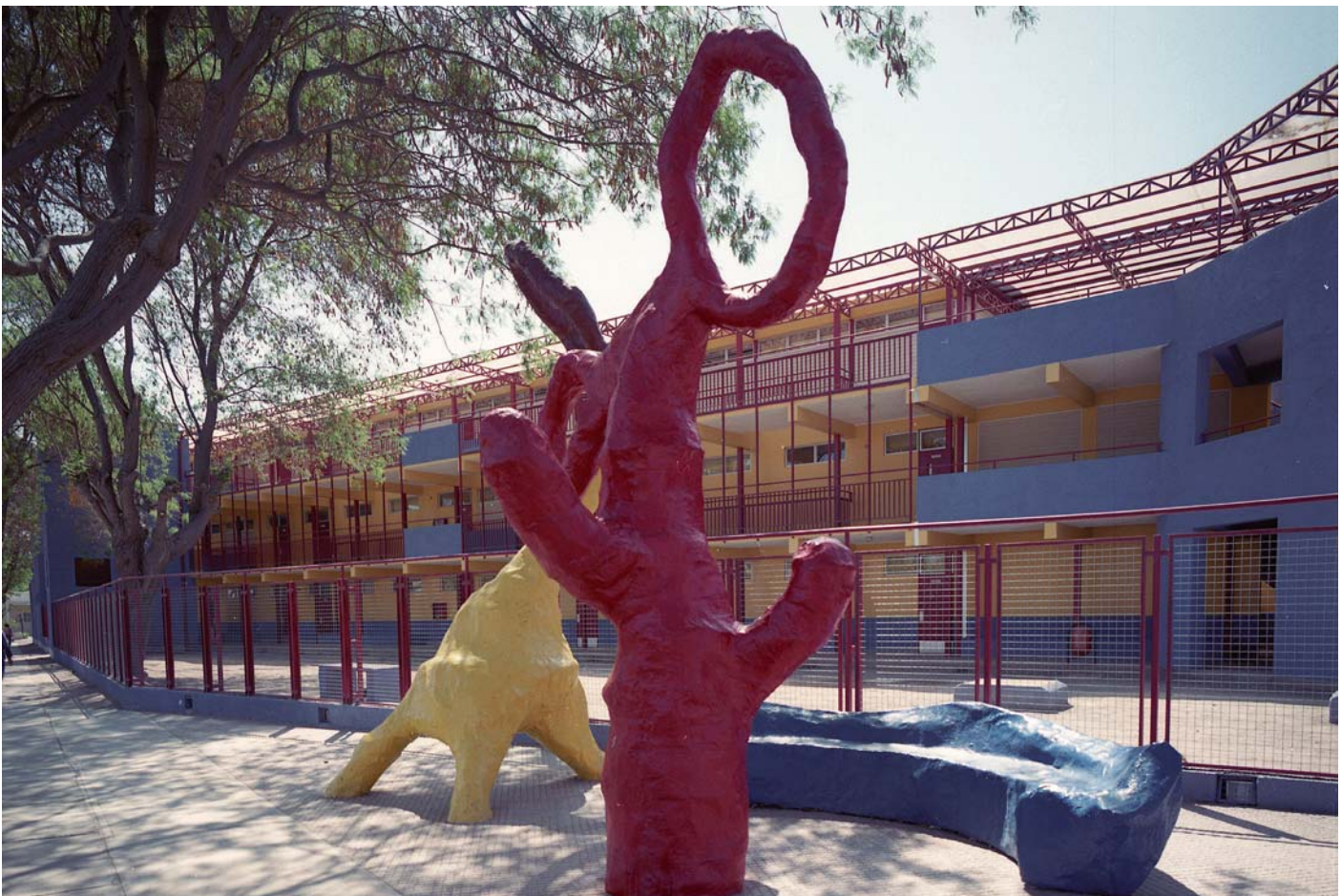
Colegio Buen Pastor de Copiapó, 1998. Imagen general de la fachada y esculturas que adornan la entrada al colegio municipal Buen Pastor en Copiapó.