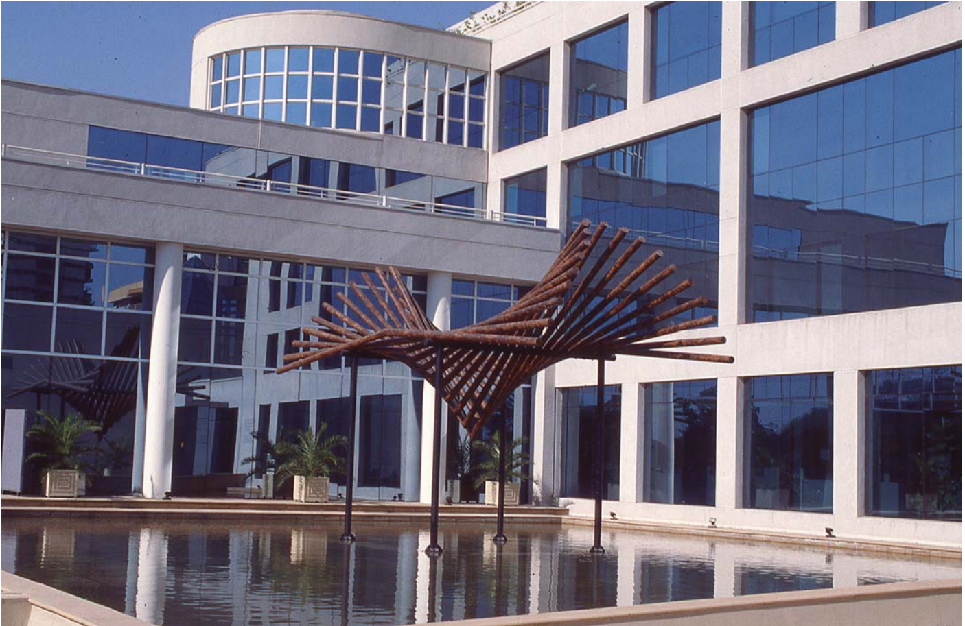
Escultura en el edificio FAO-PNUD en Chile, 1998. Imagen de parte del edificio FAO-PNUD en Chile. Se aprecia la escultura "Germen" de Verónica Astaburuaga.