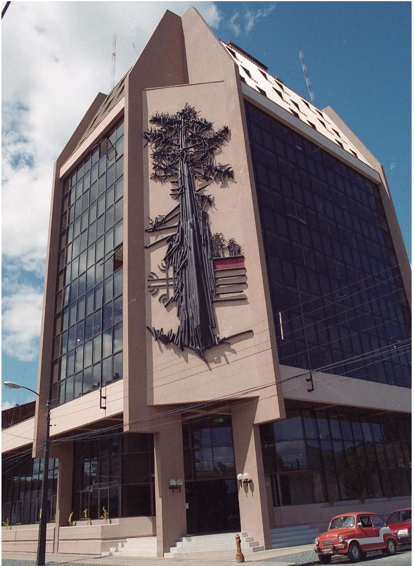
Edificio del Ministerio de Obras Públicas de Temuco, 1992.

Imagen general del edificio del Ministerio de Obras Públicas de Temuco. Se aprecia la escultura de Félix Maruenda que adorna su fachada.