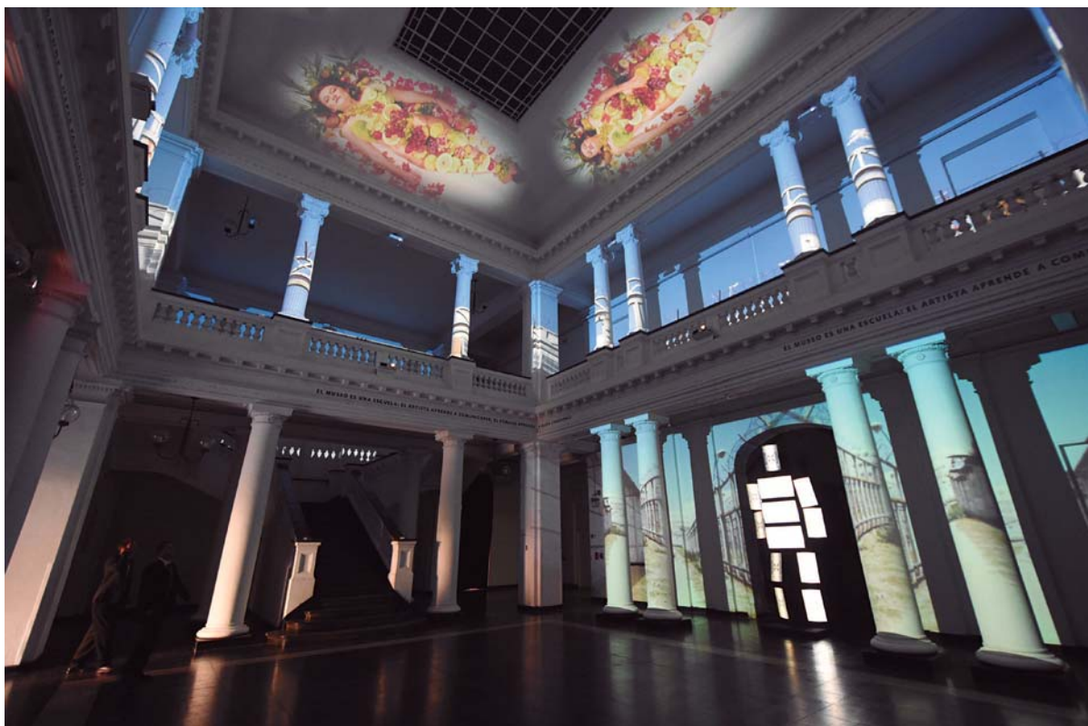
Interior del Museo de Arte Contemporáneo durante la exposición "Los Muros de Chile", 2018.

Imagen de un cuadro con técnica mixta ubicado en la CChC Chillán.