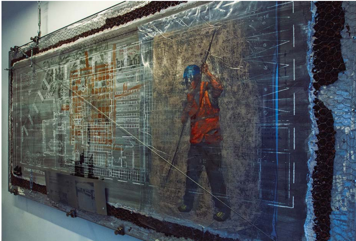
Cuadro en CChC Chillán, 2015.

Imagen de un cuadro con técnica mixta ubicado en la CChC Chillán.