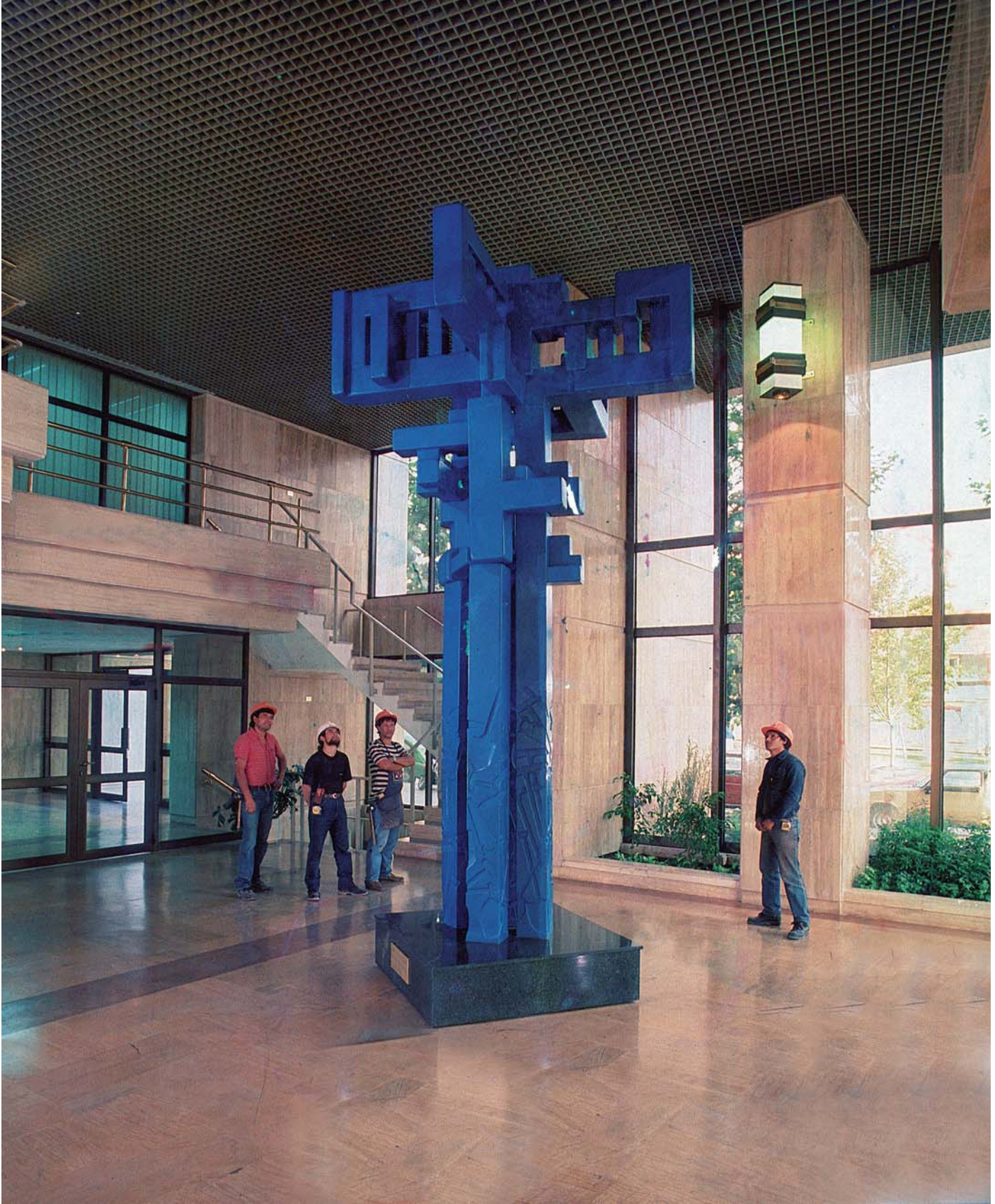
Edificio de la Construcción, 1989.

Imagen general de la escultura "Himno al Trabajo" de Marta Colvin, instalada en el acceso al Edificio de la Construcción.