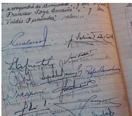
Acta de la Primera Sesión de la CChC.