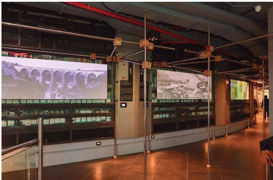
Los estantes de la biblioteca se ubican tras unas pantallas que proyectan siete temáticas asociadas a la construcción.