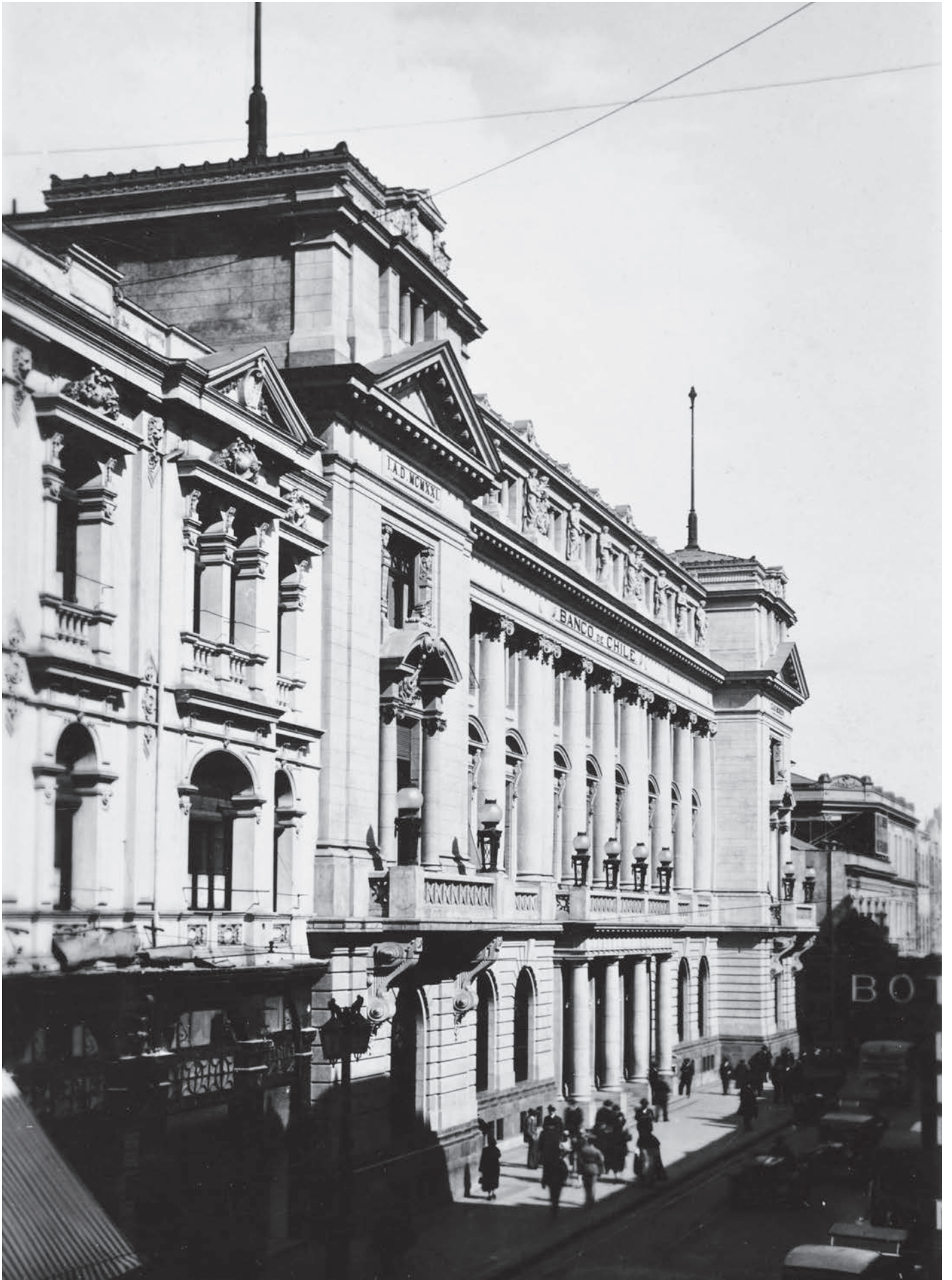
Edificio del Banco de Chile, Santiago. Imagen del edificio del Banco de Chile, ubicado en calle Huérfanos. Fue inaugurado en 1926.