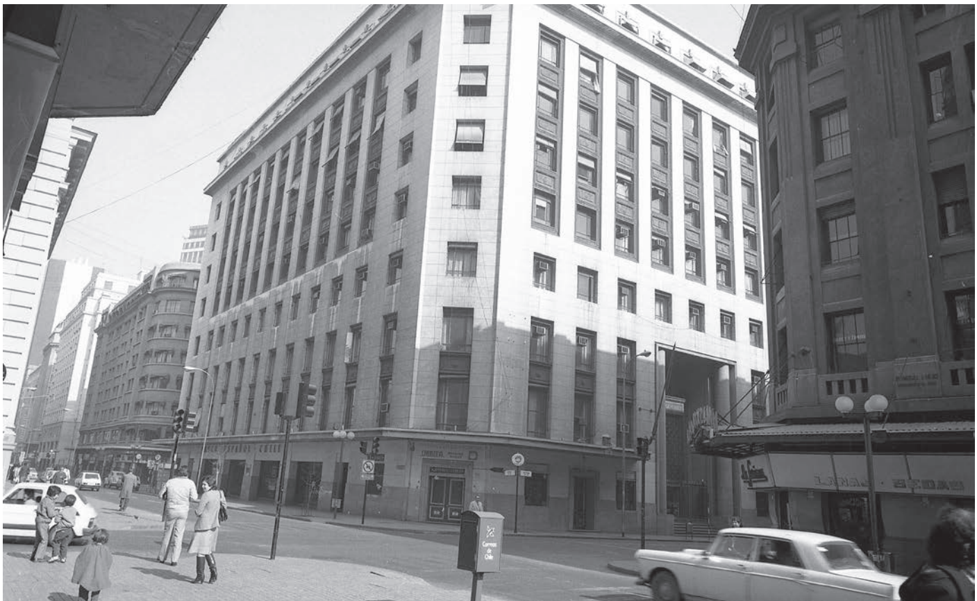
Banco Español de Chile, Santiago, 1977.

Vista general de la principal calle de Talcahuano y del edificio del Banco Español de Chile, que aparece en primer término en la fotografía.