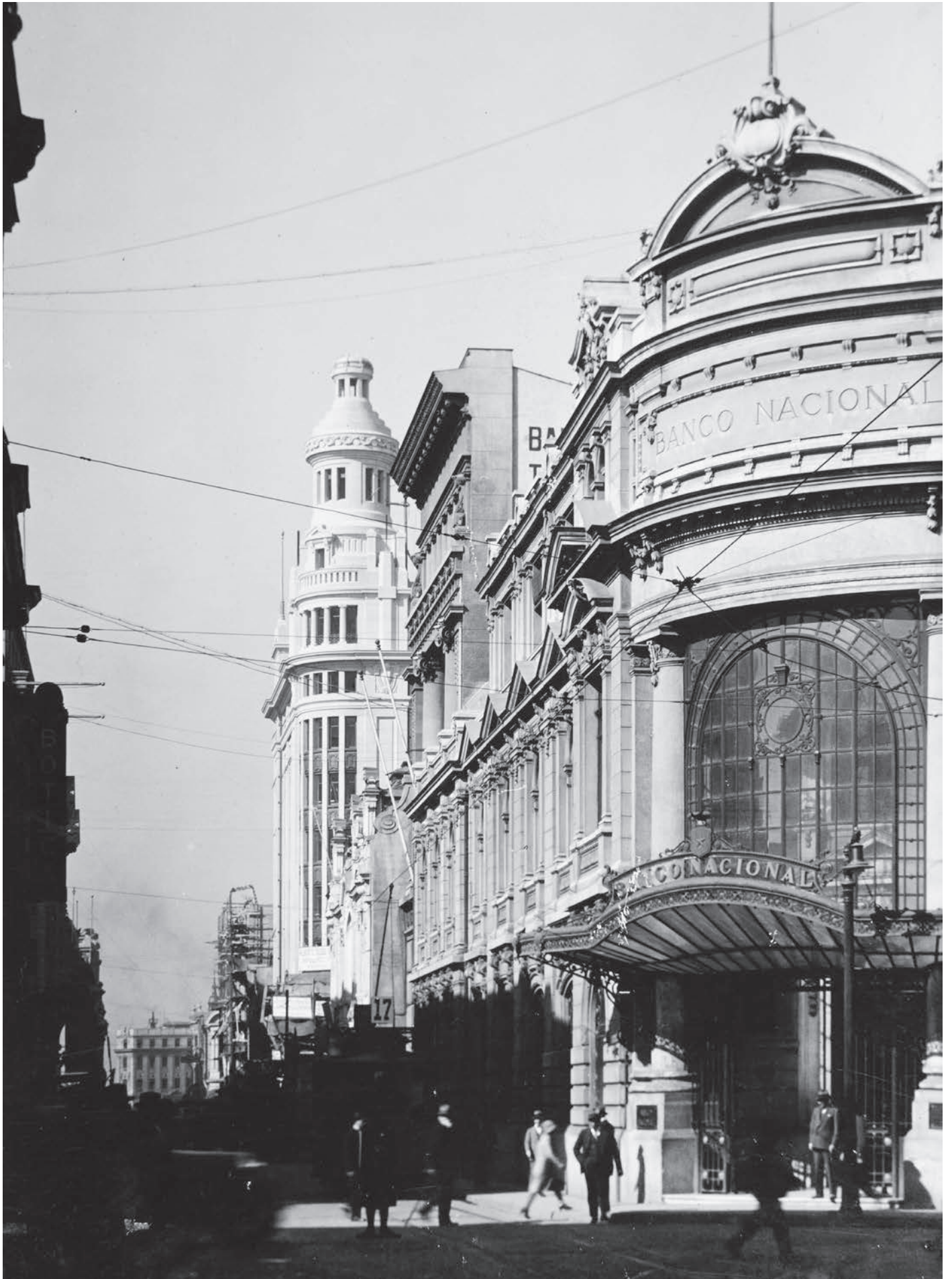
Bandera esquina Huérfanos, Santiago, 1929.

Perspectiva de la calle Bandera mirando hacia el sur, desde la esquina con Huérfanos en la ciudad de Santiago. En primer término destaca el edificio del Banco Nacional, posteriormente demolido. En segundo plano, esquina con calle Agustinas, se ve el edificio de la Compañía Sud América en la fase final de su construcción.