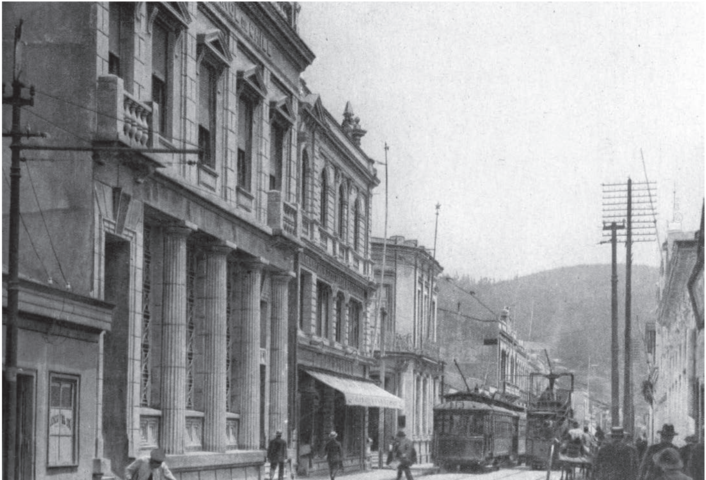
Banco Español de Chile, Talcahuano, 1925.

Vista general de la principal calle de Talcahuano y del edificio del Banco Español de Chile, que aparece en primer término en la fotografía.