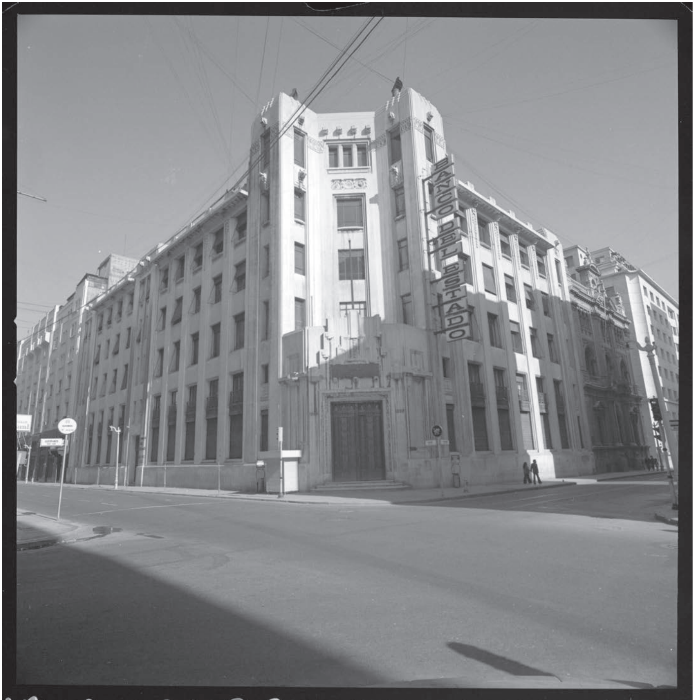
Sucursal Huérfanos del Banco del Estado, 1977.

Fachada de la sucursal Huérfanos del Banco del Estado, ubicada en la esquina de las calles Huérfanos con Morandé, Santiago.