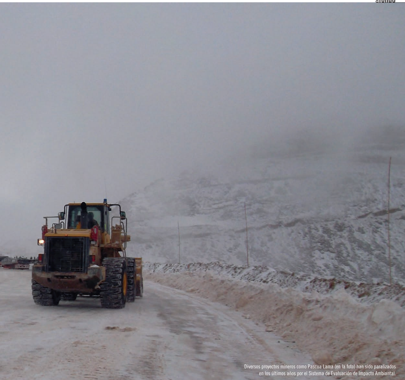
Diversos proyectos mineros como Pascua Lama (en la foto) han sido paralizados en los últimos años por el Sistema de Evaluación de Impacto Ambiental.

En los primeros días a cargo de la cartera de Medio Ambiente, la ministra Marcela Cubillos manifestó su intención de reformar el Sistema de Evaluación de Impacto Ambiental (SEIA). Para ello se basaría en las propuestas elaboradas en 2015 por la comisión asesora presidencial respectiva, convocada por la ex presidenta Michelle Bachelet y que generó 25 sugerencias de modificaciones al sistema.