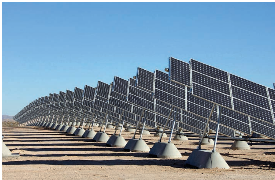
Proyectos de generación de ERNC como Trébol Solar Copiapó han sido rechazados por el SEIA.

Para Javier Irarrázaval, economista de la CPC, la certeza de los proyectos está en juego. "La incertidumbre es muchas veces lo que derrumba la inversión potencial", seña-