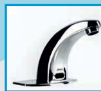
Llaves de agua EFFI