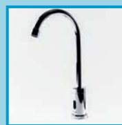
Llaves de agua GOOSE

La sustentabilidad es parte de nuestros valores