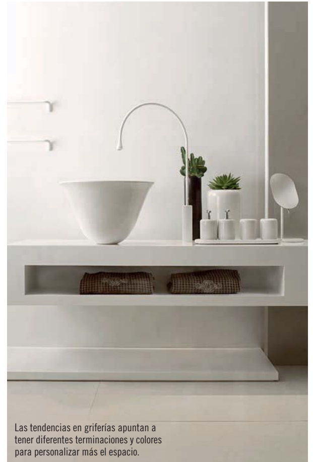
Las tendencias en griferías apuntan a tener diferentes terminaciones y colores para personalizar más el espacio.

Según la norma chilena NCH 3196/2-2010, el gasto de agua de un producto es eficiente cuando entrega un caudal de menos de nueve litros por minuto (medido a 3 bar de presión). Por esta razón, tanto MK como Stretto han buscado soluciones que, cumpliendo con este requerimiento, mantengan la comodidad de los usuarios. Es por ello que han incorporado una tecnología que mezcla el agua con burbujas de aire, lo que permite ahorrar sin perjudicar la experiencia de uso. De esta forma, ducharse, lavarse las manos o beber agua con estilo y en forma eficiente es posible. Las nuevas tendencias en griferías así lo permiten.