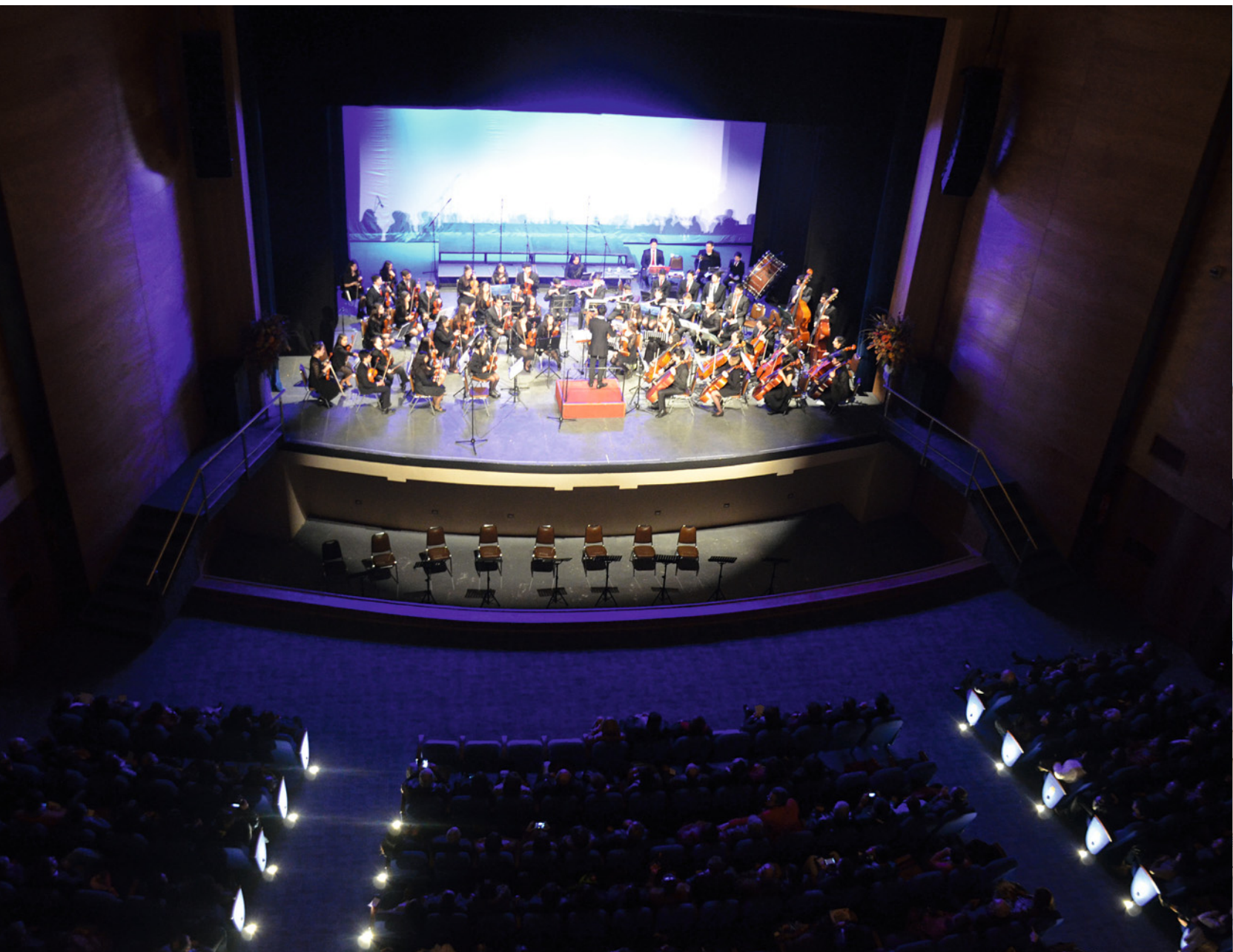
Bajo el escenario el Salón Principal dispone de un foso para orquesta con capacidad para 40 músicos.

vista a la Plaza de Armas, ubicado sobre la entrada, que había sido cerrado en 1998. Al mismo tiempo, la habilitación de los espacios -desarrollada por la empresa Ingetal Ingeniería y Construcción S.A.- contempló obras de renovación y cambios en el techo, muros, pisos, cielos y pasillos, además de la fachada, puertas y ventanas.