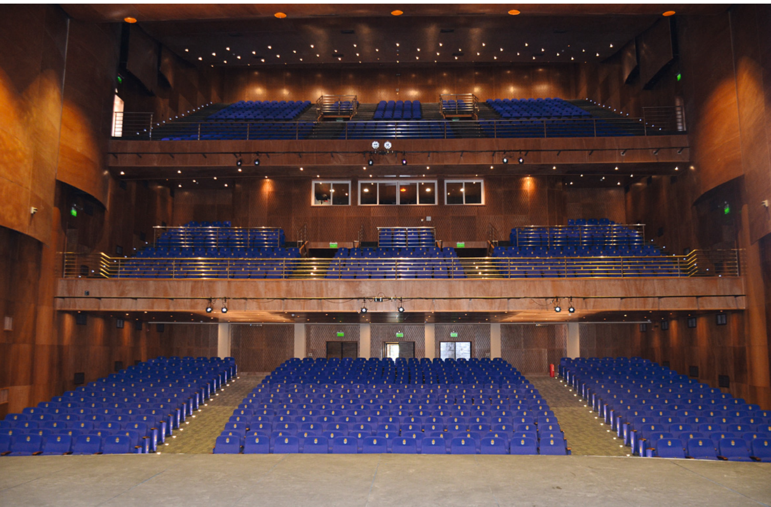
El recinto fue recubierto con materiales especiales para optimizar su acústica.

"UNO DE LOS MAYORES DESAFÍOS DE LA construcción fue intervenir una estructura 'sobredimensionada', con muros de hormigón armado de hasta 40 centímetros de espesor, los cuales respondían a un tipo de edificación post sismo en donde Chillán fue reconstruido para durar", explica el arquitecto Nicolás Sandoval.