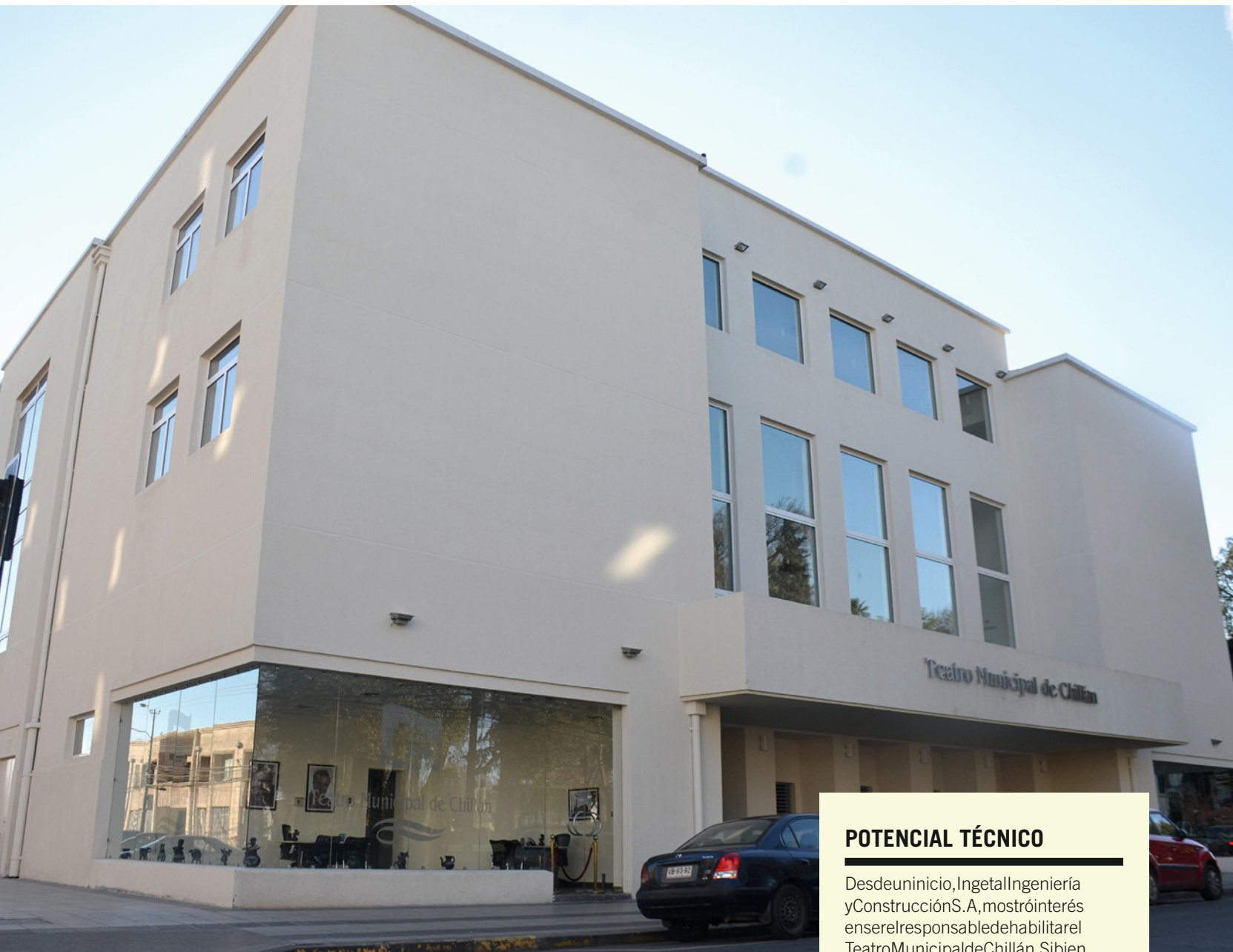
Parte de las obras consistió en la restauración del balcón y de la fachada.

idad para 200 personas y que actualmente está sin uso.