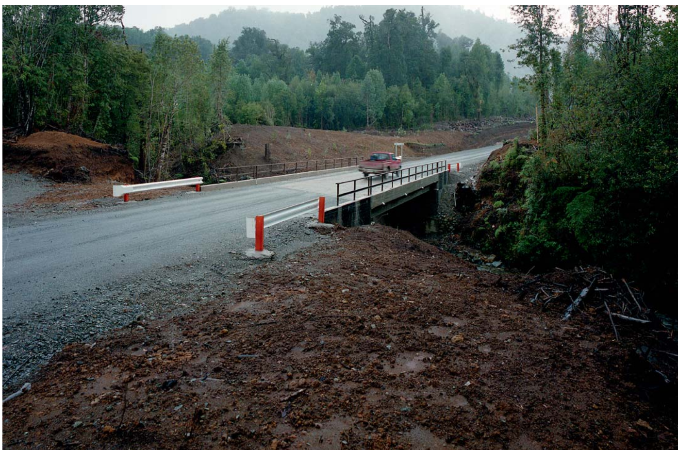
Puente en una carretera de la Región de Los Lagos, 1985.

Imagen de la ruta 5 norte en un sector costero de la Región de Antofagasta.