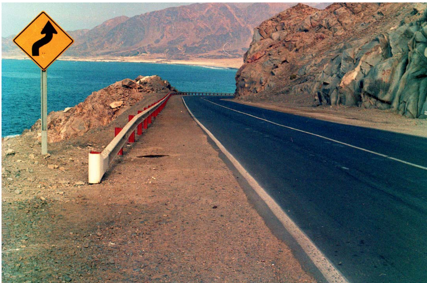
Ruta 5 norte, 1989.

Imagen de la ruta 5 norte en un sector costero de la Región de Antofagasta.