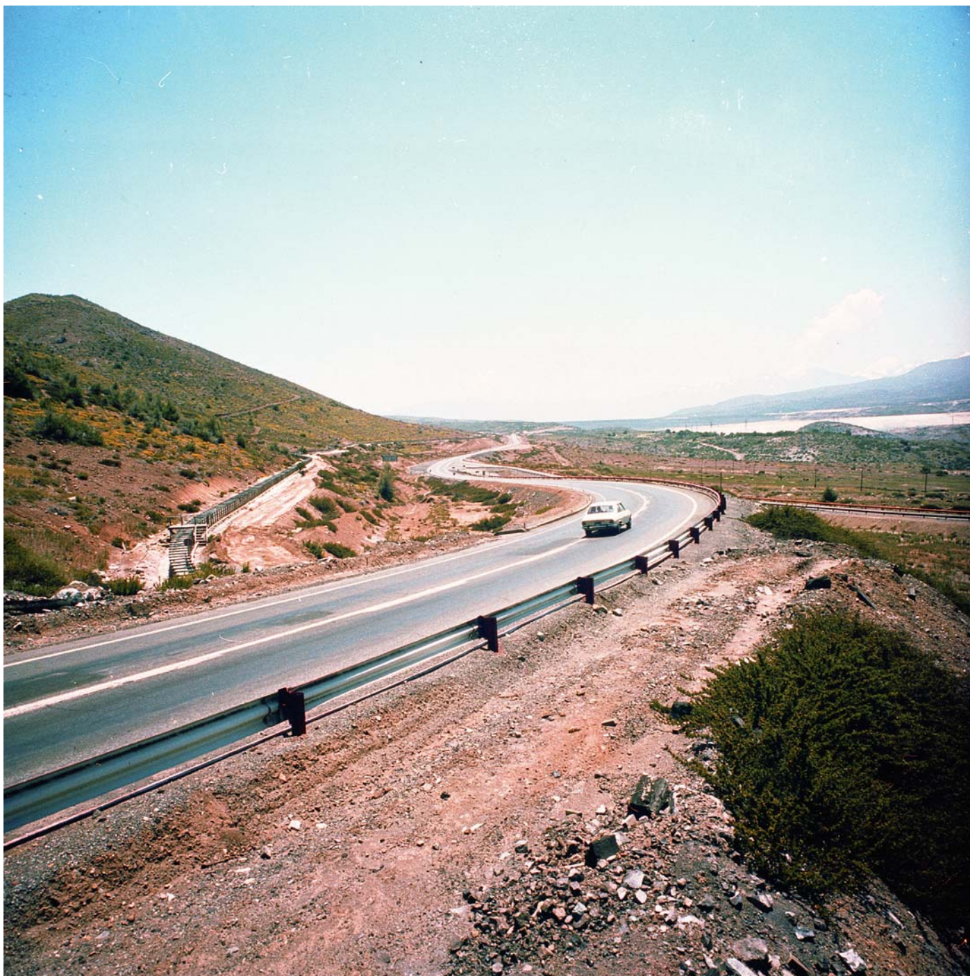
Ruta H-25 en las cercanías del tranque Barahona, 1980.

Imagen de la Ruta H-25, oficialmente llamada Carretera Presidente Eduardo Frei Montalva y conocida como Carretera del Cobre, en las cercanías del tranque Barahona.