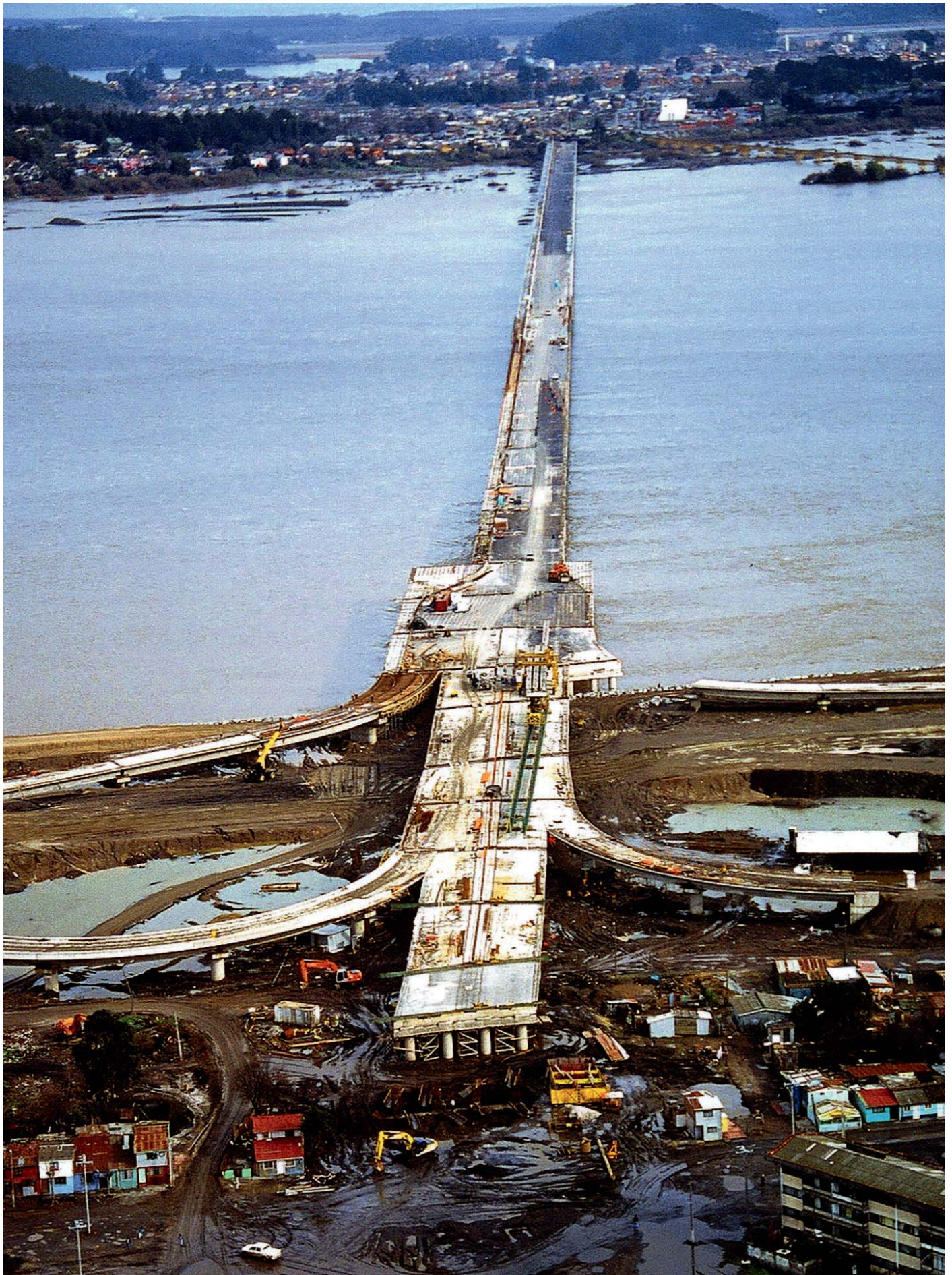
Imagen aérea del puente Llacolén en Concepción, 1999.

Imagen en perspectiva desde el aire del puente Llacolén (en la ciudad de Concepción, sobre el Bío Bío) en obras.