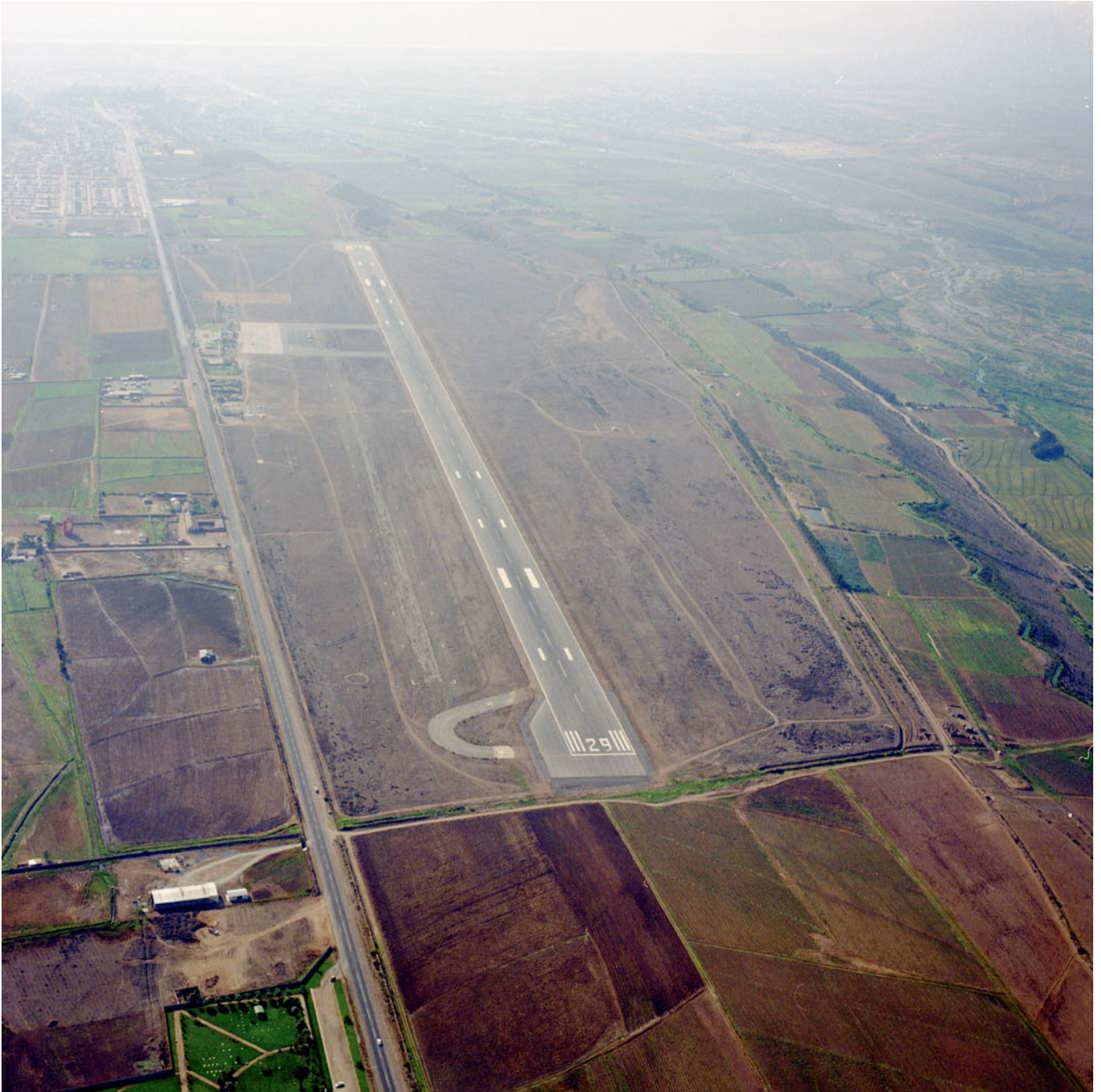
Aeropuerto La Florida de La Serena, 1998. Vista aérea del aeropuerto La Florida de La Serena, mirando hacia el poniente.