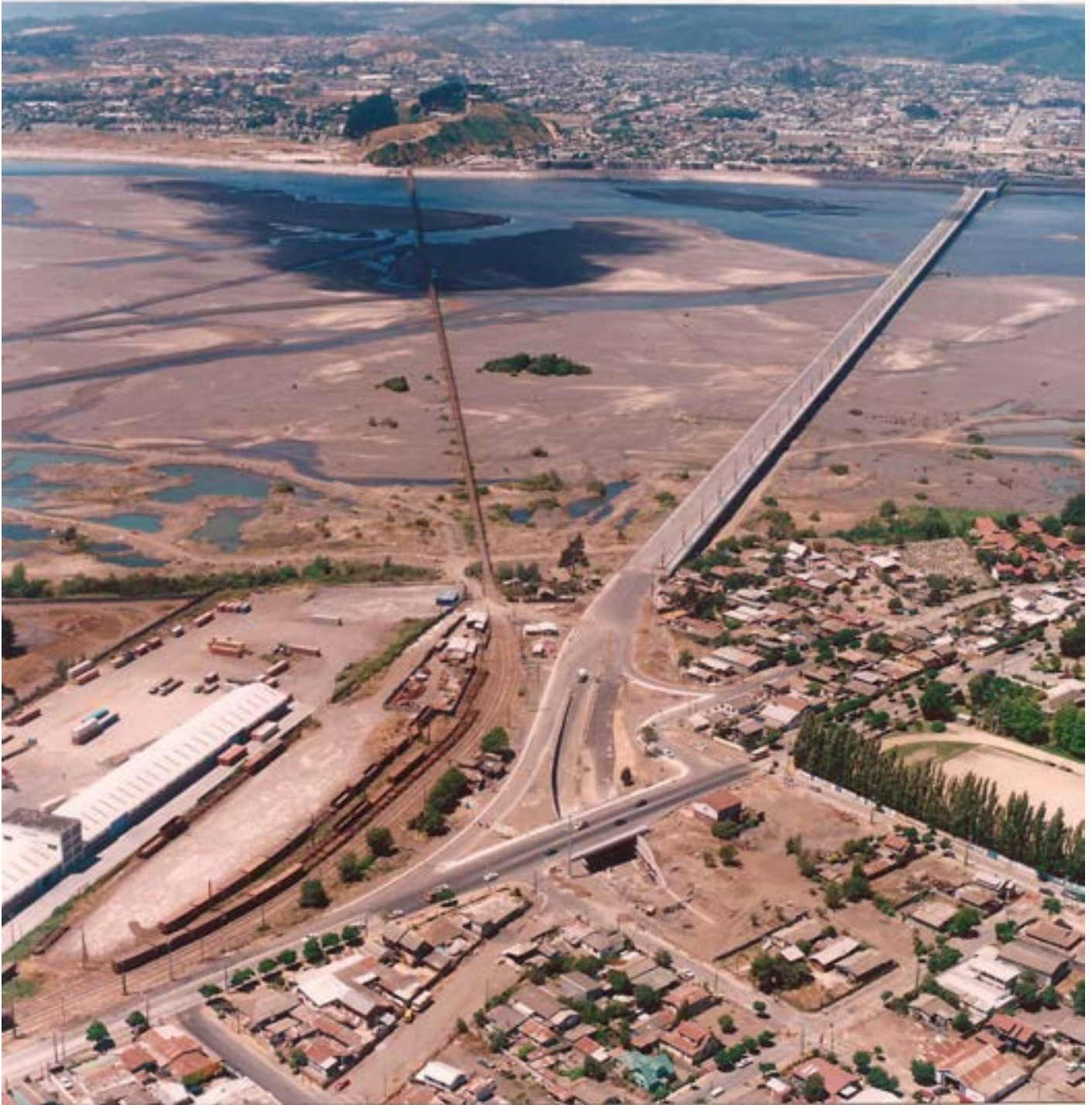
Puente Llacolén de Concepción en fase final de obras, 1999, Diciembre. Imagen aérea del puente Llacolén en su fase final de obras desde la ribera donde se ubica San Pedro de La Paz. Se ven las dos orillas del río Biobío y los puentes Ferroviario y Llacolén.