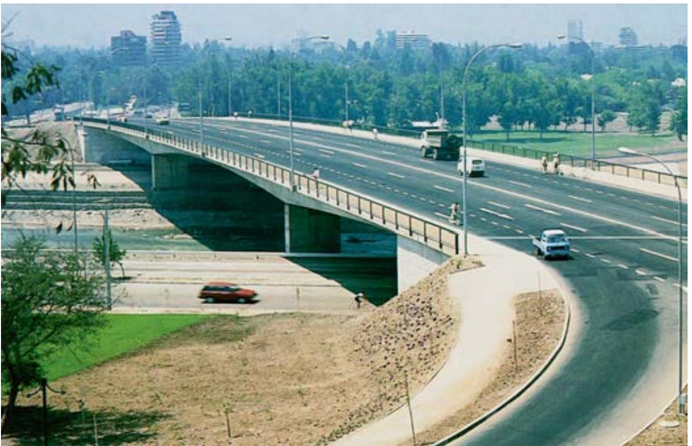
Puente del Centenario, 1988.

Imagen aérea del Puente Itata, ubicado sobre el río del mismo nombre, en la carretera El Conquistador, al norte de la ciudad de Coelemu. Obra ejecutada por la empresa constructora Fe Grande. Fotógrafo desconocido.