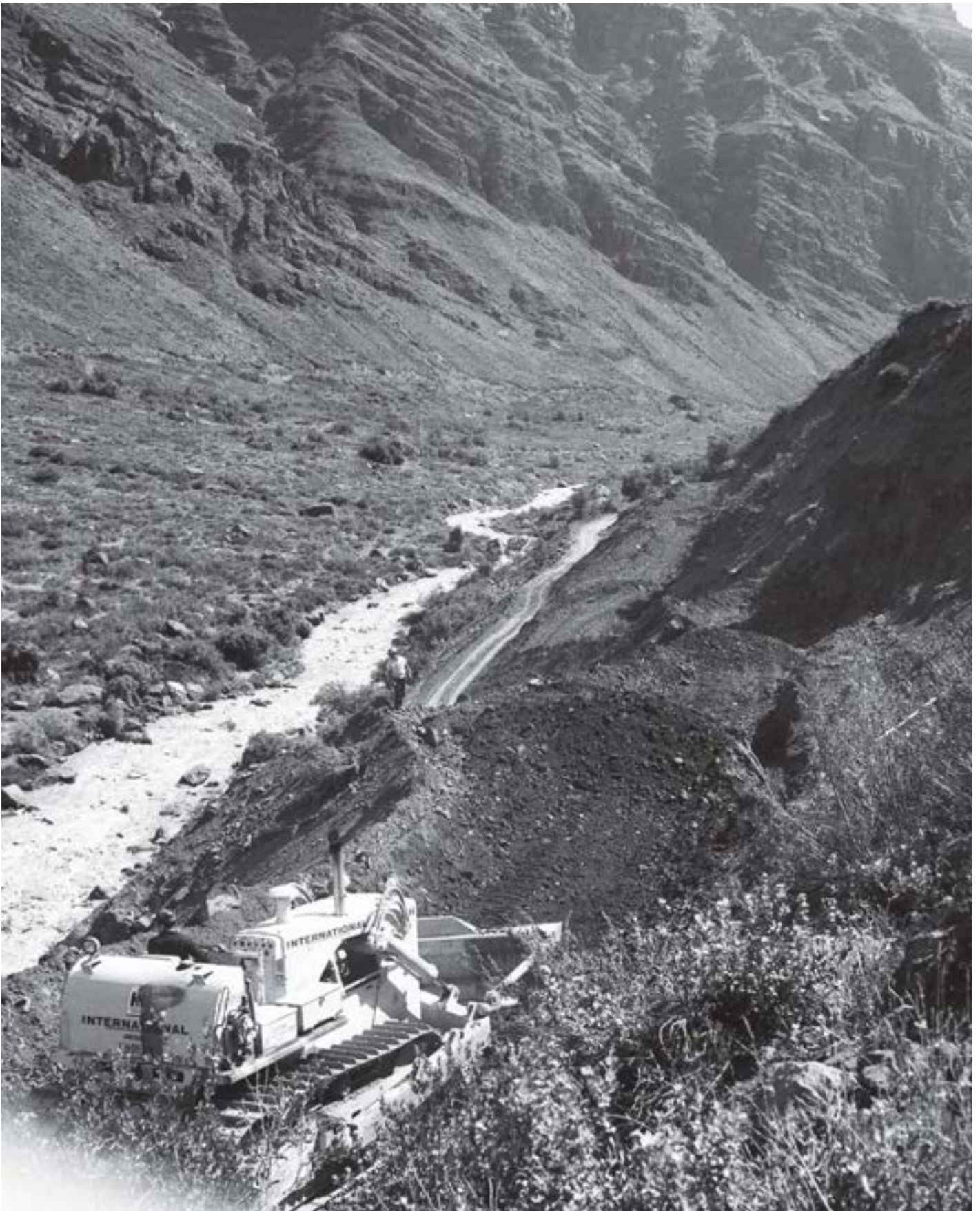
Construcción del camino internacional Los Libertadores, 1968.

Un bulldozer desplaza tierra durante la construcción de la carretera Los Andes - Los Libertadores (ruta 60).