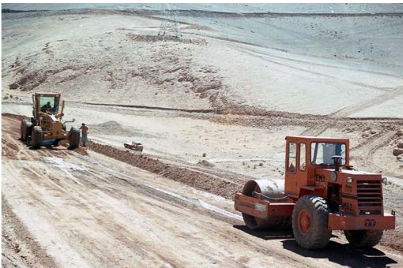
Construcción del camino a la mina Los Pelambres, 1995.

Acceso del túnel bajo el cerro San Cristóbal durante su construcción. Obra ejecutada por la constructora Vespucio Norte (consorcio conformado por la española Dragados, la alemana Hochtief y las chilenas Belfi y Brotec). También se aprecia una retroexcavadora y un camión hormigonera.