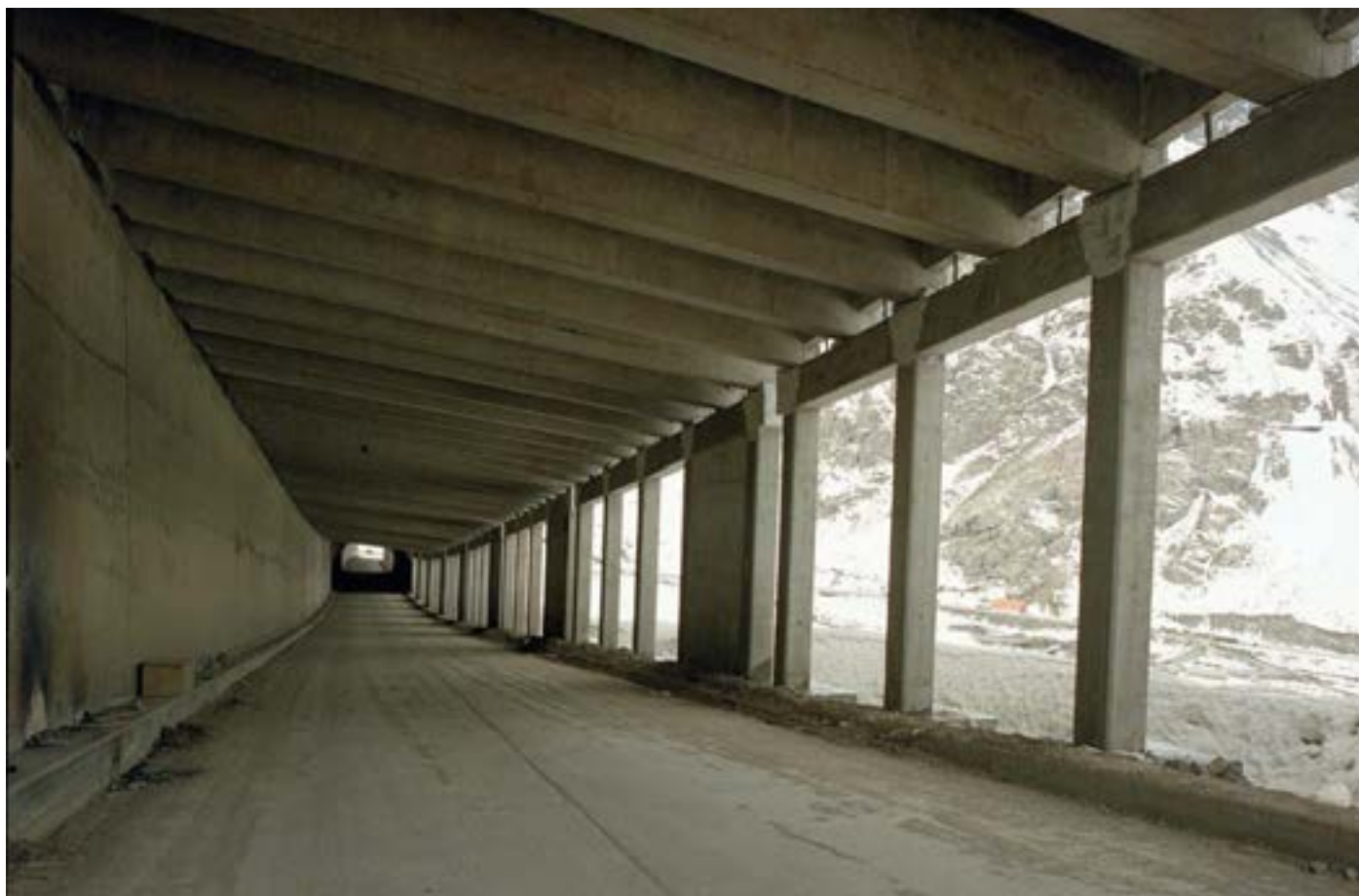
Túnel de prevención contra rodados en la ruta 60, 1992.

Imagen general de un túnel de protección contra rodados, en la ruta 60 (Los Andes - Paso Los Libertadores), región de Valparaíso. Obra hecha por la constructora Besalco.