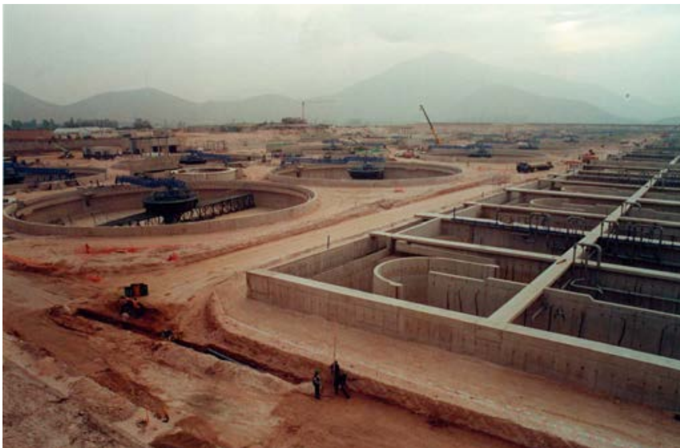
Clarificadores secundarios y estanques de aireación en La Farfana, 2003, Mayo. Vista a clarificadores secundarios y a los estanques de aireación. A un costado se aprecia a tres obreros cavando y midiendo el terreno.