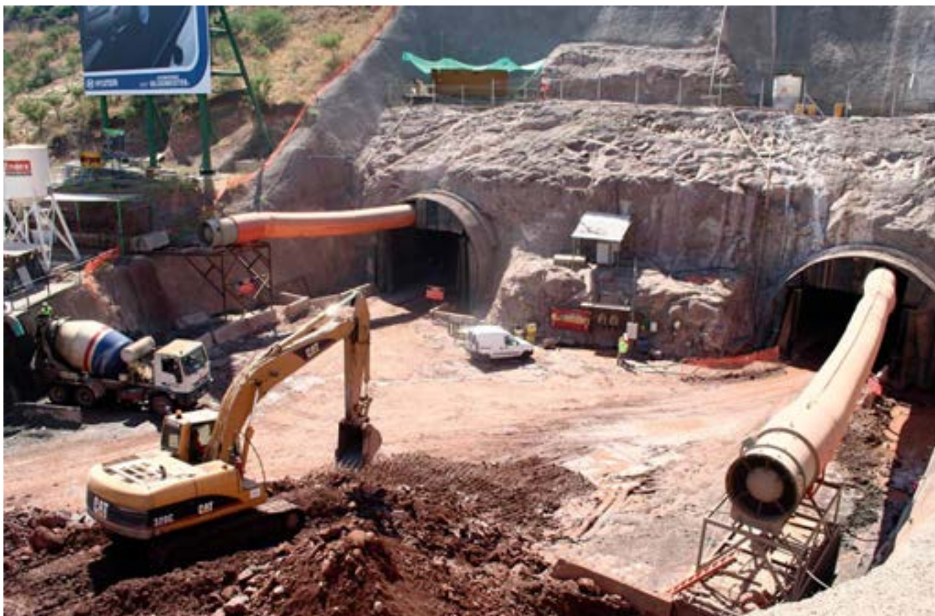
Construcción del túnel San Cristóbal, 2007, Enero.

Acceso del túnel bajo el cerro San Cristóbal durante su construcción. Obra ejecutada por la constructora Vespucio Norte (consorcio conformado por la española Dragados, la alemana Hochtief y las chilenas Belfi y Brotec). También se aprecia una retroexcavadora y un camión hormigonera.