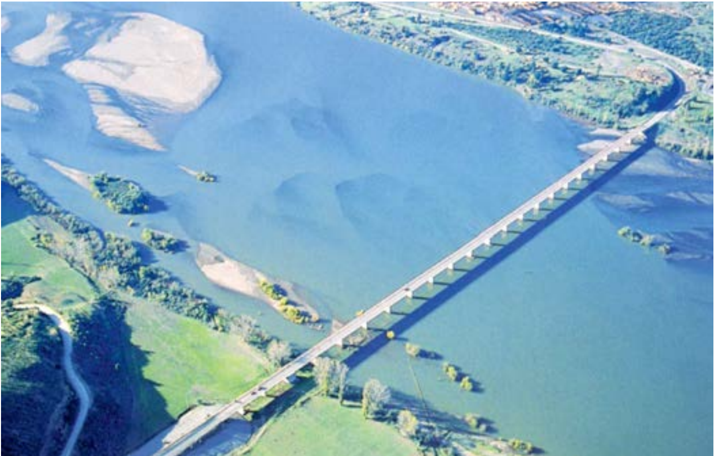
Puente Itata, 1984.

Imagen aérea del Puente Itata, ubicado sobre el río del mismo nombre, en la carretera El Conquistador, al norte de la ciudad de Coelemu. Obra ejecutada por la empresa constructora Fe Grande.