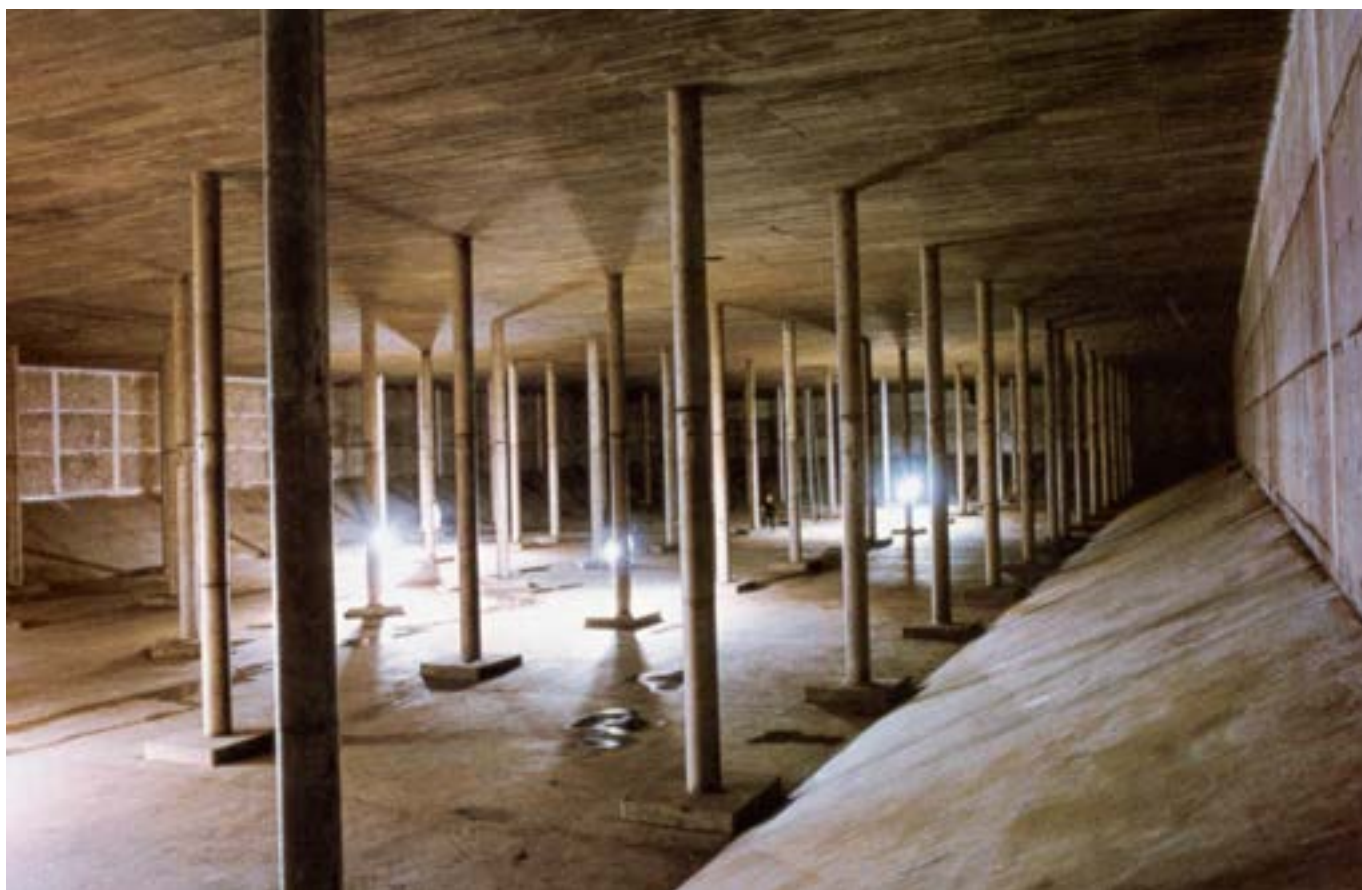
Estanque Lo Hermida, 1995.

Imagen general de un túnel de protección contra rodados, en la ruta 60 (Los Andes - Paso Los Libertadores), región de Valparaíso. Obra hecha por la constructora Besalco.