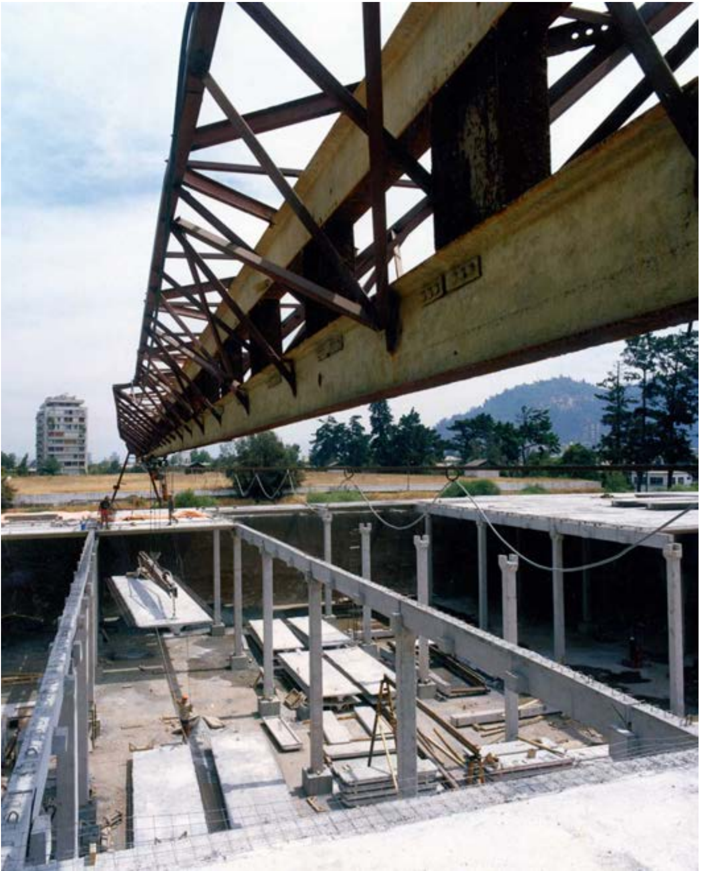
Canal de devolución del complejo Colbún - Machicura, 1985, Octubre. Imagen aérea en perspectiva del canal de devolución del complejo Colbún - Machicura.