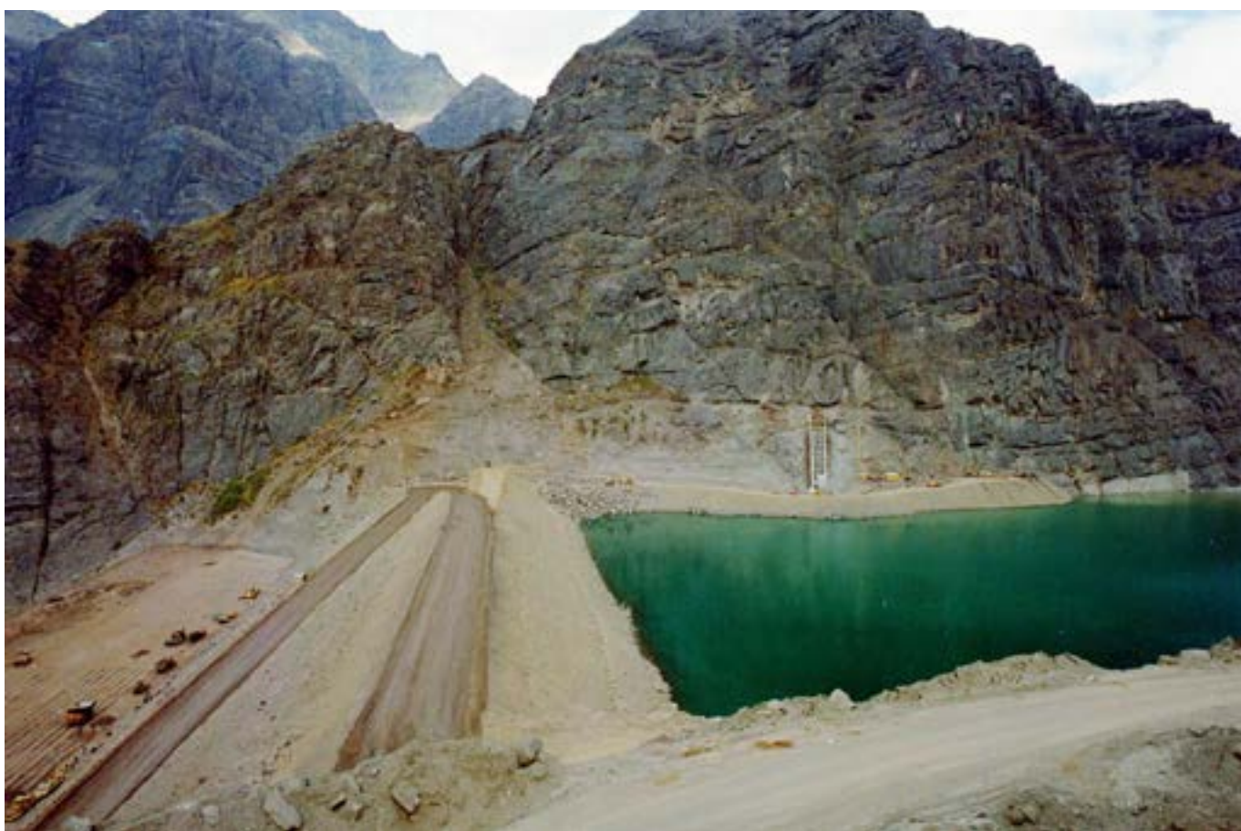
Construcción camino embalse Los Leones, 1997. Plano general de construcción del camino de acceso a embalse Los Leones en la provincia de Los Andes, región de Valparaíso.