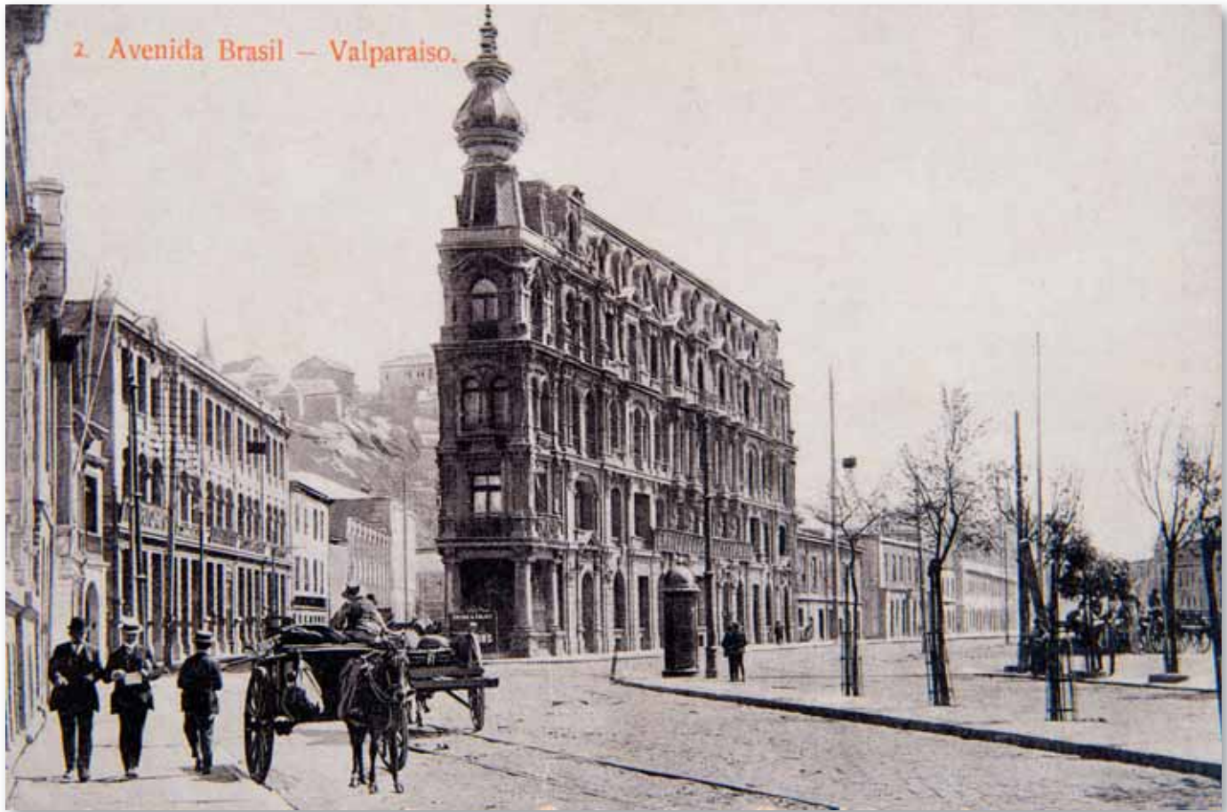
2. Avenida Brasil — Valparaíso.