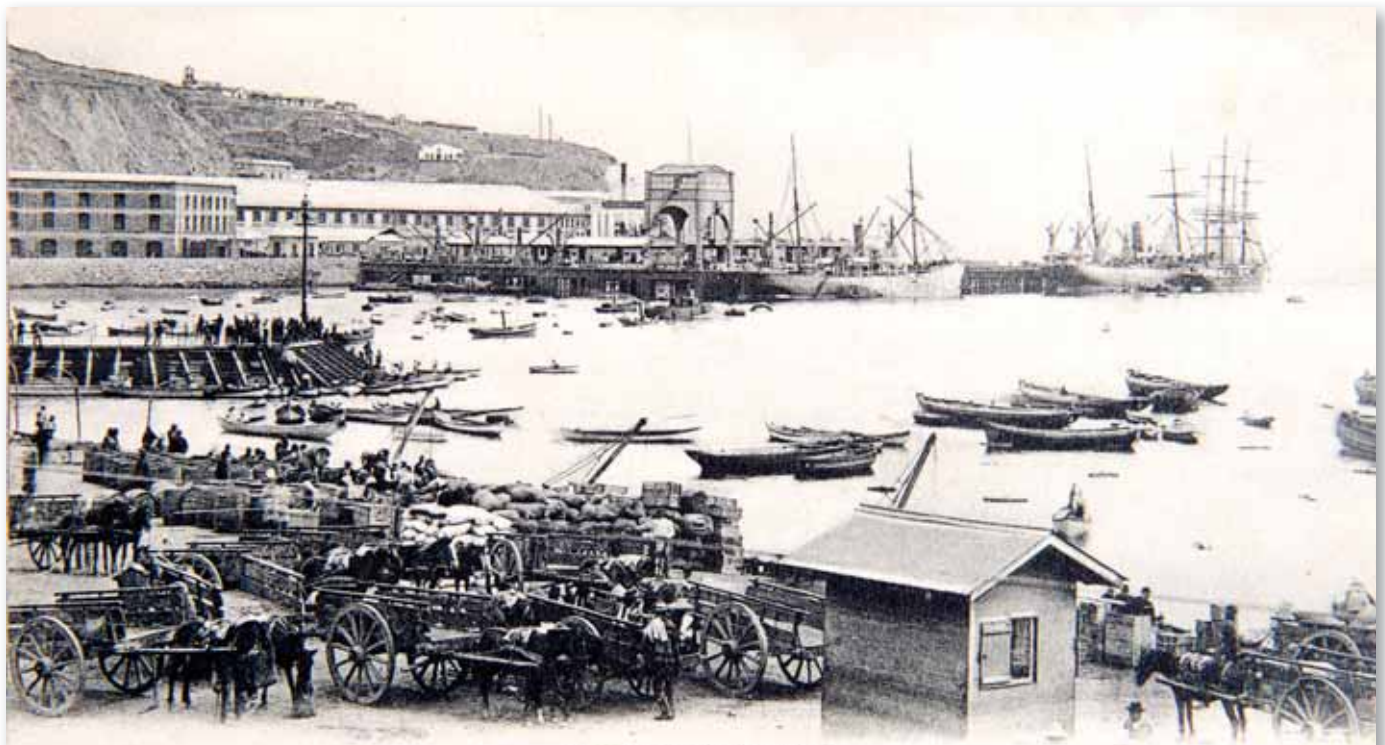
Puerto de Valparaíso

4691 Propiedad de C. Kirsinger & Cia., Valparaíso Santiago Concepcion