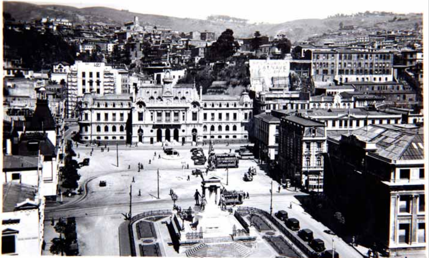
Valparaíso (Chile), Plaza Sotomayor

Plaza Sotomayor, Valparaíso (Chile), 1945.