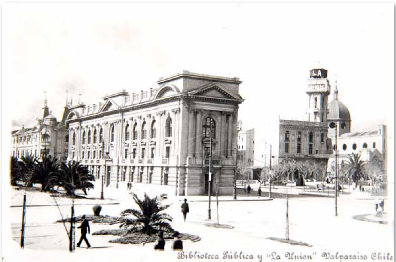
Biblioteca Pública y "La Unión" Valparaíso Chile

Imagen del edificio Brown, que se ubicaba en la avenida Brasil con Bellavista, en la ciudad de Valparaíso. Rachitoff, J. S.