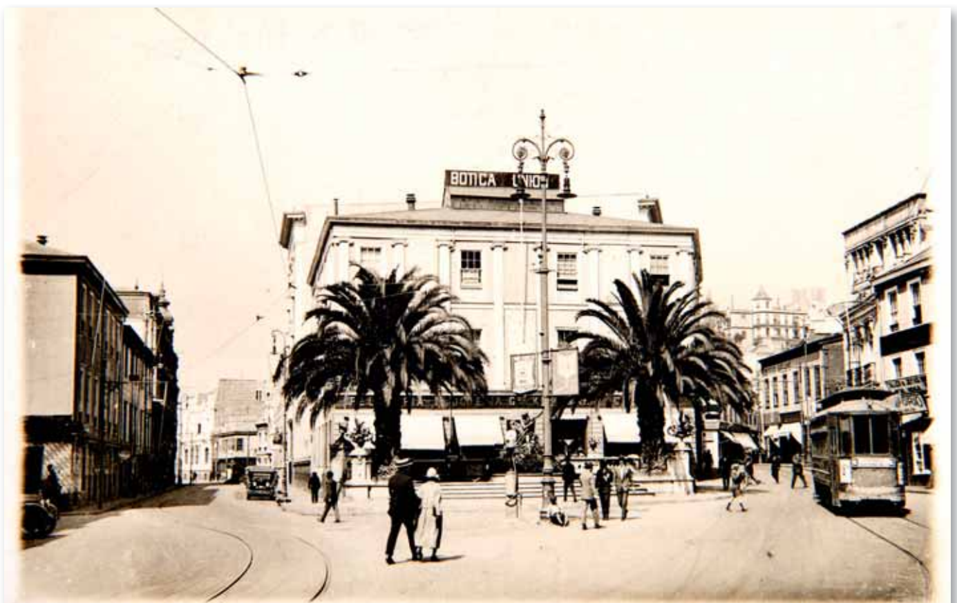
Imagen general de la bahía del puerto de Valparaíso durante la primera mitad del siglo XX.