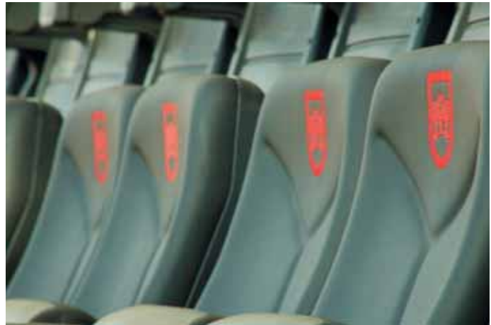
El estadio está equipado con butacas individuales, un sector VIP y otro habilitado especialmente para la prensa.

Para el recordado comentarista Julio Martínez, el Sausalito de Viña del Mar y La Portada de La Serena, fueron los mejores coliseos deportivos levantados en la historia de Chile. Un honor que este último, edificado en 1952 bajo el gobierno de Gabriel González Videla, mantuvo hasta 2008, cuando varios estadios fueron remodelados en la antesala del mundial de fútbol femenino.