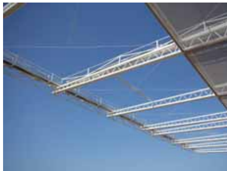
Con capacidad para albergar 18.500 espectadores, el estadio incorpora una cubierta textil en el sector Pacífico y con un anillo de cubierta de tensoestructura.

de gran envergadura en Chile. Ofrece gran estabilidad dimensional, debido a que su tejido no se deforma durante su uso o instalación y combina resistencia, bajo espesor y flexibilidad”, agrega el jefe del Departamento de Edificación de Copasa.