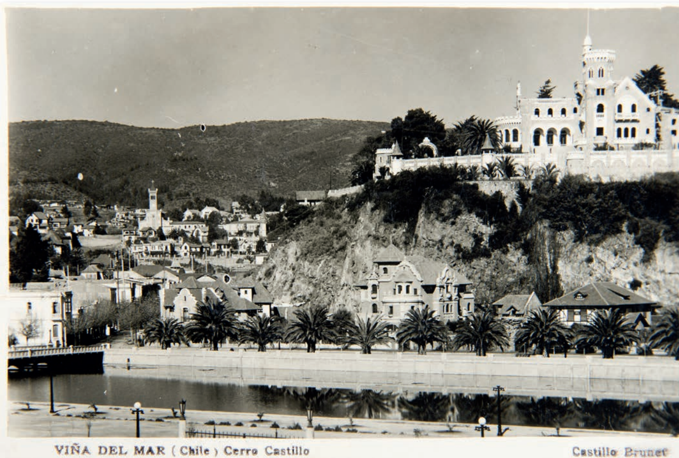
VIÑA DEL MAR ( Chile ) Cerro Castillo