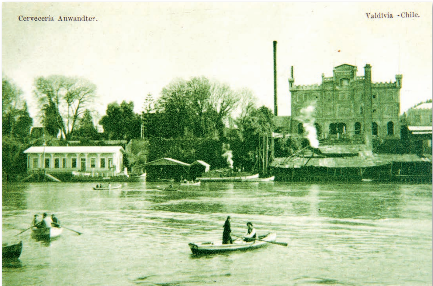
Cerveceria Anwandter: Valdivia - Chile, 1918. Imagen del río Valdivia y las instalaciones de la cervecería Anwandter (a la derecha). Este edificio sería destruido por el terremoto de 1960.