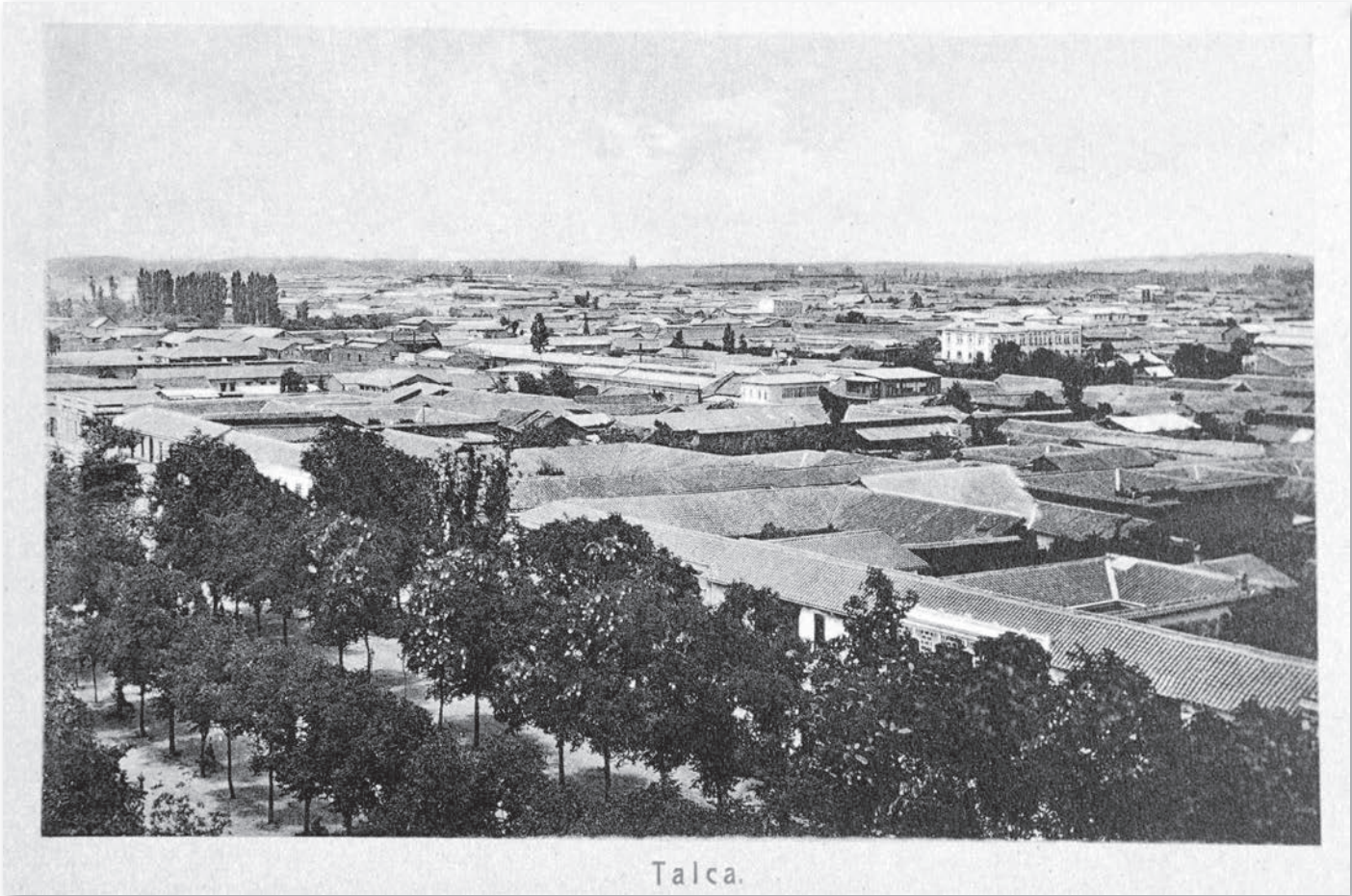
Talca, s.f. Panorámica de la ciudad de Talca. Imagen anterior al terremoto de 1928. Editor: Eusebio Forno.