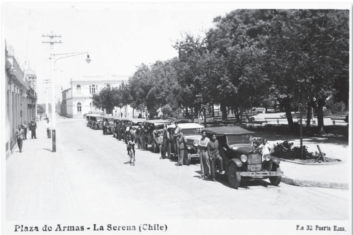
Plaza de armas - La Serena (Chile), s.f. Perspectiva de la calle Catedral (actual Gregorio Cordovez) de La Serena. A la derecha se aprecia la plaza de armas de la ciudad. Editor: Puerta Hnos.