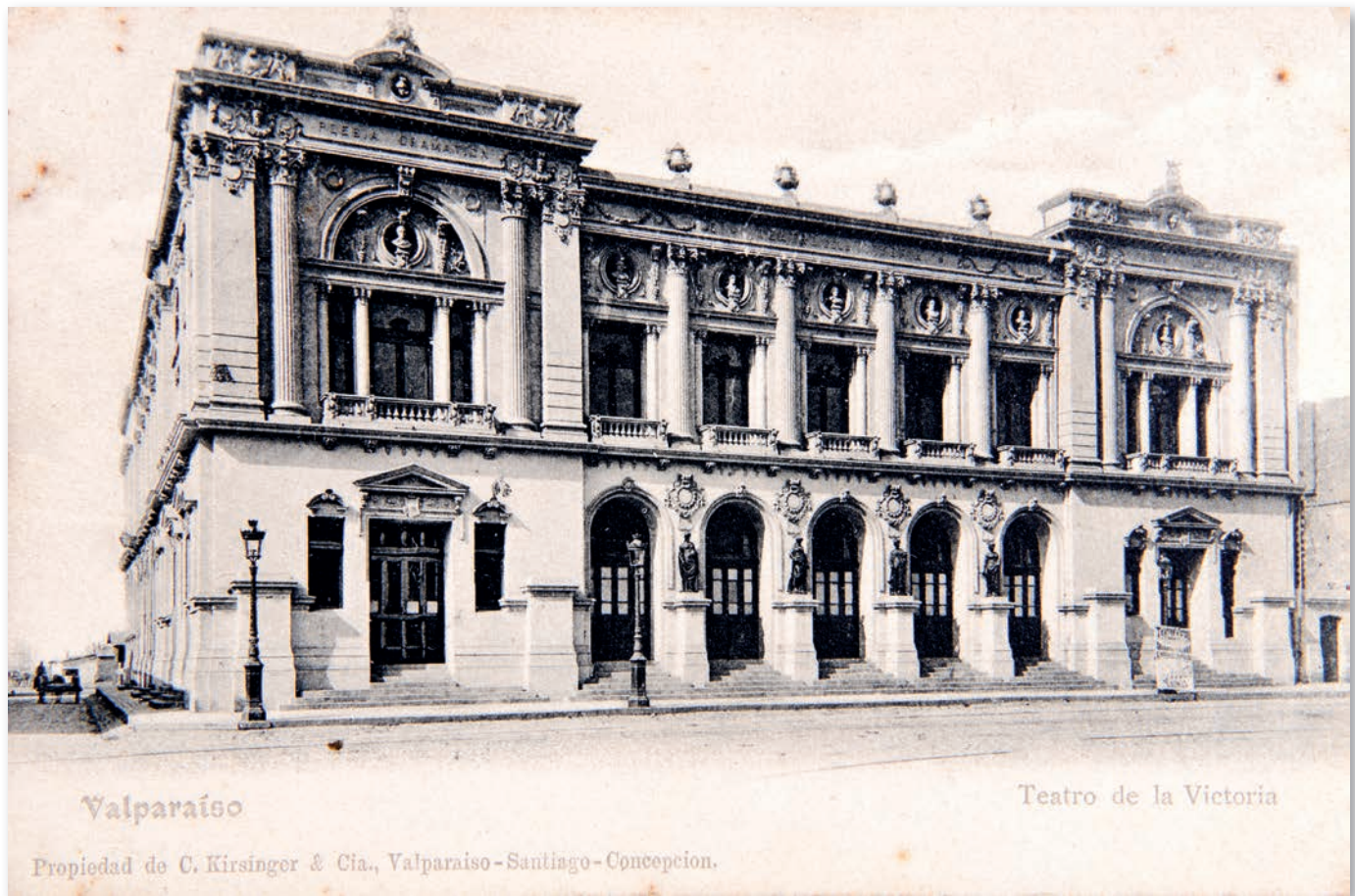
Valparaíso: Teatro de la Victoria, s.f. Fachada del Teatro de la Victoria, que se ubicaba en la actual plaza Simón Bolívar de Valparaíso. La imagen es anterior al terremoto de 1906, donde este edificio fue destruido. Editor: C. Kirsinger & Cia.