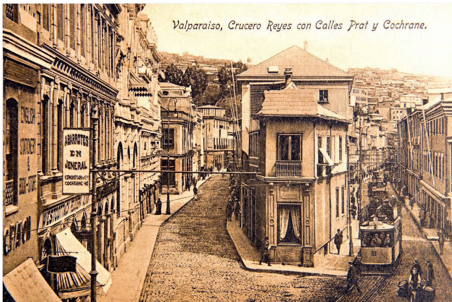
Valparaíso, Cruceiro Reyes con calles Prat y Cochrane, 1914. Imagen del lugar donde la calle Esmeralda se bifurca en Prat y Cochrane, en la esquina con Gómez Carreño (ex Cruz de Reyes; en la postal se cita el nombre erróneamente), Valparaíso. Fotografía anterior a la construcción del edificio Edwards (conocido como reloj Turri).