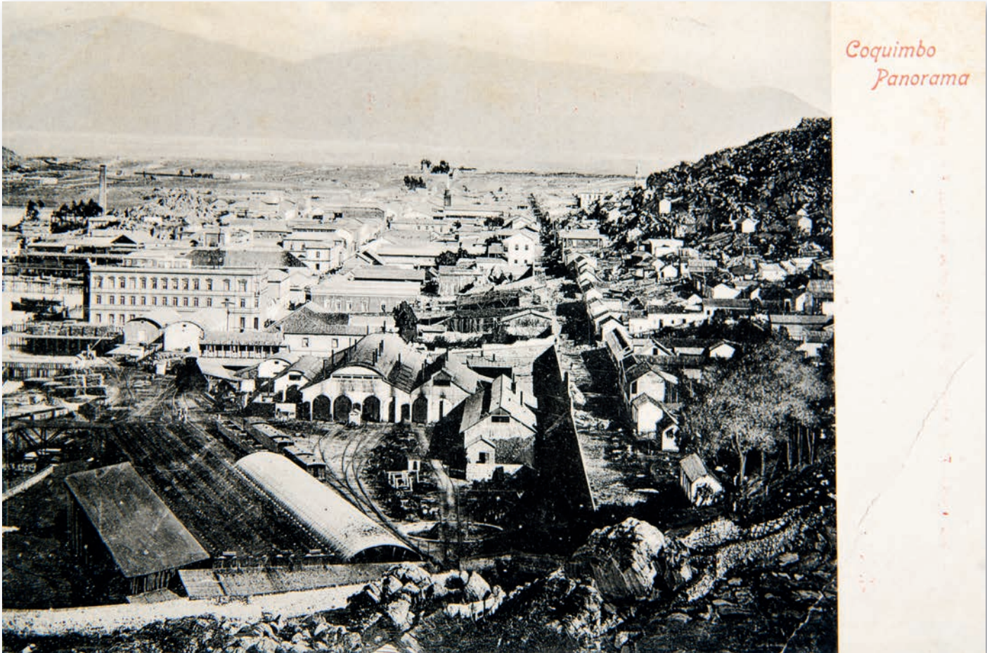
Coquimbo panorama, s.f. Perspectiva de la calle Anibal Pinto hacia el oriente en el puerto de Coquimbo. Editor: Carlos Brandt.