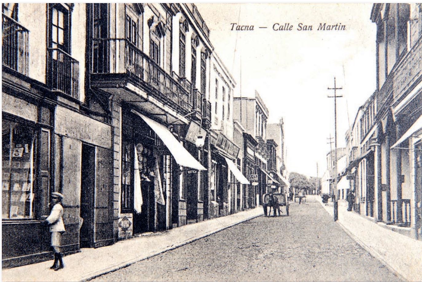
Perspectiva de la calle San Martín en Tacna. Imagen correspondiente a la época en que esa ciudad estaba bajo administración chilena (1880 - 1929).