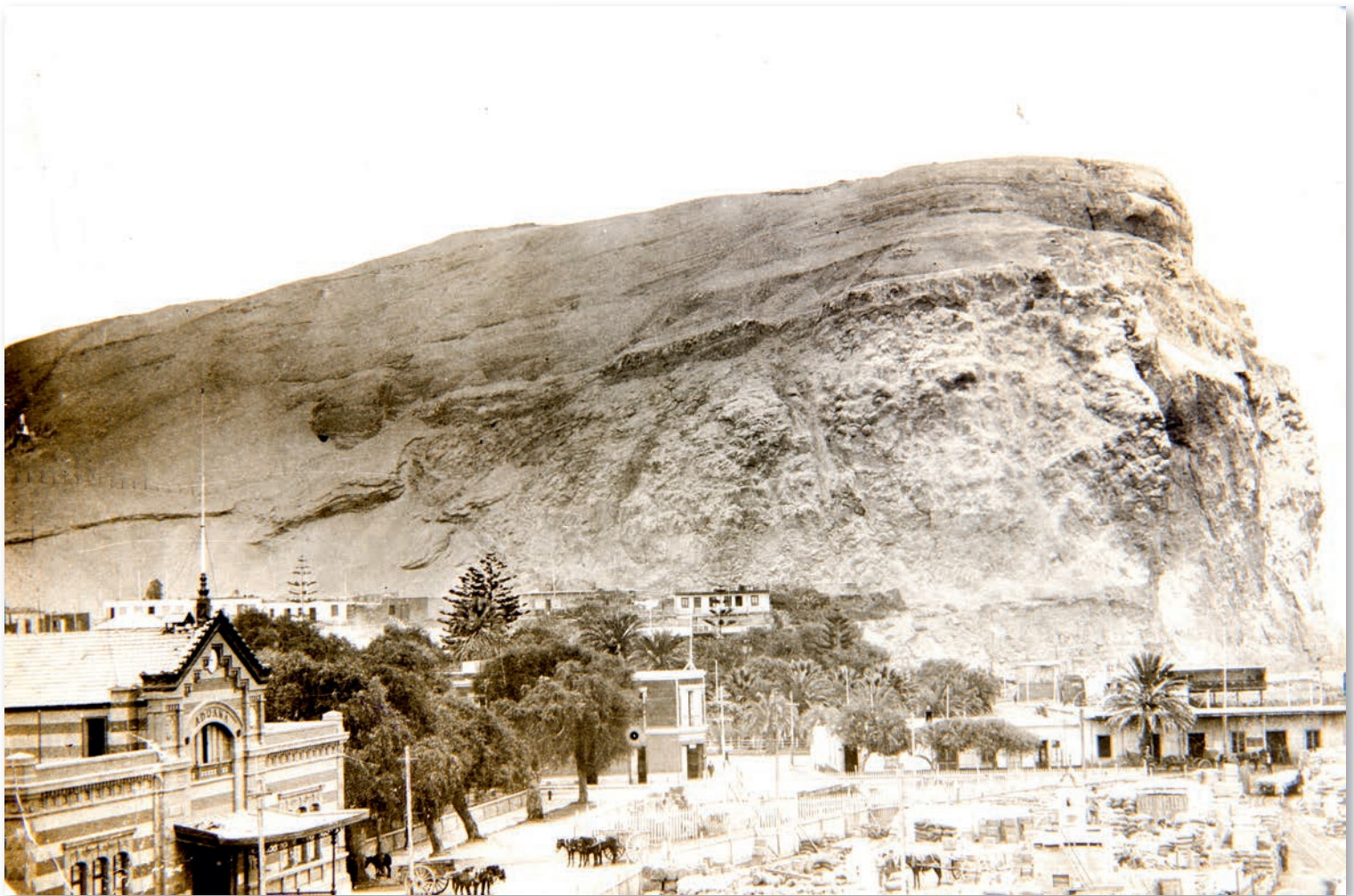
Morro de Arica, 1925. Imagen de la cara norte del morro de Arica. Sa ve parte de la ciudad y, a la izquierda, el edificio de la aduana.