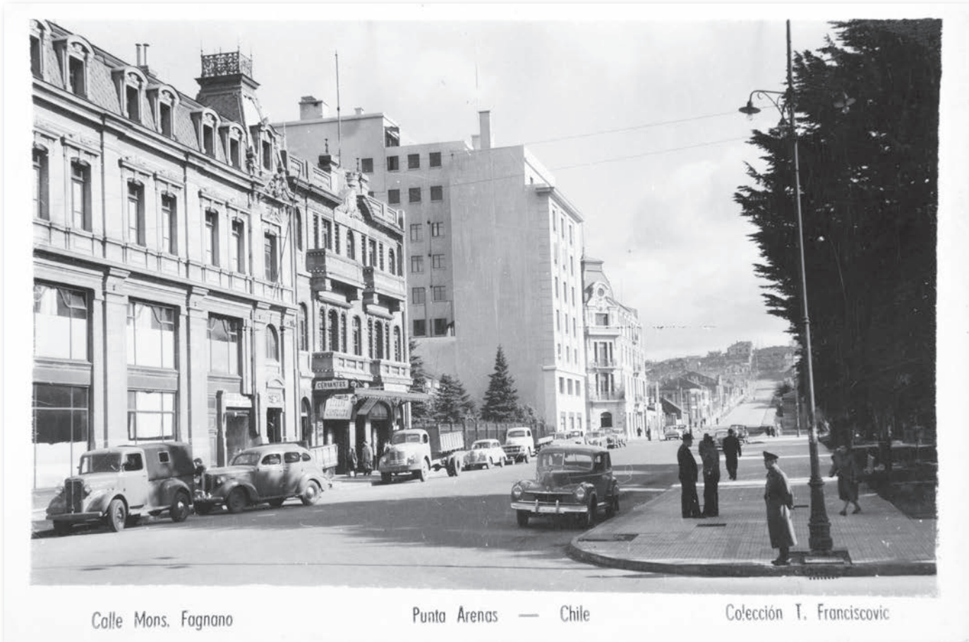
Calle Mons. Fagnano