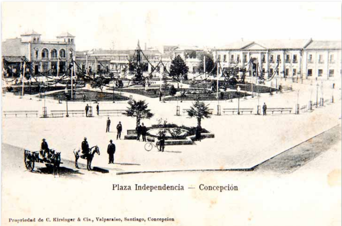
Plaza Independencia — Concepción

Propiedad de C. Kirsinger & Cía., Valparaiso, Santiago, Concepcion