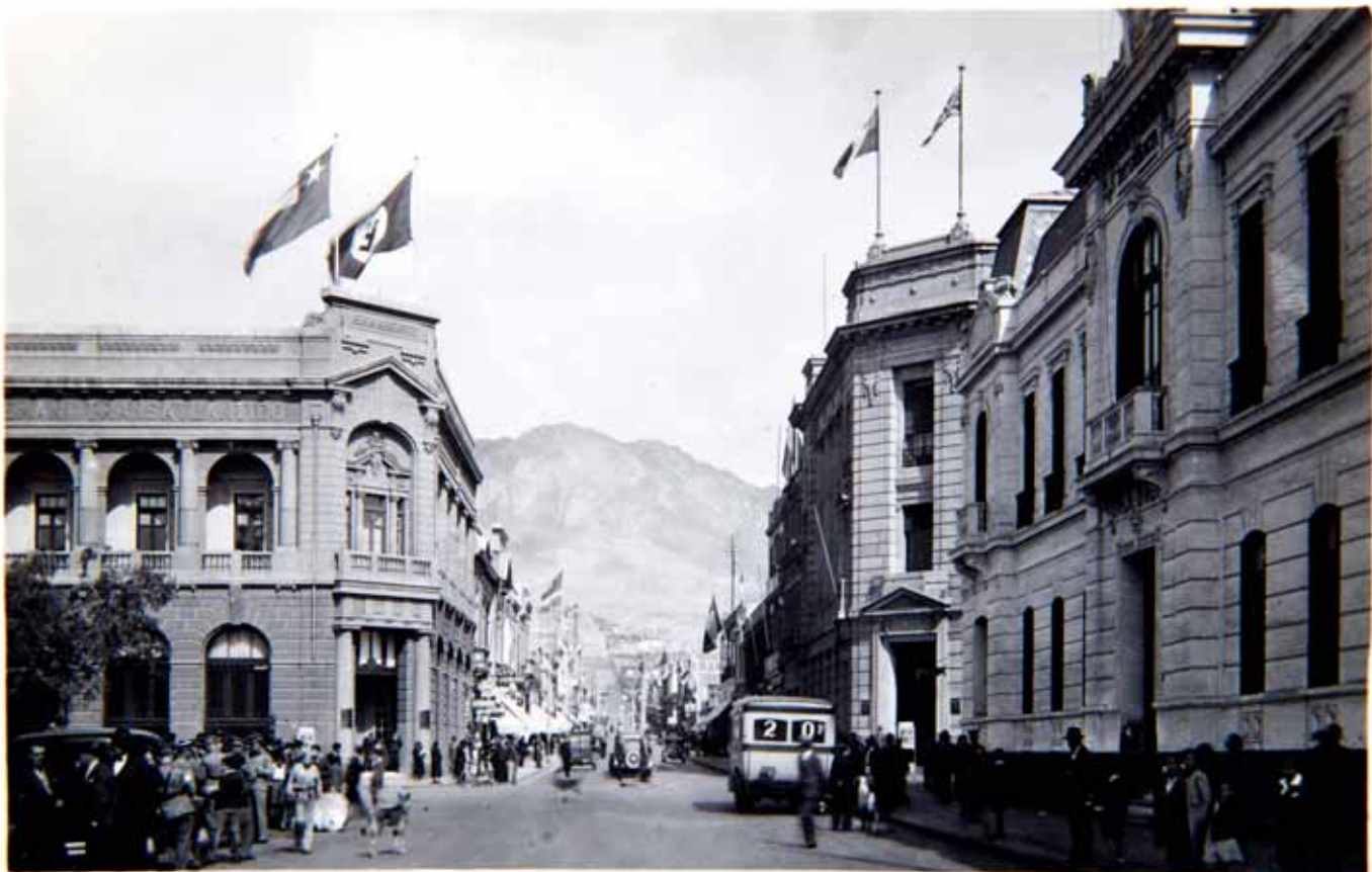
ANTOFAGASTA (Chile), Calle A.Prat