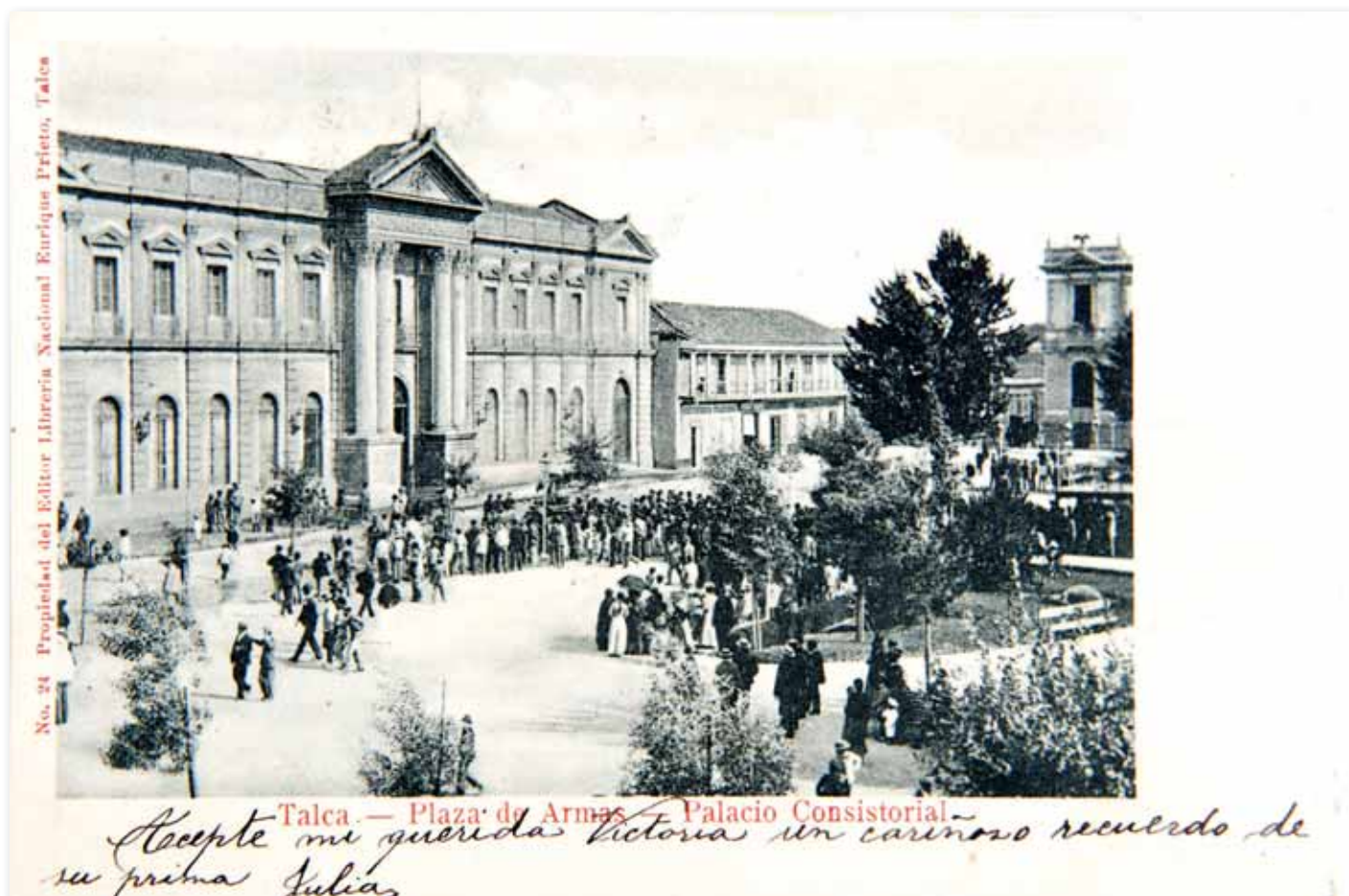
Plaza de Armas y Palacio Consistorial, Talca. Imagen del palacio Consistorial de Talca, que se ubicaba en la calle Uno Oriente, frente a la plaza de armas. Imagen anterior al terremoto de 1928 que lo destruyó. Autor: Librería Nacional Enrique Prieto.