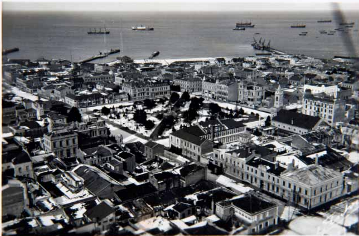
Punta Arenas - Vista Aérea media altura

PRESENTAMOS POSTALES TOMADAS EN LA PRIMERA MITAD DEL SIGLO XX EN LAS PRINCIPALES CIUDADES DE CHILE. PLAZAS DE ARMAS, AVENIDAS, EDIFICIOS PÚBLICOS Y HASTA UNA IMAGEN DE TACNA CUANDO FORMABA PARTE DEL TERRITORIO NACIONAL, DAN MUESTRAS DEL PATRIMONIO CONSTRUCTIVO DEL PAÍS.