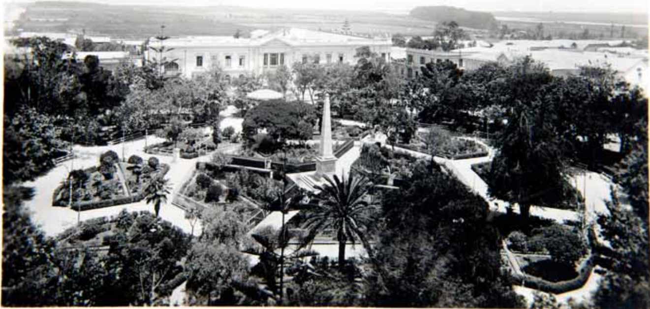
Plaza de Armas de La Serena

Arriba, Plaza de Armas de La Serena. Imagen desde un punto de vista elevado de la plaza de armas de La Serena, mirando hacia el noreste. Abajo: Antofagasta, calle A. Prat. Perspectiva de la calle Arturo Prat desde la esquina con San Martín. A la izquierda se ve el edificio del banco Alemán Transatlántico, y a la derecha en primer término la intendencia regional y el banco Anglo Sudamericano, parcialmente tapado. La imagen corresponde a fines de la década de 1930 o principios de 1940.